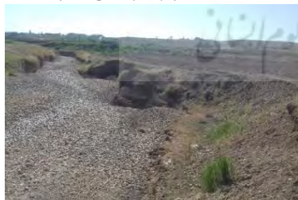
شکل ۶: تصویری از مقطع شماره ۱۳