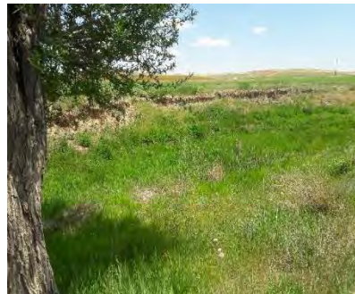
شکل ۷: تصویری از مقطع شماره ۴۷

حفاظت سطحی: این پارامتر غیر از پوشش گیاهی، بقایای شاخ و برگ درختان و وجود پوشش‌های سنگی در کف و کناره‌های رودخانه را نیز شامل می‌شود. بر اساس نتایج جدول (۳)، اختلاف معنی‌داری در سطح اعتماد ۹۹ درصد بین مقادیر "حفاظت سطحی" کلاس‌های مختلف فرسایش کناری مشخص شده بر اساس روش BEHI کامل، وجود دارد و این امر نشان‌دهنده تفاوت مکانی زیاد این پارامتر و نقش مهم آن در تعیین کلاس‌های فرسایش کناری حوضه مورد بررسی است.