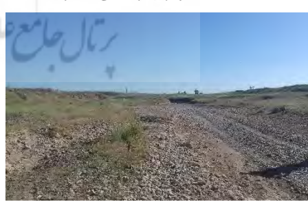
شکل ۵: تصویری از مقطع شماره ۱۲

تراکم ریشه‌ها: بر اساس نتایج جدول (۳) اختلاف معنی داری در سطح اعتماد ۹۹ درصد بین مقادیر "تراکم ریشه‌ها" کلاس‌های مختلف فرسایش کناری مشخص شده بر اساس روش BEHI کامل وجود دارد و این امر نشان‌دهنده تفاوت مکانی زیاد این پارامتر و نقش مهم آن در تعیین کلاس‌های فرسایش کناری حوضه مورد بررسی است. این پارامتر در واقع تعیین‌کننده میزان زبری بستر و کناره‌هاست و به طور مستقیم با نوع پوشش گیاهی کف و کناره‌ها در ارتباط است. هرچه میزان تراکم ریشه زیاد باشد؛ فرسایش به میزان زیادی کاهش می‌یابد. میزان فرسایش در مقاطع ۲۷، ۳۰، ۳۱، ۴۷، ۴۸، ۴۹، ۵۰، ۵۱، ۵۲، ۵۳، ۵۷، ۵۸، ۵۹، ۶۰، ۶۱، ۶۲ و ۶۳ کم گزارش شده است. با توجه به شکل‌های ۷ و ۸ تأثیر پوشش