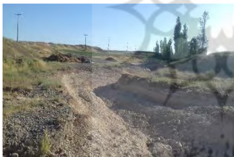
شکل ۴: تصویری از مقطع شماره ۱۱

نسبت عمق متوسط ریشه به ارتفاع کرانه: بر اساس نتایج جدول (۳) اختلاف معنی داری در سطح اعتماد ۹۹ درصد بین مقادیر "نسبت عمق متوسط ریشه به ارتفاع کرانه" کلاس‌های مختلف فرسایش کناری مشخص شده بر اساس روش BEHI کامل وجود دارد و این امر نشان‌دهنده تفاوت مکانی زیاد این پارامتر و نقش مهم آن تعیین کلاس‌های فرسایش کناری حوضه مورد بررسی است. در مقاطع نمونه‌برداری برای این پارامتر، مقادیر متنوعی ثبت شده، اما در کل این پارامتر نشان‌دهنده نبود گیاهان با ریشه‌های عمیق در بیشتر سواحل جانبی مقاطع مورد بررسی رودخانه است و در بیشتر موارد کناره‌ها دارای پوشش گیاهی از نوع گیاهان علفی بوده و کمتر پوشش درختی به چشم می‌خورد و حتی گاهی هیچ‌گونه پوشش گیاهی در کناره‌ها دیده نمی‌شود. اشکال ۳، ۴، ۵ و ۶ مربوط به مقاطع ۹، ۱۱، ۱۲ و ۱۳ است؛ که در آن‌ها میزان خطر فرسایش کناری بالایی برآورد شده است و یکی از دلایل آن وجود پوشش زراعی و علفی و در مواردی عدم وجود پوشش گیاهی می‌باشد.