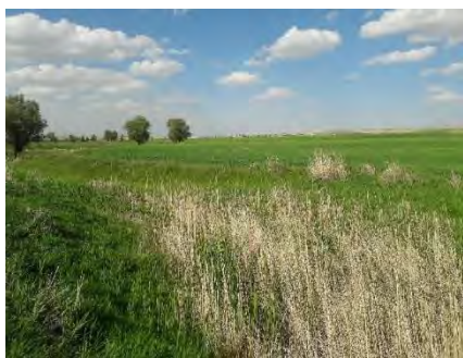
شکل ۸: تصویری از مقطع شماره ۴۸

گیاهی و تراکم ریشه در مقاطع ۴۷ و ۴۸ بارز است، اما در مورد مقاطع ۵۰، ۵۱، ۵۲، ۵۳، ۵۷، ۵۸، ۵۹، ۶۰، ۶۱، ۶۲ عوامل دیگری غیر از تراکم ریشه سبب کاهش خطر فرسایش کناری شده است زیرا تراکم ریشه در این مقاطع کم می‌باشد.