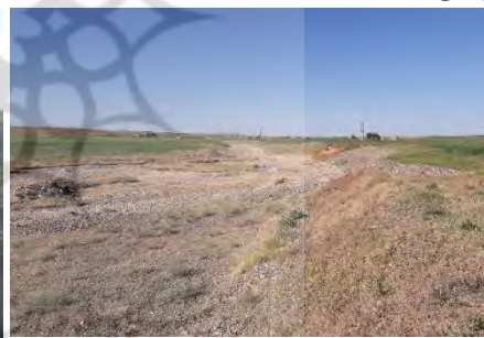
شکل ۳: تصویری از مقطع شماره ۹