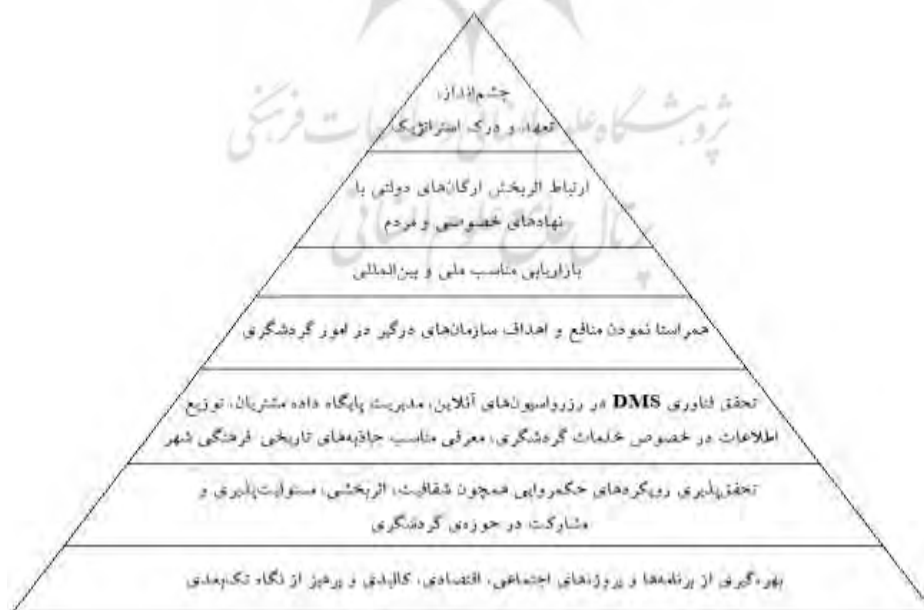
شکل (۴). الگوی مدیریت توسعه‌ی گردشگری تاریخی- فرهنگی

با توجه به نتایج مستخرج می‌توان گفت که در راستای توسعه‌ی گردشگری تاریخی- فرهنگی تبریز نیاز به یک رویکرد یکپارچه در برنامه‌ها و پروژه‌ها احساس می‌گردد و این مهم از طریق افزایش ظرفیت‌های سازمانی (شهرداری منطقه‌ی تاریخی- فرهنگی) و تحقق تعامل و مشارکت نهادی و همچنین مشارکت مردمی قابل دستیابی می‌باشد. از طرفی بایستی فناوری اطلاعات مناسب در راستای بازاریابی و تبلیغات گردشگری تاریخی- فرهنگی و شناخت دقیق از ترجیحات گردشگران مبدأ صورت پذیرد. در نهایت نیز با توجه به سنت‌ها و فرهنگ‌ها و برگزاری انواع جشنواره‌ها و مراسم خیابانی به افزایش جذابیت شهر و جاذبه‌های تاریخی- فرهنگی افزود. همچنین بررسی مقایسه‌ای یافته‌های تحقیق با مطالعات پیشین نیز نشان می‌دهد که تأثیر پیشران‌هایی همچون مدیریت سیستمی و یکپارچه و برنامه‌ریزی چندبعدی (تیموری و همکاران، ۱۳۹۳، یان، ۲۰۱۹ و حایق، ۲۰۲۰) و بازاریابی و تبلیغات مناسب (نوبین، ۱۳۹۶)، بر توسعه‌ی گردشگری نقطه اشتراک تحقیق حاضر با پیشینه‌ی مطالعاتی می‌باشد. از طرفی بهره‌گیری از پیشران‌های مدیریتی (ظرفیت‌های درون‌سازمانی و برون‌سازمانی) و تأکید بر تعاریف و ضوابط پروژه‌ها تفاوت اصلی با مطالعات گذشته محسوب می‌گردد که در نتایج مستخرج تأثیرگذار می‌باشند.