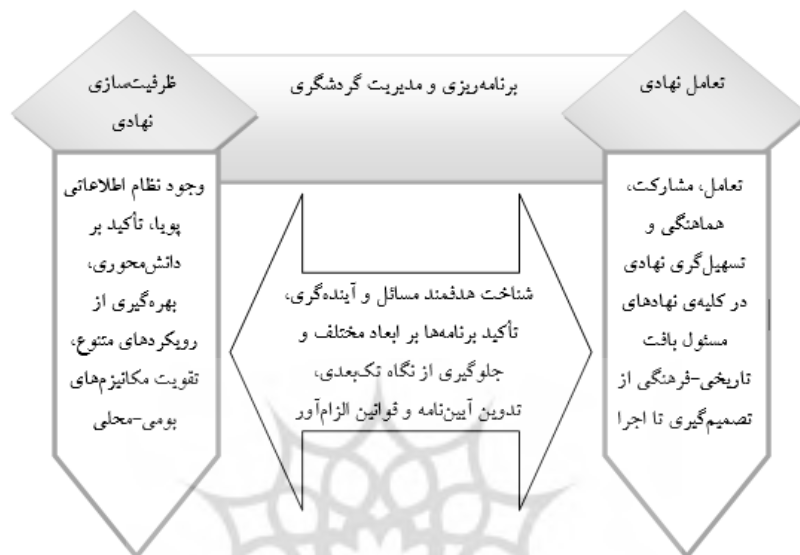
شکل (۱). مدل مفهومی تحقیق (برنامه‌ریزی و مدیریت گردشگری)

روانی برای توریست‌ها، هر دو سویه این مبادله‌ی پراهمیت، نفع مورد نظر را خواهند برد (جمالی، ۱۳۹۰: ۱۰۷). در راستای توسعه‌ی گردشگری نیاز به یک نظام مدیریتی قوی در زمینه‌ی بهره‌وری گردشگری و چهارچوب عرضه و تقاضا با تأکید بر توسعه‌ی پایدار است (پاپلی یزدی و سقایی، ۱۳۹۳: ۶۷). در این راستا امروزه روش برنامه‌ریزی شده‌ی مدیریتی برای توسعه‌ی گردشگری در سطوح مختلف به صورت یک اصل در بسیاری از نقاط پذیرفته شده است.