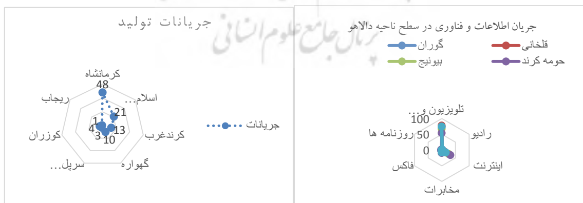
شکل ۲. نقاط شهری مراجعه جریان تولیدات ناحیه دالاهو

مطالعات میدانی، منابع درآمدی روستاها را می توان در دسته هایی نظیر زراعت، دامداری، باغداری، زنبورداری، کارگری بصورت روزمزد طبقه بندی کرد که در بخش حومه کنند در دهستان بان زرده بیشتر دامداری و باغداری و زنبورداری رواج دارد در دهستان بیونیح زراعت و تا حدی دامداری در اهمیت بالایی قرار دارد و در بخش گهواره زراعت و دامداری بیشترین درصد اشتغال را به خود اختصاص داده است.