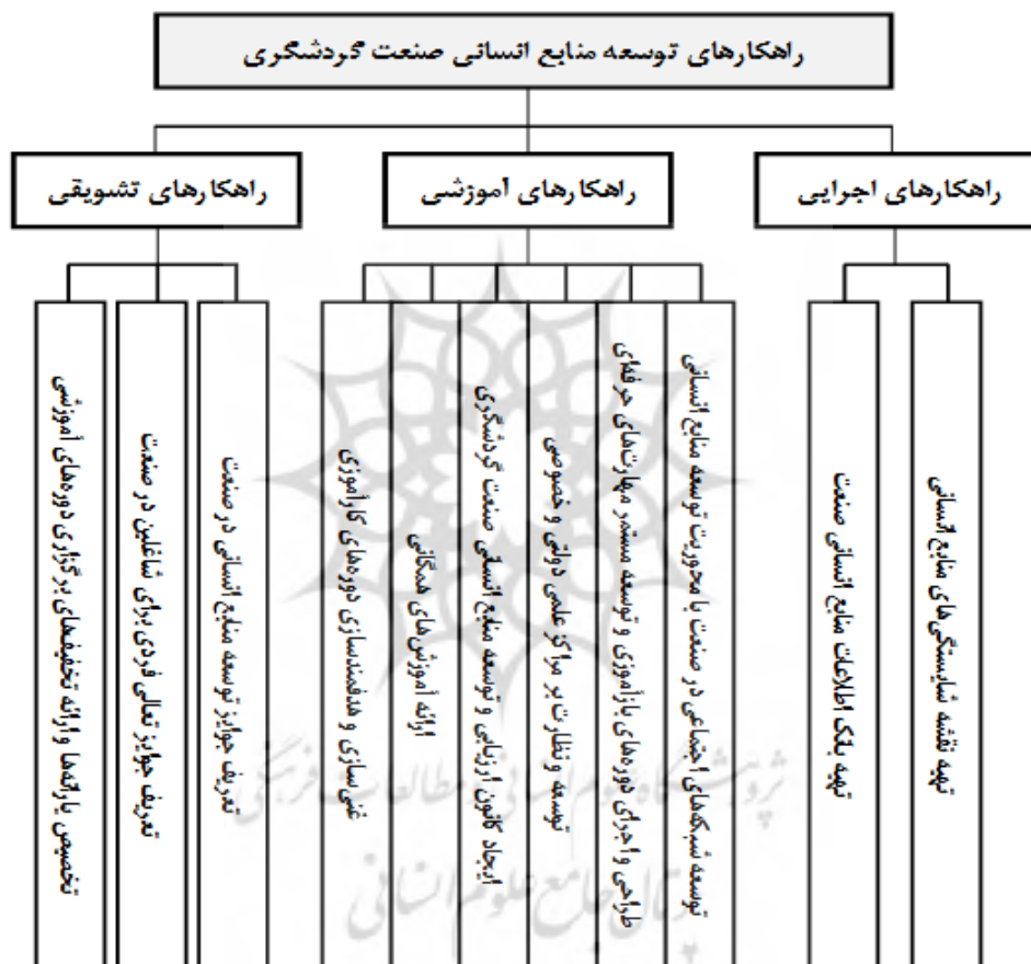
شکل - ۳: مدل راهکارهای توسعه منابع انسانی صنعت گردشگری

با توجه به تأیید مدل استخراج‌شده حاصل از روش تحلیل محتوای کیفی، شکل ۳ نشان‌دهنده مدل نهایی پژوهش است و یازده راهکار را در سه بُعد اجرایی، آموزشی و تشویقی نمایش می‌دهد