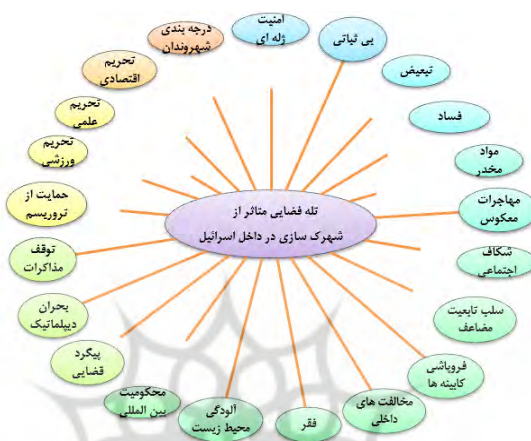
شکل (۵): مدل تله فضایی متأثر از شهرک سازی در داخل اسرائیل

خشونت و آشوب بوده و سطوح امنیت ملی این رژیم را متزلزل نموده بطوری که از آن به عنوان تله فضایی یاد می شود که در شکل (۵) نشان داده شده است: