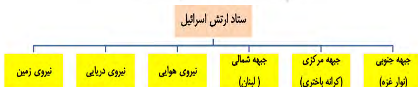
شکل (۴): نمودار گسترش ارتش اسرائیل