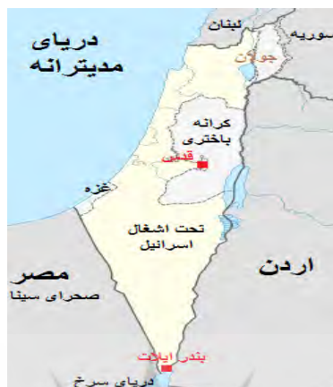
شکل (۱): نقشه فلسطین اشغالی

بعد از اشغال زمین‌های کرانه باختری فلسطین در جنگ ۶ روزه سال ۱۹۶۷ میلادی شهرک‌سازی و اسکان یهودیان در سرزمین‌های اشغالی کرانه باختری با طرح بزرگ شهرک‌سازی "ایگال آلون" آغاز شد (Maroof, 1995:97). رژیم اسرائیل با سیاست اشغال‌گری خود مناطق مهم - راهبردی و دارای منابع طبیعی قابل توجه (از جمله آب - خاک مرغوب جهت کشاورزی - موقعیت استراتژیک - دسترسی به دریا و راه‌های منطقه‌ای و نیز دارای ملاک‌های مذهبی و ...) را برای ایجاد شهرک انتخاب نمود و دست به ساخت و سازهای گسترده و اسکان یهودیان مهاجر زد، در این شهرک‌ها از نظر رژیم اسرائیل اشغال قطعی و غیرقابل بازگشت محسوب می‌شود. شهرک‌سازی در استراتژی‌های اصلی رژیم صهیونیستی از چنان جایگاه مهمی برخوردار است که علی‌رغم تلاش‌های بین‌المللی و حتی آمریکا در دوره اوباما برای توقف توسعه شهرک‌های اسرائیل، این رژیم نه تنها توسعه شهرک‌ها را متوقف نکرده بلکه آن را به عنوان راهبردی برای استمرار انتقال و اسکان یهودیان جهان به فلسطین ادامه داده و در دوره ریاست جمهوری ترامپ آن را توسعه داد.