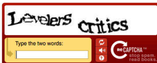
تصویر ۲- نسخه ۲ ریکپچا (google recaptcha v2)

با مشاهده موارد مذکور دریافتیم که جمع‌سپاری فعالیتی است که در دنیا در حوزه‌های مختلف با روش‌های متفاوتی در حال استفاده است. از طرفی افزایش تعداد کاربران اینترنت نیز موجب افزایش انگیزه برای به‌کارگیری این‌گونه ابزارها جهت تسهیل امور می‌شود. یکی از تردیدها در به‌کارگیری خرد جمعی در تنقیح قوانین و مقررات، دانش مورد نیاز این امر تخصصی است. پاسخ به این مسئله در حوصله موضوع این مقاله نیست، لکن تجارب جمع‌سپاری امور تخصصی مانند استفاده از خرد جمعی در ارتقای واکسن‌های HIV و رفع برخی چالش‌های مرتبط جزو نمونه‌های موفق آن‌هاست (Day, 2018: 14). با توجه به جمیع نکات درمی‌یابیم که طراحی یک مدل جمع‌سپاری برای واگذاری انجام یک فعالیت به جمعیتی از افراد نیازمند توجه به ابعاد مختلف آن فعالیت از جمله نحوه تقطیع اقدامات کوچک و همچنین شیوه راستی‌آزمایی آن خواهد بود.