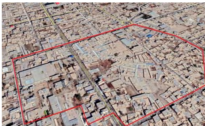
شکل (۴): فضاهای باز و متراکم شهر زابل / بازار مرکزی شهر و مصلى المهدى شهر به عنوان محل اسکان اضطرارى روباز در بافت متراکم مسکونی

سنتی بودن اغلب محلات شهر و مشارکت بالای شهروندان، وجود وجه مذهبی و طایفه ای شهروندان زابل که امکان مقابله با بحران‌های فرهنگی و جنگ رسانه ای - روانی را در مواقع بحران افزایش می دهد، وجود برخی نهادهای اجتماعی- فرهنگی و مذهبی رسمی و غیر رسمی فعال مانند پایگاه های مقاومت بسیج، هیات های مذهبی و... و امکان استفاده از آن ها در امر توسعه فرهنگ پدافند غیرعامل، وجود مساجد و مدارس در سطح محلی به عنوان عامل انتظام بخش فضایی در مواقع بحران، عدم تمرکز برخی کاربری های خدماتی و پراکنش آن ها در چندین نقطه شهر، استقرار بیمارستان امام خمینی شهر و تامین اجتماعی در دو نقطه متفاوت و داخل بافت اصلی مسکونی شهری و تسهیل در امر امداد رسانی، فرسوده بودن سازه های ادارات مختلف که امکان ساخت و مکان یابی آن ها بر اساس اصول پدافند غیرعامل را فراهم می سازد. امکان مدیریت بهینه شبکه های دسترسی و فرهنگ سازی در بخش های مختلف سیستم حمل و نقل شهری در زابل با توجه به مبانی پدافند غیرعامل، امکان احداث سازه های عمران شهری و پرهزینه بودن ساخت آن ها مبتنی بر اصول پدافند غیرعامل در اغلب نقاط شهر به دلیل بالا بودن سطح آب های زیرزمینی، تمرکز جمعیت منطقه سیستان در منطقه شهری زابل که میزان آسیب پذیری را به شدت افزایش می دهد، روندرو به رشد جمعیت شهری و مهاجرت از روستاهای اطراف به شهر که با اصل پراکندگی بهینه در پدافند غیرعامل در تعارض می باشد (تخلیه مرز)، مهاجرت از