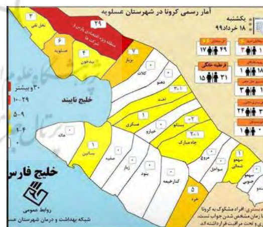
شکل (۵): آمار مبتلایان به کرونا در شهرستان و شهرهای عسلویه در تاریخ ۱۸ خرداد (مجموع شهرستان ۶۶ نفر)

شهرهای هوشمند باید به تحقق شهرهای الکترونیک و موبایل شهرها بر مبنای چشم انداز تحقق شهر هوشمند بر اساس تعطیلی شهر در مواقع بحرانی و رفاه جامعه و همچنین اقدامات سختگیرانه در خدمات شهری در وضعیت عادی و بحرانی می باشد. شهر صنعتی و مهاجر پذیر و همچنین بین راهی عسلویه به عنوان مکانی در معرض خطر بالا دسته بندی می گردد که نقش آن در تولید انرژی کشور حیاتی و حساس می باشد. شهر مرزی زابل که از لحاظ امنیتی دارای ضریب امنیتی بالا می باشد با توجه به عدم ارتباط فراگیری جغرافیایی اما از لحاظ ارتباط اجتماعی به صورت فراگیر در سطح ملی (مهاجرت مشهد / گرگان) و از نظر خدماتی در سطح منطقه ای می باشد.