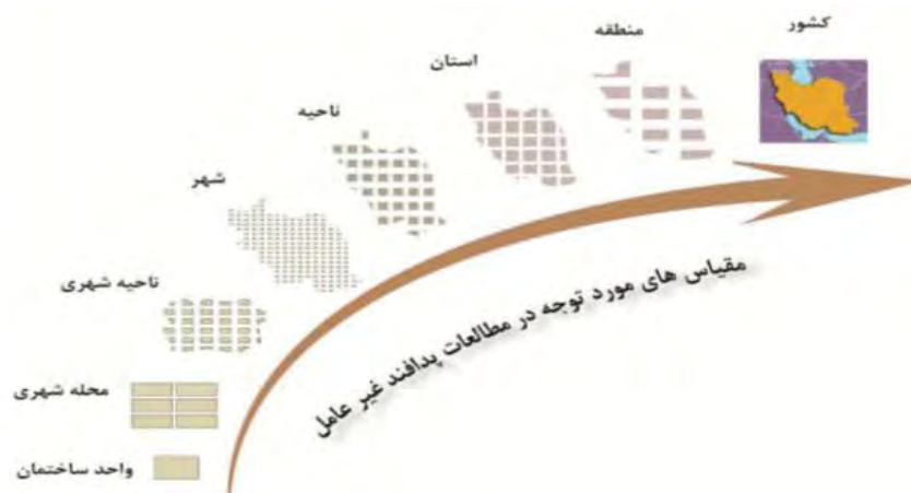
شکل (۲): مقیاس های مواجهه ی پدافند غیرعامل و مدیریت بحران ها

شناسایی اراضی و مکانیابی بیمارستان های صحرایی در برنامه ریزی های پیش از وقوع بحران و آماده