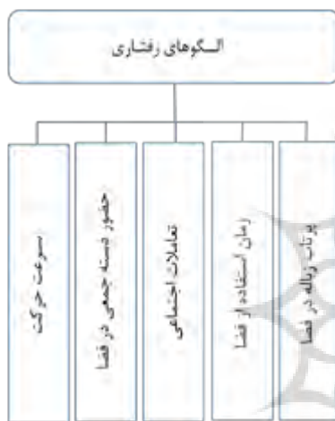
شکل ۴. الگوهای رفتاری مورد بررسی در مقایسه تطبیقی بین دو معبر

هم متفاوت بوده و هر کدام عملکردهای متفاوتی را دارند انتخاب و مورد تحلیل قرار گرفته است. در ذیل مقایسه ای تطبیقی بین رفتارهای ۵ گانه شهروندان و استفاده کنندگان از این فضاها مورد بررسی قرار گرفته است. در شکل ۴ رفتارهای پنج گانه شهروندان مشهد در دو فضای متضاد مورد نظر (دو معبر مورد بحث در این تحقیق) بررسی و مورد تحلیل قرار گرفته است. رفتار استفاده کنندگان از این فضاها در ساعات اوج (۱۲-۱۰ و ۲۰-۱۸) صورت گرفته است.