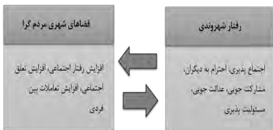
شکل ۳. مدل نظری ارتباط بین مولفه های فضاهای شهری و رفتار شهروندی (نصرآبادی، ۱۳۹۰)

با توجه به دیدگاه ها و تحقیقات انجام شده در زمینه فضاهای شهری و رفتار شهروندی می توان پیش فرض هایی را برای یک مدل ارتباطی که توجیه کننده ارتباط بین فضاهای شهری و رفتارهای شهروندی فراهم نمود (نصرآبادی، ۱۳۹۰).