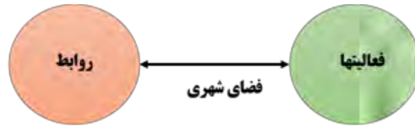
شکل ۲. فضای شهری و ارتباط متقابل میان روابط و فعالیت ها