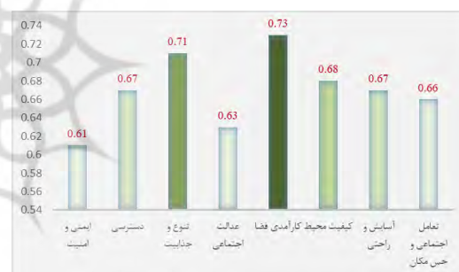
شکل ۳. میزان اهمیت شاخص های سرزندگی برای حضورپذیری زنان در فضاهای شهری آینده