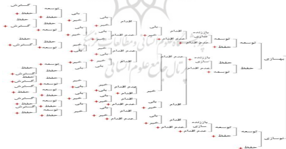
شکل ۴. درخت تصمیم‌گیری

نمود. میله شماره ۶- در صورت نوسازی بافت‌های فرسوده محله نمی‌توان بازوی مدیریت و وجود قوانین و مقررات لازم جهت ساخت و ساز را نادیده انگاشت. میله شماره ۷- در صورت توسعه حمل و نقل عمومی نمی‌توان ضوابط و مقررات لازم را اجرا نمود. میله شماره ۸- در صورت باززنده سازی فضاهای بی دفاع شهری می‌باید شبکه دفع فاضلاب و آب های سطحی نیز اصلاح گردد. میله شماره ۹- در صورت نوسازی بافت فرسوده محله، می باید شبکه دفع فاضلاب و آب های سطحی نیز اصلاح گردد. میله شماره ۱۰- در صورت بهسازی بافت فرسوده محله، می‌باید شبکه دفع فاضلاب و آب های سطحی نیز اصلاح گردد. میله شماره ۱۱- در صورت نوسازی بافت فرسوده محله نمی‌توان قوانین و نظارت بر تراکم را نادیده گرفت. میله شماره ۱۲- باززنده سازی فضاهای بی‌دفاع شهری بدون همکاری شورایاری‌های دارای قدرت ممکن نیست. میله شماره ۱۳- در صورت نوسازی بافت‌های فرسوده محله می باید میزان آموزشهای عمومی و اعمال سیاستهای تشویقی و مشارکتی را در سطح محله افزایش داد. میله شماره ۱۴- در صورت نوسازی می