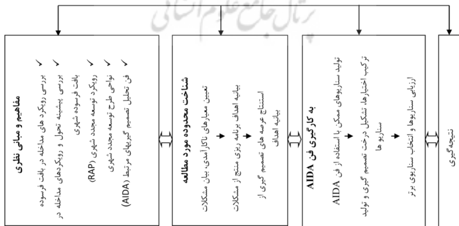
شکل ۲. رویه تحقیق منبع (نگارندگان، ۱۳۹۸)

روش انجام تحقیق مدتا بر مبنای روش توصیفی - تحلیلی است. به این ترتیب که در ابتدا، مبانی نظری در خصوص ویژگی‌های توسعه مجدد نواحی فرسوده شهری شامل بررسی پیشینه مداخله در بافت‌های فرسوده، معرفی و تعریف رویکرد توسعه مجدد شهری (RAP) و توضیح و بررسی نواحی طرح توسعه مجدد شهری، از طریق روش مطالعات کتابخانه‌ای، مرور اسناد داخلی و خارجی و ترجمه متون خارجی، انجام پذیرفته است. سپس با روش میدانی، مصاحبه و توزیع پرسشنامه، به شناخت محدوده مورد مطالعه پرداخته