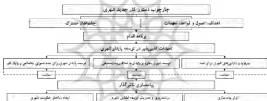
شکل ۳. چهارچوب بیانیه دستور کار جدید شهری

امن، انعطاف پذیر و پایدار کمک می‌کند(دستور کار جدید شهری، ۲۰۱۷). به منظور تحقق دستور کار توجه کشورها به این پنج محور اساسی ضروری است (نشست تخصصی بررسی دستور کار جدید شهری هیئت‌ات III، http://unhabitat.org.ir ): سیاست ملی شهری؛ قانونگذاری شهری و قوانین و مقررات؛ برنامه‌ریزی و طراحی شهری؛ اقتصاد شهری و تأمین مالی شهرداری؛ اجرای کالبدی محلی. دستور کار به طور کلی دارای دو بخش بیانیه کیتو و برنامه اجرایی است که در بخش اول به چشم‌اندازی مشترک به همراه اصول و تعهدات کشورها را ترسیم کرده و در بخش دوم به تبیین تعهدات دگرگون‌ساز، اجرای مؤثر و بازبینی می‌پردازد. این تعهدات شامل مسائلی همچون توسعه پایدار شهری در حوزه اجتماعی و پایان فقر