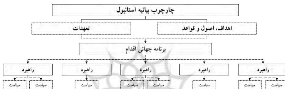
شکل ۲. چهارچوب بیانیه کنفرانس هیئات II منبع (بیانیه استانبول، ۱۹۹۶)

عنوان یک اقدام جهانی در مورد تشخیص سکونتگاه‌های انسانی پایدار مورد پذیرش قرار گرفت. این نشست برخی موارد مطرح شده نشست سازمان ملل در مورد محیط زیست و توسعه (اجلاس زمین) در سال ۱۹۹۲ را مورد استفاده قرار داد و رهبران جهان دستور کار جهانی اقدام برای سرپناه کافی را با مفهوم سکونتگاه‌های پایدار انسانی که به سمت توسعه در جهان رهنمون می‌شد، تقویت کردند. از جمله خروجی‌های اصلی این کنفرانس، معرفی شهرها به عنوان موتورهای رشد جهانی؛ شناخت شهرگرایی به عنوان یک فرصت؛ فراخوانی برای نقش قوی‌تر قدرتهای محلی؛ آشکار شدن قدرت مشارکت می‌باشد (بیانیه اسکان بشر، ۱۹۹۶). چارچوب کلی بیانیه کنفرانس هیئات II را می‌توان در شکل (۲) خلاصه کرد. این بیانیه با ارائه تعهدات، اصول و اهداف آغاز می‌شود و طرح اقدام جهانی را بر پایه این اهداف و تعهدات شکل می‌دهد. به منظور تحقق اهداف، در برنامه اقدام راهبردهایی ارائه می‌شود و به منظور عملیاتی‌تر شدن این راهبردها، سیاست‌هایی در زمینه موضوع راهبرد مطرح می‌شود.