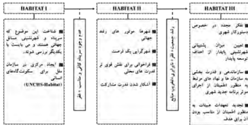
شکل ۴. خروجی های هییتات I، II و III

مساله مسکن، در بعد وسیع‌تر از شهر مورد بررسی قرار گرفته است. در روند حرکت به سمت هییتات III،