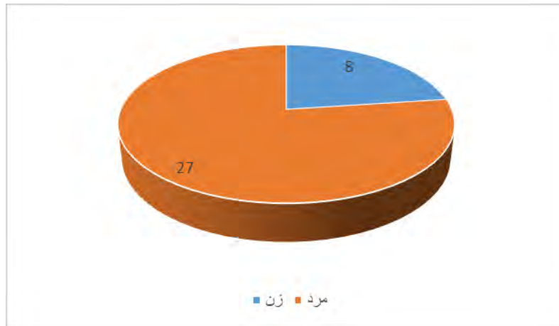
نمودار ۱) وضعیت نمونه آماری تحقیق از لحاظ جنسیت

فصلنامه علمی منابع و سرمایه انسانی دوره ۱، شماره ۱، پاییز ۱۴۰۰