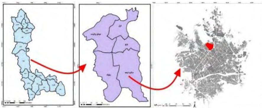
نقشه ۱- موقعیت محله کشتارگاه در ارومیه

روش تحقیق از نظر هدف کاربردی و از نظر ماهیت توصیفی-تحلیلی می‌باشد. در این پژوهش از دو روش جمع‌آوری اطلاعات اسنادی و میدانی استفاده شده است. ابزار گردآوری داده‌ها به چند صورت: مشاهده، پرسشنامه، مصاحبه و فیش‌برداری می‌باشد. جامعه آماری پژوهش مورد نظر ساکنین محله کشتارگاه می‌باشد که طبق سرشماری دفتر تسهیلگری و توسعه محلی محله پشت کشتارگاه در سال ۱۳۹۷ در حدود ۱۱۷۳۱ نفر می‌باشد. حجم نمونه پژوهش با استفاده از فرمول کوکران، ۳۷۲ نفر به دست آمده است. روش نمونه‌گیری به صورت نمونه‌گیری غیراحتمالاتی و در دسترس می‌باشد. تجزیه و تحلیل اطلاعات به صورت کمی و با استفاده روش آماری آزمون t تک نمونه‌ای میزان نشاط در محله مورد ارزیابی قرار گرفته است و در نهایت با استفاده از مدل SWOT و ماتریس QSPM به سیاست‌گذاری ارتقاء نشاط اجتماعی پرداخته شده است. در این راستا نقاط قوت، ضعف،