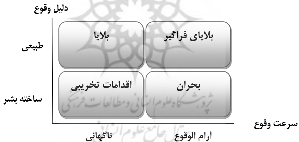
شکل ۱. انواع فجایع

برای برنامه‌ریزی بهتر، لازم است ابتدا به خوبی فجایع و انواع آن را بشناسیم. فجایع را می‌توان براساس دو بعد، ۱. دلیل وقوع و ۲. قابلیت پیش‌بینی و سرعت وقوع، مورد بررسی قرار داد. از منظر دلیل وقوع، فاجعه به دو دسته طبیعی و بشرساخته و از منظر قابلیت پیش‌بینی و سرعت وقوع، به فجایع ناگهانی و آرام‌الوقوع تقسیم می‌شوند. بر این اساس می‌توان فجایع را به صورت زیر به چهار نوع طبقه‌بندی نمود (جعفرنژاد و همکاران، ۱۳۹۴):