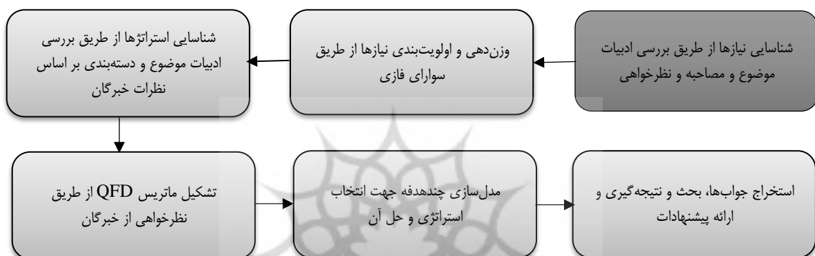
شکل ۲. مراحل انجام پژوهش

پژوهش حاضر که از نظر هدف از جمله پژوهش‌های کاربردی و از نظر شیوه گردآوری داده‌ها از نوع پیمایشی است که در یک دوره یکساله در سال ۱۳۹۸ انجام شده و به دنبال ارائه استراتژی‌های مناسب جهت کمک به امداد رسانی و رفع نیازهای آسیب‌دیدگان به هنگام وقوع زلزله در زنجیره تأمین بشردوستانه با بکارگیری رویکرد QFD می‌باشد. مراحل انجام این پژوهش مطابق با جدول شکل زیر است: