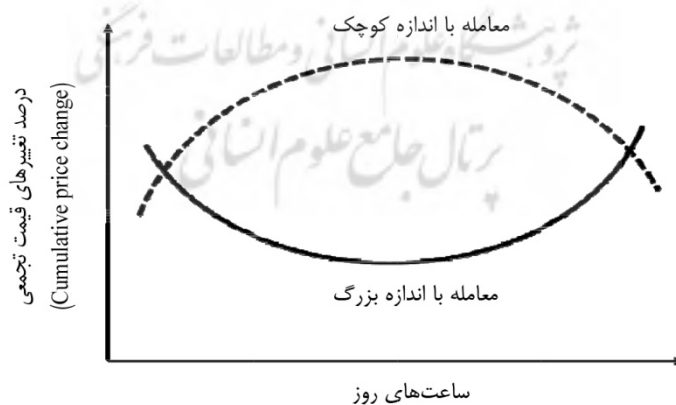
شکل ۱. رفتار درون‌روز معاملات با اطلاعات نهانی

بر اساس فرضیه معامله با اطلاعات نهانی و الگوهای درون‌روزانه مبادله