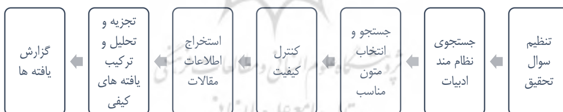
شکل ۱، مراحل هفت‌گانه فراترکیب، (لودویگسن و همکاران، ۲۰۱۶)، اقتباس از (ساندلوفسکی و باروسو، ۲۰۰۶)

در سال‌های اخیر، ترکیب کیفی پژوهش‌ها (QRS) ۱ به رویکردی ارزشمند برای مرور نظام‌مند در حوزه‌هایی نظیر پژوهش‌های اجتماعی تبدیل شده است (لودویگسن، هال، میر، فگرن، آگارد، اوهرنفلد ۲ ، ۲۰۱۶). به طور کلی، «یک فراترکیب کیفی ۳ »، نوعی روش کیفی است که داده‌های ورودی آن نتایج سایر مطالعات در موضوع مرتبط یا مشابه است (زیمر ۴ ، ۲۰۰۶). فراترکیب، روش تحقیق کیفی است که به ارائه ترکیبی تفسیرگونه از یافته‌های پژوهش‌ها می‌پردازد و هدف آن ایجاد چارچوب نظری و خلاصه‌سازی یافته‌ها بمنظور ایجاد دسترسی بیشتر و راحت‌تر به یافته‌های کیفی برای بهره‌برداری در پژوهش‌های تجربی است (ساندلوفسکی، باروسو و ویلس ۵ ، ۲۰۰۷). فراترکیب صرفاً به دنبال مرور ادبیات تحقیق و تجزیه و تحلیل کیفی داده‌ها به صورت یکپارچه و یا تحلیل ثانویه داده‌های اولیه بدست آمده از سایر مطالعات نیست؛ بلکه به دنبال تحلیل یافته‌های آن پژوهش‌هاست (زیمر، ۲۰۰۶). در این تحقیق برای شناسایی مفاهیم ۶ مورد استفاده در تحقیقات گوناگون حاکمیت شرکتی با رویکرد رفتاری، از روش فراترکیب استفاده می‌کنیم. لودویگسن و همکاران (۲۰۱۶) روش هفت مرحله‌ای «سندلوفسکی و باروسو» را که در اغلب پژوهش‌های فراترکیب از آن استفاده شده است، شرح داده‌اند که در شکل ذیل خلاصه شده است: