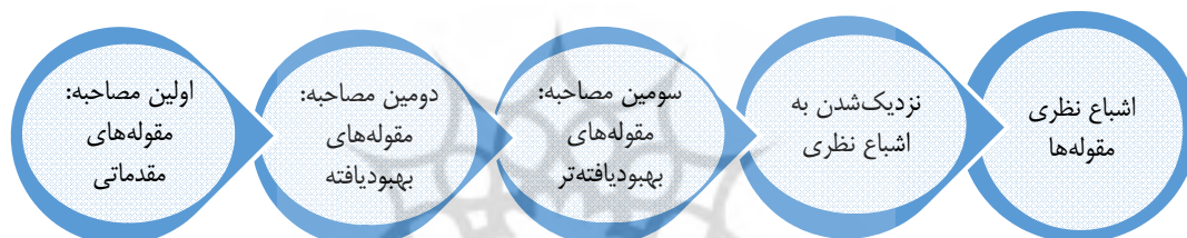
شکل ۲. گردآوری و تحلیل داده‌ها برای اشباع مقوله

الصاق شده را با محتوای داده‌ها، شایسته و معتبر اعلام کردند. در زمینه خروجی‌های هر مطالعه تاریخ شفاهی، بحث سندیت مطرح است؛ به این معنا که باید شرح کامل، درست و متعادلی از روند مصاحبه‌ها و داده‌های تولید شده در تحقیق تاریخ شفاهی ارائه شود. تحقیق مستند، باید روشن و بی‌طرف باشد. جانب‌داری از گروه، دسته، عقیده و مرام خاص، از موضوعاتی است که باعث می‌شود مخاطبان احساس کنند، اعتبار تحقیق از نظر سندی با سوگیری همراه بوده است (توکلی، ۱۳۹۶). در پژوهش حاضر، ارائه شرح کامل، درست و متعادلی از روند مصاحبه‌ها و داده‌های تولیدشده، به صورت روشن و بی‌طرفانه و بدون سوگیری انجام شد و فقط نظرهای مصاحبه‌شوندگان ملاک عمل قرار گرفت. در رویکرد کیفی، اشباع نظری میزان نمونه‌ها را مشخص می‌کند (مؤمنی راد، علی آبادی، فردانش و مزینی، ۱۳۹۲) و دستیابی به اشباع نظری، گواهی بر اعتبار یافته‌های پژوهش است (نیکبخت، رضایی و منتی، ۱۳۹۶). در قالب تفسیری که بر اساس شکل ۲ مشاهده می‌شود، تعداد ۲۱ مصاحبه صورت گرفت و مصاحبه‌ها تا زمانی که پژوهشگر به اشباع نظری (عدم اضافه شدن مفاهیم و مقوله‌های جدید در مصاحبه‌های پایانی) دست پیدا کند، ادامه داشت.