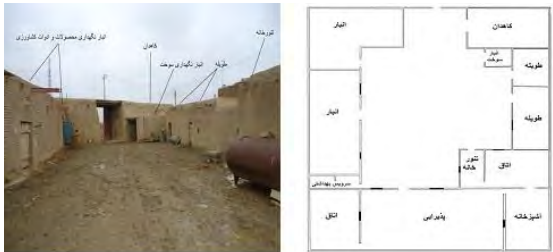
شکل ۴- کارکردهای مختلف مسکن روستایی از بعد اقتصادی

مقاوم سازی مسکن روستایی منجر به تغییرات فراوانی در کاربری فضا در این مسکن شده است. از مهمترین این تغییرات بی توجهی به اختصاص بخشی از مسکن به فعالیت‌های دامی و کشاورزی بوده است. تغییر شیوه معیشت در اینجا به معنای رها کردن کامل کشاورزی و دامداری نیست، یعنی گروهی از این تعداد کشاورزی و دامداری را بصورت توأم با یکدیگر انجام می‌دادند اما پس از مقاوم‌سازی مسکن، به ناچار تنها به یکی از این مشاغل روی آوردند. تعداد دیگر نیز از تعداد دام‌های خود کاسته و یا تنها به نگهداری دام‌های بزرگ اکتفا نموده‌اند، در ارتباط با فعالیت‌های زراعی نیز بیشتر به کشت محصولاتی روی آورده شده که نیاز به انبار نداشته و محصول در همان محل کشت، مستقیم به فروش می‌رسد. به عنوان نمونه یونجه و شبدر از جمله محصولاتی است که فروش آن نیاز به زمان و نگهداری در انبار دارد اما در مقابل گندم و جو بلافاصله پس از برداشت به فروش می‌رسد، لذا بیشتر به کشت این محصول روی آورده شده است. از نظر روستاییان مسکن سنتی بیشتر به عنوان محلی برای زندگی و فعالیت اقتصادی در نظر گرفته می‌شود، اما مسکن نوساز علاوه بر آن به عنوان یک سرمایه اقتصادی می‌باشد. به عبارت دیگر مسکن علاوه بر تأمین یکی از نیازهای زندگی یعنی سرپناه، به عنوان یک پس انداز مطرح شده است. در مسکن سنتی تنها در موارد اضطرار، ساکنان برای تعمیر و نگهداری مسکن خود هزینه می‌کنند و از لحاظ اقتصادی صرف وقت و هزینه را برای مسکن خود مقرون به صرفه نمی‌دانند، اما به واسطه تغییر نگرش آنان به مسکن و تبدیل آن به کالایی سرمایه‌ای، در مسکن جدید از این حیث تغییرات فراوانی بوجود آمده و صرف هزینه برای مسکن توجیه اقتصادی پیدا کرده است.