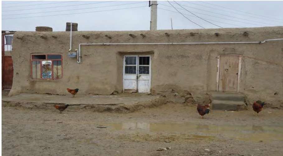
شکل ۲- تصویر نمونه‌ای از مسکن قدیمی در دهستان شوردشت