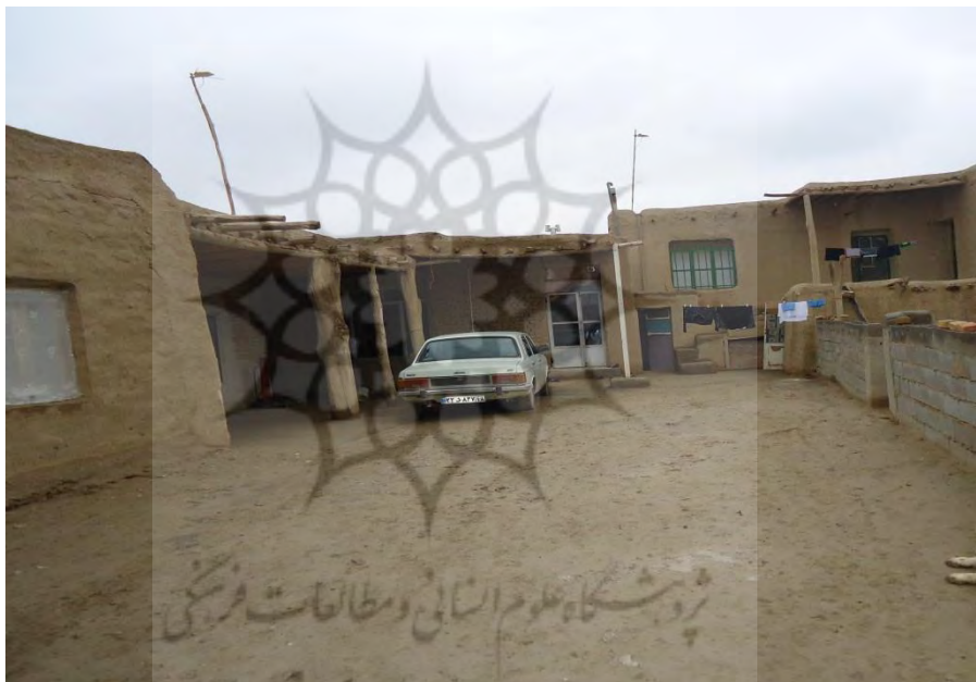
شکل ۳- تصویر نمونه‌ای از مسکن قدیمی در دهستان شوردشت

در ابعاد کالبدی کمترین میزان میانگین در شاخص‌های سیستم گرمایش و سیستم سرمایش مشاهده می‌شود. به دلیل ویژگی‌های اقلیمی منطقه، در مسکن سنتی تمهیدات خاصی برای حفاظت ساکنین از سرما و تأمین گرمایش مسکن اندیشیده شده است. معمولاً دیوارها بصورت ضخیم بوده و حداقل امکان بازشوها و درها کوچک و عمدتاً از جنس چوب می‌باشد. همچنین مسکن در خلاف جهت وزش بادهای زمستانی و در جهت تابش خورشید احداث می‌شود. بافت مسکن متراکم و احداث دالان در ورودی مسکن از دیگر تمهیدات اندیشیده شده برای حفظ تعادل دمای مسکن است و این در حالیست که در مسکن نوسازی شده این موارد عمدتاً به فراموشی سپرده شده است. در مسکن جدید ابعاد بازشوها بزرگتر و تعداد آن نسبت به مسکن سنتی بیشتر است، همچنین بازشوهای فلزی در مقایسه با چوبی بیشتر مورد استفاده می‌باشد. دیوارها نسبت به مسکن سنتی از ضخامت کمتری برخوردار بوده و جنس مصالح بکار رفته در ساخت مسکن نیز در ارتباط