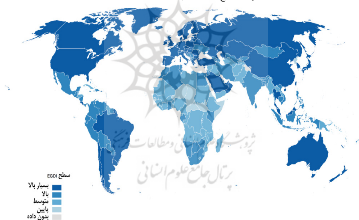
شکل ۱- توزیع جغرافیایی چهارگروه EGDI در سال ۲۰۲۰

عمومی جامعه خود شتاب داده‌اند. براساس گزارش ۲۰۲۰ سازمان ملل، روند توسعه دولت الکترونیک براساس ارزیابی مقادیر منعکس شده در EGDI ارایه شده است. EGDI شاخص مرکبی است که از سه شاخص خدمات آنلاین محلی ۱ (OSI)، شاخص زیرساخت ارتباطات از راه دور ۲ (TII) و شاخص ظرفیت انسانی ۳ (HCI) ترکیب شده است. گزارش ۲۰۲۰ سازمان ملل نشان‌دهنده بهبود بیشتر روند جهانی توسعه دولت الکترونیک و انتقال