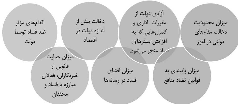
شکل ۱- موارد مدنظر بنیاد خانه آزادی برای تخمین میزان فساد در بین دولتمردان