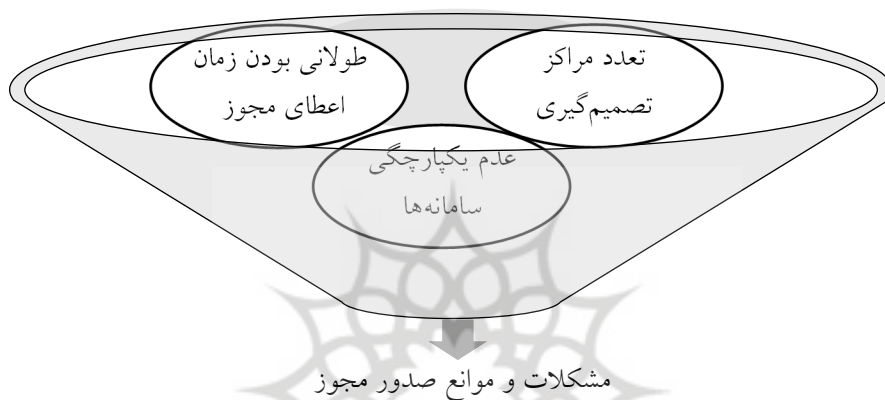
شکل ۱- مشکلات موجود در نظام اعطای مجوز سامانه‌ها

کشاورزی، وزارت صنعت، معدن و تجارت، وزارت تعاون، کار و رفاه اجتماعی، اتاق بازرگانی، صنایع، معادن و کشاورزی، اداره دارایی، سازمان ملی استاندارد، دفتر ثبت اسناد رسمی، سازمان ثبت اسناد و شرکت، شهرداری، سازمان حفاظت محیط زیست، استانداری و برخی دیگر از نهادها که به تناسب فعالیت به این فهرست اضافه می‌شوند. به عبارت دیگر، می‌توان گفت، این فهرست دریافت مجوز نیست، بلکه اینها موانع دریافت مجوز برای انجام فعالیت تولیدی در ایران هستند.