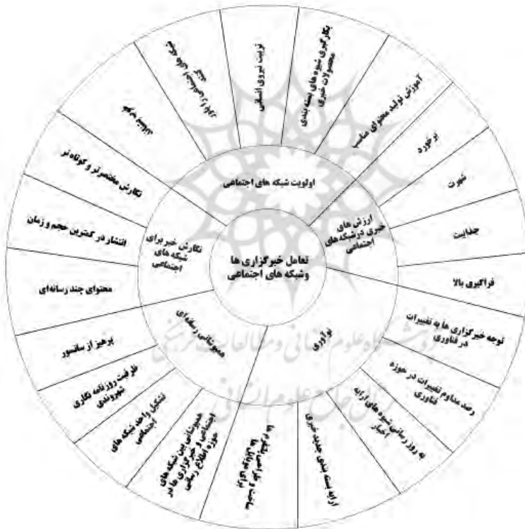
نمودار ۱. پنج عامل مهم در همگرایی رسانه‌ای

اجتماعی در چهار حوزه اولویت شبکه‌های اجتماعی، هم‌پوشانی رسانه‌ای، ارزش‌های خبری در شبکه‌های اجتماعی و نگارش خبر برای شبکه‌های اجتماعی تبیین شده است. در دایره اول، زیرمجموعه‌های الزامات همگرایی رسانه (شامل اولویت شبکه‌های اجتماعی، نگارش خبر برای شبکه‌های اجتماعی، ارزش‌های خبری در شبکه‌های اجتماعی، هم‌پوشانی رسانه‌ای و نوآوری) و در دایره دوم الزامات آن‌ها مشخص شده‌اند؛ مثلاً برای الزامات ارزش‌های خبری رعایت برخورد، شهرت، جذابیت و فراگیری زیاد الزامی است. نتایج پژوهش با نظر دال زتو و لوگمایر همسوست. به باور آنان، همگرایی باعث کاهش هزینه‌های عملیاتی شده است که این امر بر کیفیت محصولات رسانه‌ای تأثیر منفی داشته است. اما صرف نظر از چنین انتقادهایی، همگرایی رسانه‌ای واقعیتی انکارناپذیر در تحولات رسانه‌ای دوران معاصر است.