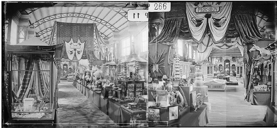
شکل (۲). دو نما از غرفه‌ی ایران در نمایشگاه ۱۸۷۳ وین (Fulco, 2017. p. 53)

قابلیت این را داشت که با سازوکارهای نمایشی و روح حاکم بر فضا جزیی از نمایشگاه شود» (دل‌زنده، ۱۳۹۴، ۱۵۵). برپایی این نمایشگاه به امپراتوری اتریش کمک کرد تا روابط دیپلماتیک و اقتصادی گسترده‌ای را با کشورهای اسلامی شکل دهد و از طرفی این فرصت را برای کشورهای اسلامی از جمله ایران فراهم ساخت تا هنر، فرهنگ و معماری خود را به مردم اروپای مرکزی و اتریش معرفی کنند.