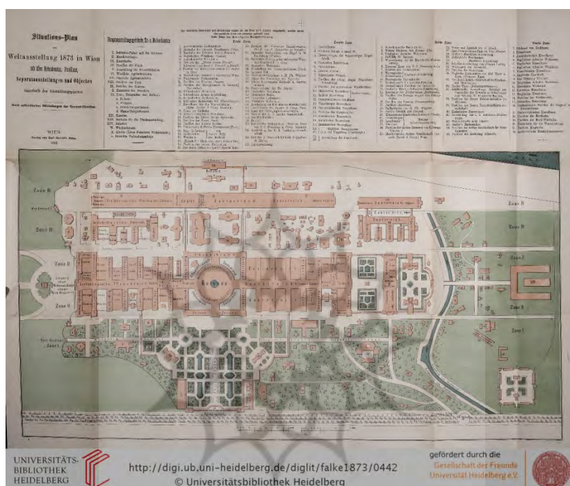
شکل (۱). نقشه‌ی کلی و پلان غرفه‌بندی نمایشگاه جهانی ۱۸۷۳ وین (Falke, 1873. p. 442)

چندین کشور شرقی از جمله ایران به‌طور ویژه‌ای دعوت شدند تا در این رویداد مشارکت داشته باشند. در آن میان، غرفه‌ی ایران که در آن آثار به نمایش درآمده به‌صورت فشرده و کنار هم بر روی میزهایی چیده شده بودند (شکل ۲)، به‌سبب حضور باشکوه ناصرالدین شاه در مرکز توجهات قرار گرفت (Fulco, 2017. p. 53) (شکل ۳). حضور ناصرالدین شاه به‌عنوان یک پادشاه واقعی شرقی در نمایشگاه و در جمع بازدیدکنندگان، فضای گرایش به شرق در میان اهالی شهر و نیز بازدیدکنندگان را تشدید کرد. به‌ویژه اینکه «روح بازنمایانه‌ی حاکم بر فضای نمایشگاه هر چیزی به جز تماشاگر غربی را تبدیل به شیء می‌کرد. حتی زمانی که شاه واقعی یکی از سرزمین‌های شرقی به نمایشگاه درمی‌آمد