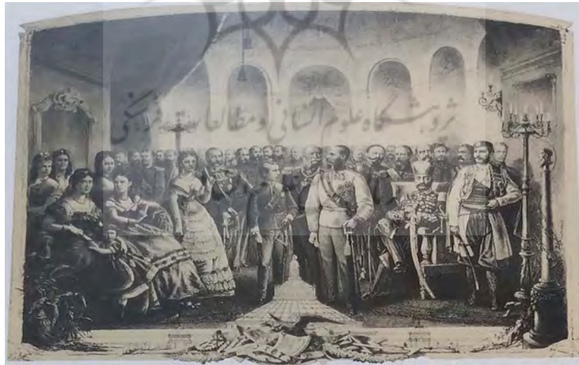
شکل (۳). ناصرالدین‌شاه نشسته بر تخت، در بین بازدیدکنندگان نمایشگاه جهانی ۱۸۷۳ وین