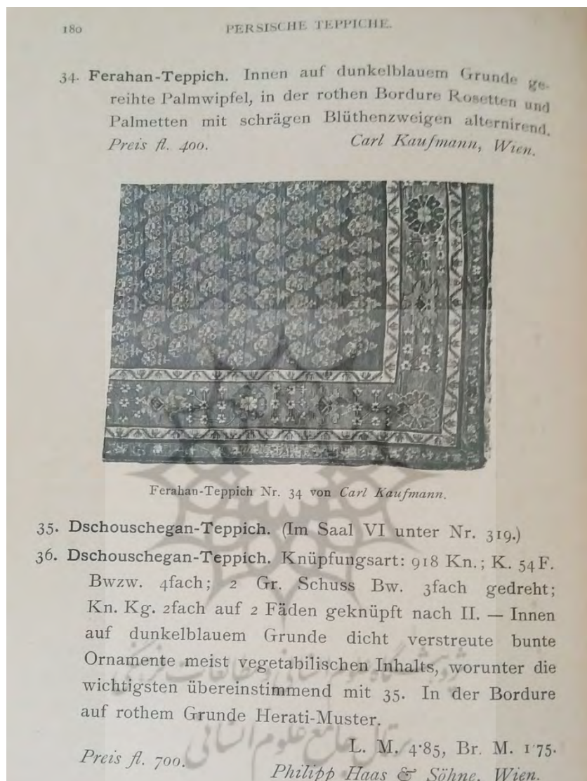
شکل (۶). برگی از دفترچه‌ی راهنمای نمایشگاه با معرفی و تصویر قالی فراهان

اطلاعات ثبت‌شده‌ی قالی‌ها نشان می‌دهد عمده‌ی این قالی‌ها با رایزنی‌های تجاری و دیپلماتیک موزه‌ی تجارت از سرتاسر جهان و توسط مجموعه‌داران خصوصی و برخی بنگاه‌های تجاری مستقر در اتریش از جمله شرکت معروف «فیلیپ هاس و پسران» ۱