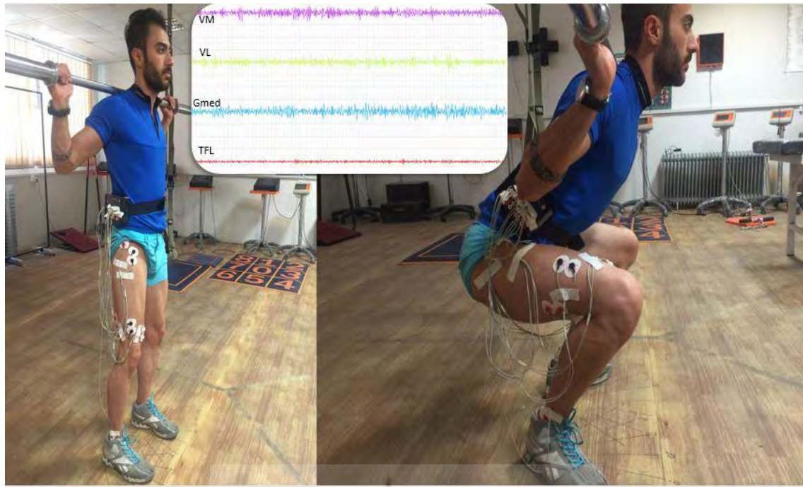
شکل ۲. انجام حرکت اسکات با زوایای مختلف مفصل هیپ

داده‌های حاصل از ثبت فعالیت الکترومایوگرافی عضلات به مدت هشت ثانیه بدون تفکیک فاز کانستریک و اکستریک حرکت اسکات با فرکانس نمونه‌برداری ۱۰۰۰ هرتز و با پهنای باند ۱۰ تا ۴۵۰ Hz (فیلتر band-pass filtered) شد و با استفاده از شیوه ریشه میانگین مجذور (RMS) با پنجره‌ی زمانی صد میلی‌ثانیه محاسبه گردید. به منظور نرمالیز کردن داده‌ها، برای هر آزمودنی داده‌های پردازش شده RMS برای هر عضله به مقدار RMS به دست آمده از حداکثر فعالیت عضله (MVIC) تقسیم گردید و سپس برای ایجاد درصدی از مقدار حداکثر فعالیت عضله، عدد حاصل در عدد ۱۰۰ ضرب گردید؛ بنابراین میزان فعالیت هر عضله بر اساس درصدی از حداکثر مقدار فعالیت عضله در هر مرحله بیان شد. همچنین برای محاسبه نسبت فعالیت Gmed/TFL ، RMS عضله Gmed به RMS عضله TFL تقسیم شد و برای محاسبه نسبت فعالیت VM/VL ، RMS عضله VM به RMS عضله VL تقسیم شد. برای تحلیل سیگنال‌های خام از نرم‌افزار LabVIEW ۱ و برای تحلیل آماری داده‌ها از آزمون فریدمن و ویلکاکسون استفاده شد.