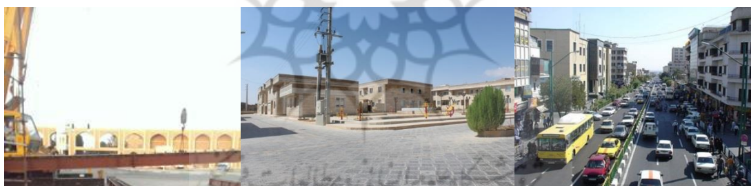
شکل ۶- طرح شهری خیابان کارگر جنوبی (راست)، طرح کف‌سازی و بدنه‌سازی محور کلوان نائین (وسط)، بدنه‌سازی میدان شاه طهماسب یزد (چپ)

از دلایل عمده آشفتگی و بی‌نظمی کالبدی در شهرها، بی‌توجهی معماران به محیط، در مقیاسی کلان‌تر از طراحی یک ساختمان واحد است. تک‌تک بناها و فضاها به عنوان اجزای یک شهر باید در پیوند با یکدیگر دیده شوند. طرح‌های نماسازی به عنوان راهکاری برای افزایش کیفیت بصری شهرها امروزه مورد توجه طراحان شهری قرار گرفته است. یکی از این طراحی‌ها را می‌توان در پروژه‌ی طراحی شهری بخشی از خیابان کارگر جنوبی تهران دید که با هدف سامان‌دهی یا نظم‌دهی بدنه خیابان صورت گرفته است. از دیگر طرح‌های نماسازی انجام گرفته را می‌توان در پروژه‌ی کف‌سازی و بدنه‌سازی محور کلوان نائین یافت که در بافت فرسوده نائین صورت گرفته و سعی شده در تطابق با معماری سنتی بافت، انجام گیرد. یکی دیگر از این گونه طرح‌ها که در میدان شاه طهماسب یزد صورت گرفته است، بدنه‌سازی میدان شاه طهماسب (بعثت) و ورودی خیابان سید گلسترخ است که با در اولویت قرار دادن حفاظت و مرمت میراث فرهنگی، انجام گرفته است.