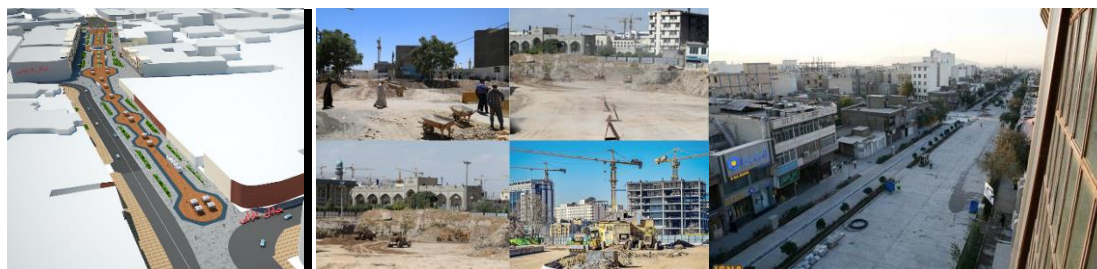
شکل ۲- پیاده‌راه ۱۷ شهریور تهران (راست)؛ طرح پیاده راه جمهوری تبریز (وسط)؛ ره باغ‌های مشهد (چپ)

سنگفرش دانسته و با هدف برداشتن ترافیک و سنگفرش نمودن مسیر یا مسیرهایی از شهر به عمل مبادرت نموده‌اند. از جمله پیاده‌راه‌ها می‌توان به پیاده‌راه ۱۵ خرداد تهران و تربیت تبریز نام برد. همچنین پیاده راه ۱۷ شهریور تهران که با تعارضات مدنی متعددی از سوی کسبه در عدم تغییر کاربری نمایشگاه‌های ماشین موانعی در موفقیت ایران پروژه ایجاد نموده‌اند. همچنین پیاده‌راه خیابان جمهوری تبریز برای مسیر مقابل بازار تاریخی تبریز تهیه شده بود با مخالفت گروه‌های قابل توجهی از کسبه متوقف گردید. یکی دیگر از طرح‌های پیاده‌راهی، طرح ره‌باغ‌های مشهد به سوی حرم مطهر امام رضا (ع) است که اغلب با مداخلات بسیار و ایجاد ترازهای زیرسطحی و تملک اجباری املاک مردمی معارضان مدنی بسیاری را بدنبال داشته است.