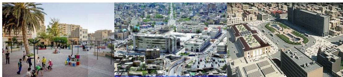
شکل ۴- طرح احیای میدان‌های تهران؛ میدان امام خمینی (ره) (توپخانه) تهران (راست)، میدان شهدا مشهد (وسط)، فضای باز محله‌ای شیرین دخت (چپ)

یکی از مهم‌ترین فضاهای شهری به عنوان محل زندگی جمعی شهروندان، میدان‌های شهری هستند که همواره با هدف ارتقاء کیفیت، دستخوش مداخلات گوناگون قرار گرفته اند. برخی از پروژه‌ها به خوبی اجرا شده و موجب افزایش کیفیت محیط شده اند و برخی دیگر با موانعی رو به رو شده و وضعیت موجود آن را نیز دچار مسائل مختلف نموده‌است. میدان توپخانه یکی از میدان‌های مهم تهران در زمان سلطنت ناصرالدین شاه قاجار شکل گرفته و نخستین میدان تهران است که ویژگی فضاهای شهر مدرن در آن پدیدار شده است [۱۹]. هم‌اینک گودبرداری محل ساختمان بلدیة در این میدان، نیازمند توجه و اقدام سریع تری است تا با تکمیل طرح، کیفیت این محدوده بهبود یابد. از دیگر میدان‌های شهری، میدان شهدا شهر مشهد می‌باشد که در مرحله‌ی تملک و تخریب نیز با تعارضاتی مواجه گردید و آنچه امروز شواهد نشان می‌دهد این است که آن گونه که انتظار می‌رفت مورد مقبولیت و استفاده شهروندان واقع نگردیده است. فضای باز محله ای شیرین دخت از جمله پروژه‌های فضای شهری است که با هدف بهبود کیفیت عرصه عمومی در مقیاس محلی در شهر تهران طراحی و اجرا شده است.