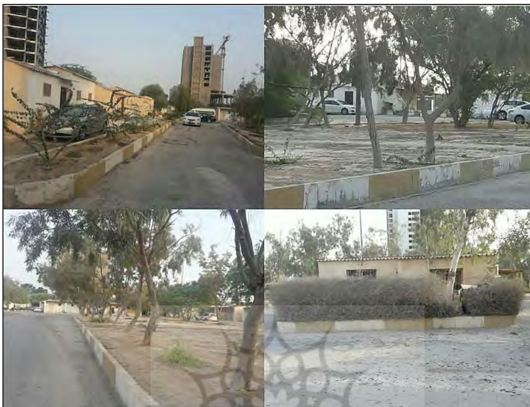
شکل ۴. تصاویر وضعیت زیست‌پذیری کمپ‌های اقامتی