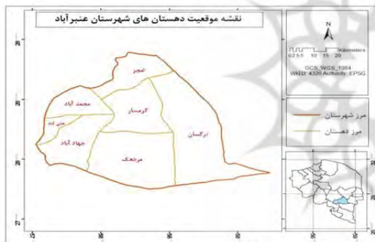
شکل ۱. نقشه موقعیت دهستان‌های شهرستان عنبرآباد در استان کرمان

شهرستان عنبرآباد با ۴۸۵۶ کیلومتر مربع در جنوب شرق استان کرمان قرار دارد. این شهرستان در سال ۱۳۸۲ پس از جدا شدن دهستان‌های اسماعیلی، گنج‌آباد و حسین‌آباد، با ۱۰ دهستان از شهرستان جیرفت جدا و تبدیل به شهرستان جدیدی به مرکزیت عنبرآباد شده است، در حال حاضر این شهرستان دارای سه شهر به نام عنبرآباد، دوساری و مردهک و دو بخش و هفت دهستان می‌باشد. بر اساس جمعیت سرشماری نفوس و مسکن سال ۱۳۹۰، شهرستان عنبرآباد دارای ۸۶۰۰۰ نفر جمعیت بود که از این تعداد ۳۷/۵ درصد آنان شهرنشین و ۶۲/۵ درصد آنان روستانشین می‌باشند. برابر با جمعیت سال ۱۳۹۰ شهرستان عنبرآباد، ۴/۵۵ درصد جمعیت استان در این شهرستان ساکن بوده‌اند. (خلاصه طرح تفصیلی شهرستان عنبرآباد، ۱۳۹۱: ۱ و فرمانداری شهرستان عنبرآباد ۱۳۹۴). و تعداد ۹۲ روستا در حال حاضر دارای دهیاری می‌باشند. (بخشدارای شهر عنبرآباد، ۱۳۹۵).