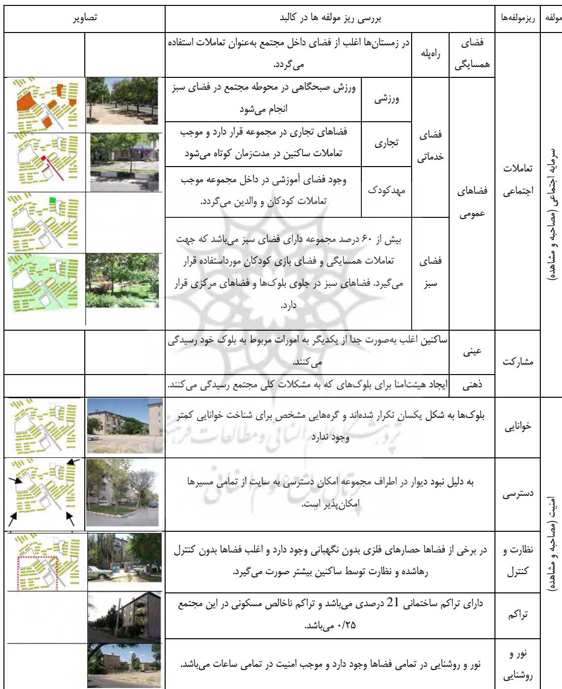
جدول ۶. بررسی مولفه‌های اجتماعی در مجتمع چمران

بلوک‌هایشان جهت تعاملات همسایگی استفاده می‌کنند. نگرهبانی برگزار می‌شود و ساکنین کمتری در آن حضور تعاملات همسایگی اغلب در تابستان در محوطه و در زمستان در راه پله و راه روها صورت می‌گیرد. فضای مدیریتی در طراحی مجتمع در نظر گرفته نشده و جلسات مشارکت در محوطه حضور دارند، صورت می‌گیرد. مجتمع دیگر کمتر می‌باشد و نظارت توسط ساکنین که اغلب می‌یابند. امنیت به دلیل وسعت مقیاس سایت نسبت به دو