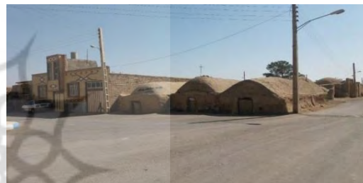
شکل ۲: نمایی از دو واحد مسکونی همجوار (استحکام خانه‌های زمان حاضر و مصالح مقاوم)

«... بنیاد مسکن وام ساخت می‌دهد بر مرحله به مرحله ساخت خانه طبق قانون و مقررات نظارت می‌کند...»