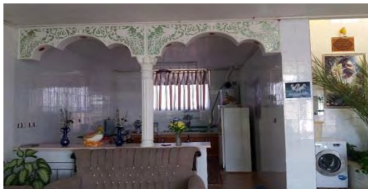
شکل ۱: نمای از فضای درونی یک خانه روستایی (آشپزخانه این و مبل)

نزدیک‌تر باشد به همان میزان نیز نفوذ عناصر و فرهنگ شهر در روستا نیز بیشتر می‌شود.