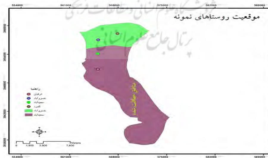
شکل ۱. نقشه موقعیت محدوده مورد مطالعه