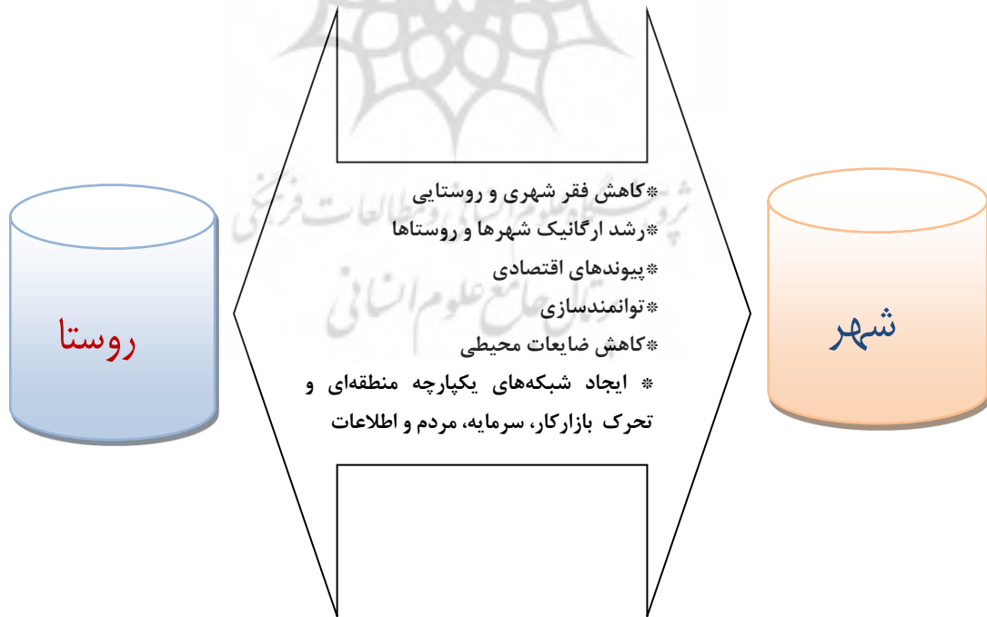
شکل ۲. ضرورت‌های مطالعه روابط متقابل شهر و روستا