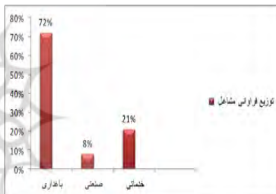
شکل ۳. توزیع فراوانی مشاغل روستاهای نمونه

با توجه به یافته‌های تحقیق، از مجموع پاسخگویان، حدود ۷۲ درصد در بخش باغداری، ۸ درصد در بخش صنعت و ۲۱ درصد در بخش خدمات مشغول به کارند. از کل ۷۲ درصد افراد شاغل در امر باغداری (۱۷۱ نفر باغدار)، حدود ۲۷ درصد از آنان علاوه بر باغداری در سایر بخش‌های اقتصادی نیز مشغول به کار هستند. بدین معنی که هم به عنوان باغدار فعالیت دارند و هم در سایر بخش‌های اقتصادی مانند اداری، نظامی، تجاری، خدماتی و غیره فعالیت می‌کنند.