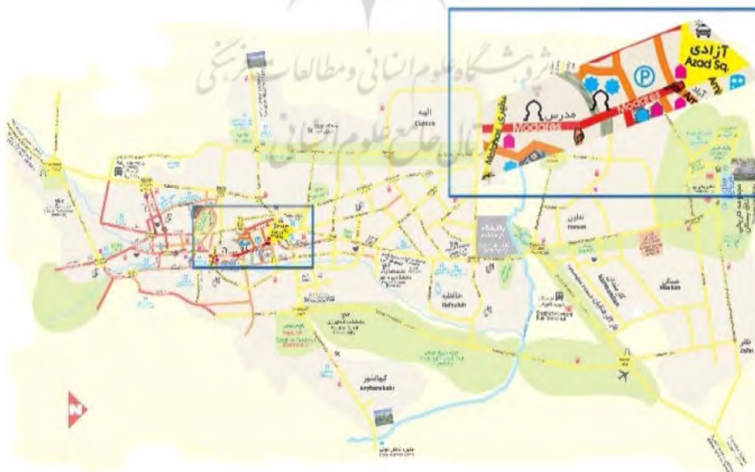
شکل ۳: جایگاه خیابان مدرس در شهر کرمانشاه