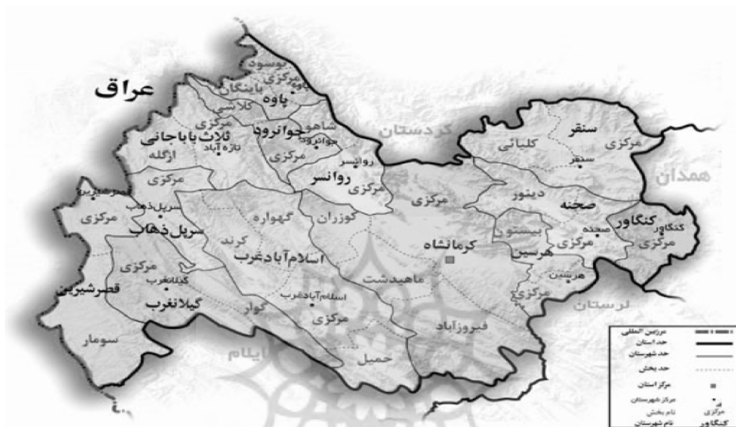
شکل ۲: محدوده نقشه سیاسی - اداری استان کرمانشاه