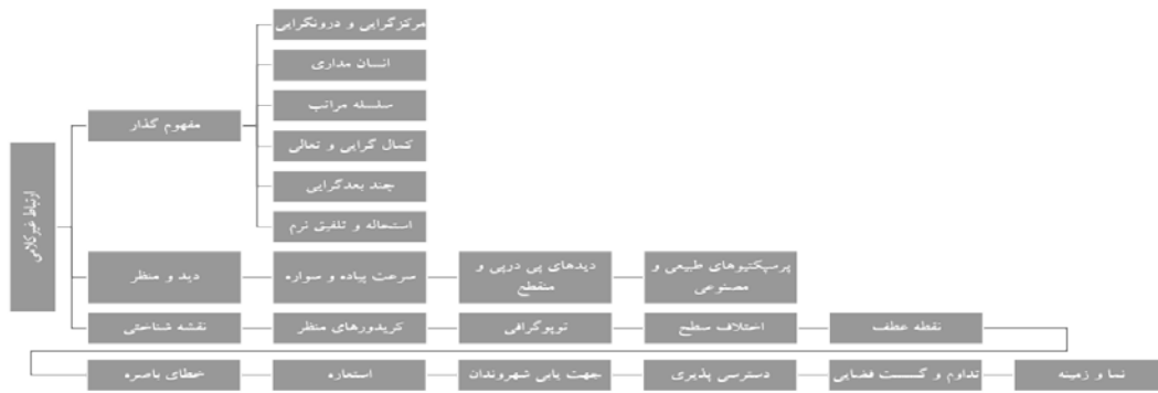
شکل ۱: عوامل مؤثر در ایجاد ارتباط غیرکلامی در فضای شهری

خیابان به مرکز اقتصادی شهر تبدیل شد. جذابیت مغازه‌های تجاری ساخته شده در بدنه خیابان مدرس سبب رونق این مغازه‌ها و کم رونق شدن واحدهای بازار گردید و بسیاری از بازاریان صاحب نفوذ به سمت واحدهای تجاری بر خیابان مدرس کشیده شدند. از مهم‌ترین بافت‌های تاریخی و دیدنی این منطقه میتوان به مسجد جامع، کلیسای قلب مسیح مقدس، مسجد و حمام حاج شهبازخان، تکیه و حمام بیگلربیگی اشاره کرد. شکل ۲، نقشه استان کرمانشاه و شکل ۳، جایگاه منطقه مورد نظر (خیابان مدرس) را در شهر کرمانشاه نشان می‌دهد (سرخابی، ۱۳۸۸: ۲۸۳).