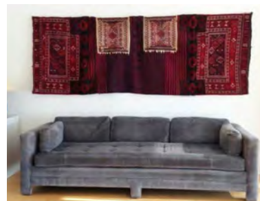
تصویر ۳: کاربرد تاچه به‌عنوان دیوارکوب (نگارندگان: ۱۳۹۹)