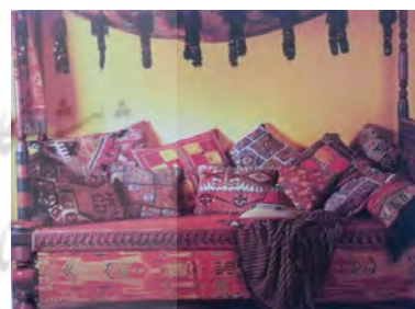
تصویر ۲: کاربرد دست‌بافته‌ها به‌عنوان کوسن (هیلیارد، ۱۳۹۳: ۸۳)