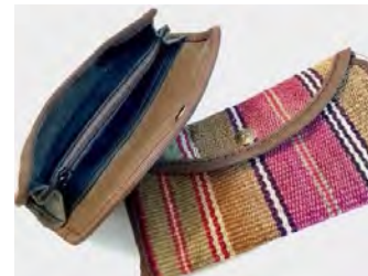
تصاویر ۱۲، ۱۳ و ۱۴: کاربرد بافته‌ها در تولید محصولات کاربردی جدید (سایت ۷)