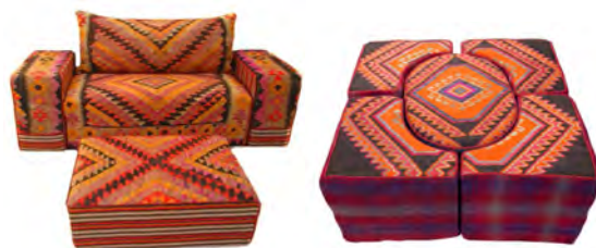
تصاویر ۷ و ۸: کاربرد جاجیم و گلیم در تولید میز و صندلی (سایت‌های ۲ و ۳)