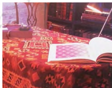
تصویر ۱: کاربرد گلیم و سفره به عنوان رومیزی (هیلبارد، ۱۳۹۳: ۸۲)

دست بافته های عشایر بختیاری در صورتی که در حوزه مصرف عمومی امروزی قرار بگیرند، به واسطه ی خلاقیت افراد در هنگام مصرف و تولید، در کنار معنای اولیه خود، نوعی کاربرد و معنای جدید به دست می آورند که به خوبی می تواند نشانگر خلاقیت تولیدکننده، مصرف کننده، انعطاف پذیری عرصه مصرف، کاربرد و اهمیت مصرف کننده در این یافته ها باشد.