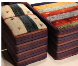
تصاویر ۴، ۵ و ۶: کاربرد گلیم و گبه در تولید محصولات کاربردی جدید (سایت ۱)