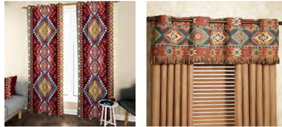
تصاویر ۲۳ و ۲۴: کاربرد نقش بافته‌ها در تولید محصولات کاربردی جدید (سایت‌های ۱۳ و ۱۴)