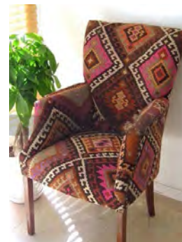
تصاویر ۹، ۱۰ و ۱۱: کاربرد گلیم در تولید مبلمان (سایت‌های ۵۴، ۶ و ۷)