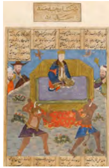
تصویر ۱۲: حمل دیوان تخت روان جمشید را، شاهنامه، هنرمند نامعلوم، شیراز، ۸۸۴ هـ.ق، کتابخانه ملی پاریس (آژند، ۱۳۸۷: ۲۷۱)