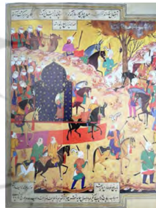
تصویر ۷: استقبال تیمور از همسر امیرزاده جهانگیر، منسوب به کمال‌الدین بهزاد، ظفرنامه تیموری (شماره ۷۰۸)، ۹۳۵ هـ.ق، کاخ گلستان (همان: ۸۶)

نگاره "کیکاووس در آسمان" مکتب تبریز (؟) دوره صفوی به پادشاه کیانی به نام کیکاووس مربوط می‌شود که توسط ابلیس گمراه و مطیع او شده‌است؛ چنانکه پادشاه در تلاشی برای مغلوب ساختن آسمان‌ها، توسط شیطان اقدام به ساخت تختی پرنده نمود که توسط چهار عقاب قوی حمل می‌شد. بر این اساس پرندگان طی پرواز به سمت گوشت آویخته در بالای سر خود، تاج و تخت را به سمت بالا می‌برند. هنگامی که پرندگان خسته شدند به همراه تاج و تخت به زمین فرو افتاده و کیکاووس، خسته و پشیمان، به خاطر غرور خود از خداوند منان طلب آمرزش می‌نماید (تصویر ۹).