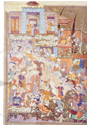
تصویر ۱۱: یوسف در بازار، یوسف و زلیخا جامی، هنرمند نامعلوم، مشهد، سده ۱۰ هـ.ق، موزه بریتانیا، لندن (گری، ۱۳۸۳: ۲۲۰)