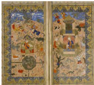
تصویر ۱۳: سلیمان و بلقیس، خمسه نظامی، هنرمند نامعلوم، ۹۳۵ هـ.ق، کتابخانه چستربیتی، دوبلین، ایرلند جنوبی (لوکونین و ایوانف، ۱۳۹۱: ۳۴)