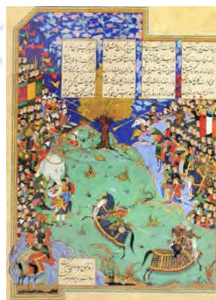
تصویر ۳: جنگ رستم با کاموس، شاهنامه شاه طهماسبی، منسوب به عبدالوهاب، سده ۱۰ هـ.ق، موزه هنرهای معاصر تهران (کرباسی و دیگران، ۱۳۸۹: ۲۸۷).

"گو" در شاهنامه نام پسر جمهور شاه هند است. گو چون به سن جوانی رسید، خود را شایسته پادشاهی دانست و به همین سبب میان او و برادرش تلخند اختلاف و جنگ درگرفت. گو خواهان آشتی با برادرش بود؛ اما وی نپذیرفت و به جنگ ادامه داد تا در میانه نبرد بر پشت فیل جان سپرد. گو نگران بود که چگونه این خبر را با مادرشان بازگوید. سرانجام چاره‌ای اندیشید و بزرگان قوم خویش را بر آن داشت تا صحنه کارزار او و برادرش را بر تخته شطرنج بیارایند و این صحنه را به مادر نشان دهند تا او از چگونگی مرگ تلخند آگاه شود. مادر بدین وسیله دانست که فرزندش تلخند بر پشت فیل و بدون هیچ زخمی بر بدنش در گذشته‌است. نگاره جنگ بین "گو و تلخند" مربوط به مکتب هرات دوره تیموری، نمایانگر این واقعه است (تصویر ۵).