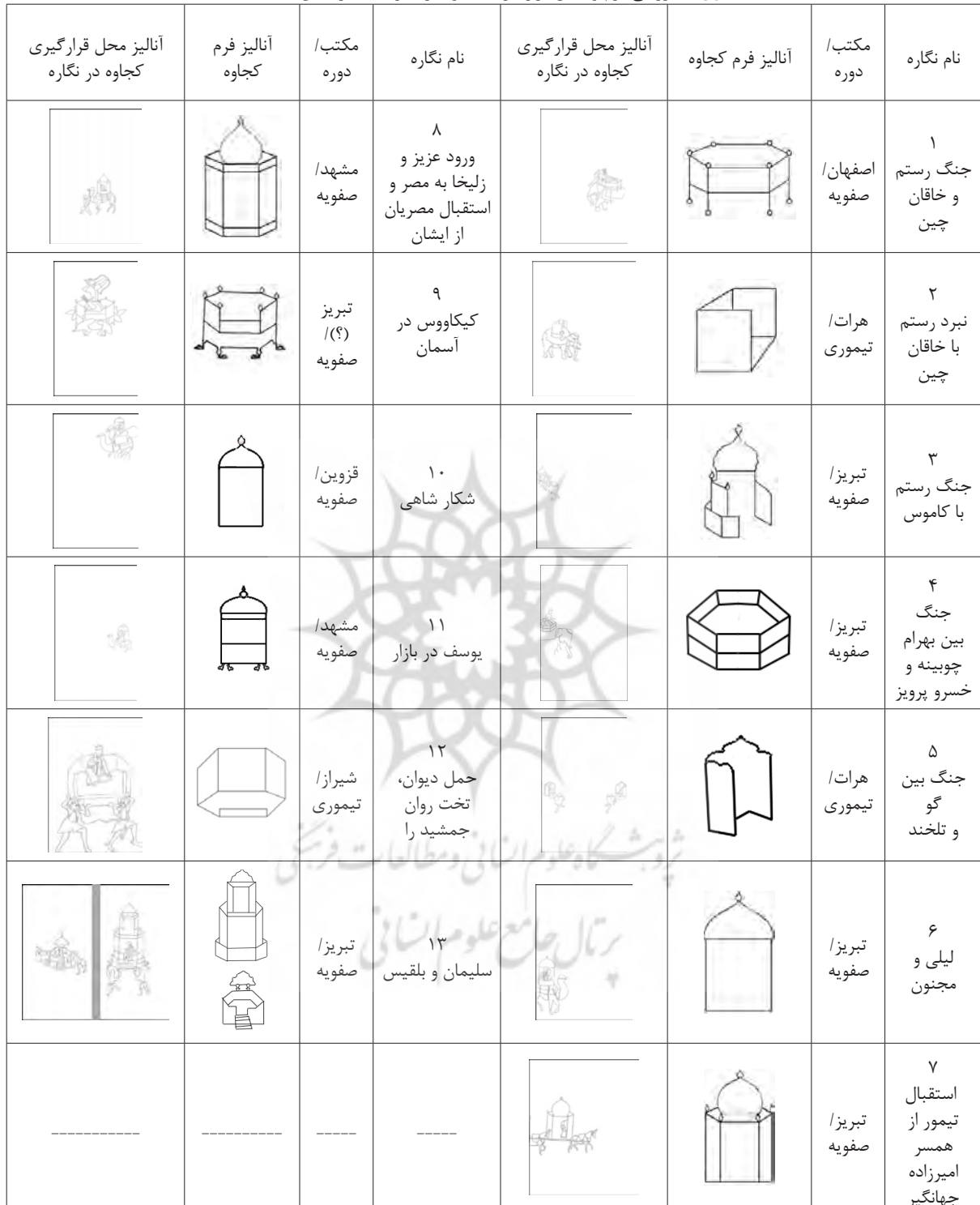
جدول ۴: بررسی فرم و محل قرارگیری کجاوه در نگاره‌ها (نگارندگان، ۱۳۹۸)