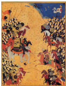
تصویر ۲: نبرد رستم با خاقان چین، هنرمند نامعلوم، شاهنامه بایسنقری، ۸۳۳ ه.ق، کاخ گلستان (همان: ۴۸)

نگاره "جنگ رستم و خاقان چین" (تصویر ۱)، نسخه مصوری از شاهنامه رشیدا مربوط به مکتب اصفهان دوره صفوی و نیز نگاره "نبرد رستم با خاقان چین" (تصویر ۲) نسخه‌ای مصور از شاهنامه بایسنقری مربوط به مکتب هرات دوره تیموری، رزم رستم با خاقان چین را نشان می‌دهد که با سپاهش به یاری تورانیان آمد تا با سپاه ایران بجنگد؛ ولی در نبردی که در گرفت، سردار خود کاموس را از دست داد و در نهایت خود خاقان که بر فیلی سپید سوار بود، توسط کمند رستم به بند کشیده شد و از کجاوه به پایین سرنگون شد. در این دو نگاره، سپاه ایران و چین در دو طرف صحنه، تصویر شده‌اند و رستم سوار بر اسب خود، کمند به دور بدن خاقان