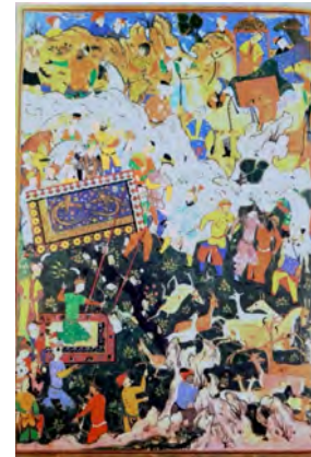
تصویر ۱۰: شکار شاهی، منتسب به علی اصغر، از شاهنامه‌های به احتمال به نام شاه اسماعیل دوم، قزوین، ۹۸۵-۹۸۴ هـ.ق، مجموعه خصوصی (کورکیان و دیگران، ۱۳۷۷: تصویر ۷۵-۷۴)