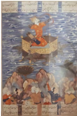
تصویر ۹: کیکاووس در آسمان، شاهنامه، هنرمند نامعلوم، ۹۵۵ هـ.ق، مجموعه سامفگ، لندن (رضوی، ۱۳۹۶: ۲۹)

نگاره "شکار شاهی" مربوط به مکتب قزوین دوره صفوی صحنه شکار شاه را به تصویر می‌کشد؛ درحالی‌که حلقه جرگه-کنندگان شکارها در چندقدمی شاهزاده تشکیل یافته و سلیقه نگارگر درباری کار خود را کرده و به چابکی صحنه کشتار را در ماهیت کارناوال شادی بخشی نشان داده‌است (تصویر ۱۰). نگاره "یوسف در بازار" مکتب مشهد دوره صفوی تصویرگر داستان فروش یوسف در بازار مصر می‌باشد. در این نگاره یوسف در میان جمعیت نشسته و خریداران وی، در حال مشورت برای خرید او هستند؛ درحالی‌که زلیخا دورتر در کجاوه مجلل خود نظاره‌گر این صحنه است (تصویر ۱۱).