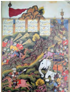
تصویر ۱: جنگ رستم و خاقان چین، شاهنامه رشیدا، هنرمند نامعلوم، نیمه نخست سده ۱۱ ه.ق، کاخ گلستان (کرباسی و دیگران، ۱۳۸۹: ۳۵۷)

در این پژوهش نقش کجاوه در چند نمونه نگاره مورد بررسی قرار خواهد گرفت که مربوط به دوره‌های صفوی (مکتب تبریز، اصفهان، قزوین و مشهد) و تیموری (مکتب هرات و شیراز) و شامل نگاره‌هایی با محتوای "بزمی" و یا "رزمی" است. نگاره‌های بزمی، نگاره‌هایی با ماهیت جشن و شادی و مهمانی و نگاره‌های رزمی، نگاره‌هایی با ماهیت جنگ و پیکار میان انسان‌ها و یا حیوانات و نیز اسارت را در برمی‌گیرد. در این بخش به بررسی و تحلیل نگاره‌ها در دو گروه "نگاره‌های رزمی" و "نگاره‌های بزمی" پرداخته می‌شود.