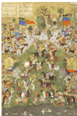
تصویر ۴: جنگ بین بهرام چوبینه و خسرو پرویز، خسرو و شیرین نظامی، هنرمند نامعلوم، سده ۱۰ هـ.ق، موزه سلطنتی اسکاتلند، ادینبرا (گری، ۱۳۸۳: ۲۱۵)