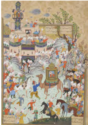
تصویر ۸: ورود عزیز و زلیخا به مصر و استقبال مصریان از ایشان، منسوب به شیخ محمد، نسخه مصور از هفت اورنگ جامی 1492D، ۹۶۳ تا ۹۷۲ هـ.ق (کرباسی و دیگران، ۱۳۸۹: ۳۴).