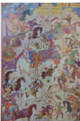
تصویر ۵: جنگ بین گو و تلخند، شاهنامه محمد جوکی، هنرمند نامعلوم، هرات، سده ۹ هـ.ق، انجمن سلطنتی آسیایی، لندن (همان: ۱۹۳)