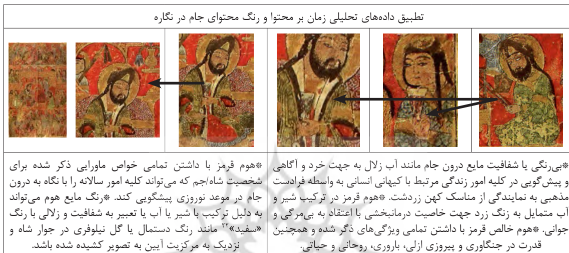
جدول ۴: تطبیق داده‌های تحلیلی زمان بر محتوا و رنگ محتوای درون جام در نگاره. (نگارنگان: ۱۳۹۹)

مذهبی، نماد زردشت باشد. وجود جام مرتبط با هر یک از فرادستان و در این نگاره به طور خاص - جم یا جمشید- با ویژگی‌های زمانی خاصی در رابطه با زندگی معمول و به زبان رمز با هستی کیهانی ایران باستان مرتبط است. برخی از این ویژگی‌ها عبارت‌اند از پیش‌بینی نیک‌بختی‌هایی مانند غلبه بر شکار، زمان نزول برکات آسمانی، موعد کشت و زرع، زمان باروری و زاد و ولد، بدست آوردن قدرت جنگی، دوری از گزند و بیماری و کلیه‌ی اموری که انسان کهن ایرانی را به زمان ازلی و جاودانگی نزدیک می‌کند. بروز و ظهور موارد ذکر شده در نگاره باریابی نسخه التریاق امر مهم دیگری را متذکر می‌شود، این که مجموعه عناصر نگاره در وحدتی با یکدیگر، نشانگر صور حسی ادیان قبل از اسلام و مرتبط با فرهنگ کهن ایران بوده که در دوران اسلامی، الهام‌بخش منابع عظیم و متنوع انواع هنرها مانند نگارگری با برخورداری از همان زبان رمز مشترک، شده است به این ترتیب، سرشت مقدس‌انگاری در عناصر تصویری نگاره مزبور، بازتاب باورهای کهن مرتبط با جاودانگی امور آیین روز نو سال نو در گشودگی