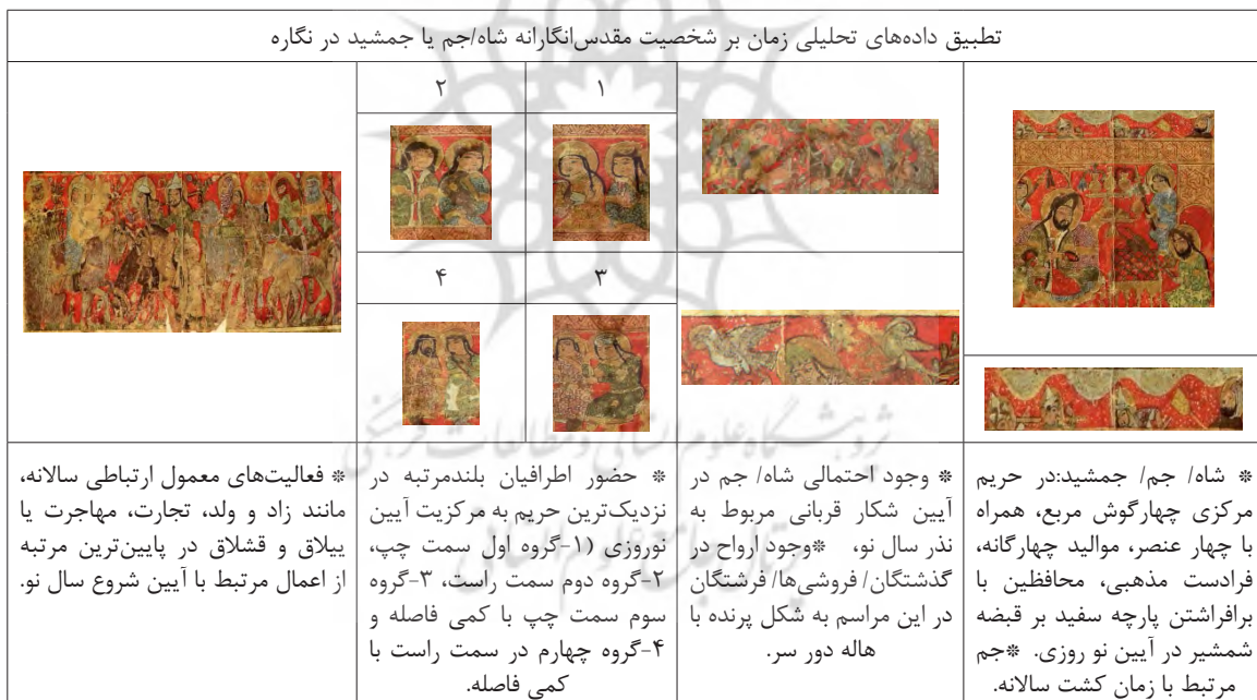
جدول ۲: تطبیق داده‌های تحلیلی زمان بر شخصیت مقدس‌انگارانه شاه/جم یا جمشید در نگاره. (نگارندگان: ۱۳۹۹)

نماد تجدید زمان است (همان: ۳۷۳). از نمونه‌ی این اشیاء، وجود جام در ارتباط با حضور فرادستان در آیین‌هایی است که ظاهراً از دوره کهن تا برخی ادوار فرهنگی ایران در دوره اسلامی، تداوم پیدا کرده‌است. بر طبق اعتقادات زردشتی، جام از یک سو با شخص زردشت مرتبط بوده، به شکلی که او با درخواست دانش الهی، رستگاری و آگاهی بر همه امور در بارگاه اهورامزدا از طریق این شیء مقدس به استجابت دعای