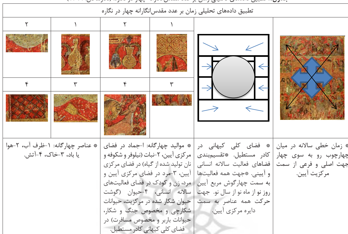
جدول ۱: تطبیق داده‌های تحلیلی زمان بر عدد مقدس‌انگارانه چهار در نگاره. (نگارندگان: ۱۳۹۹)