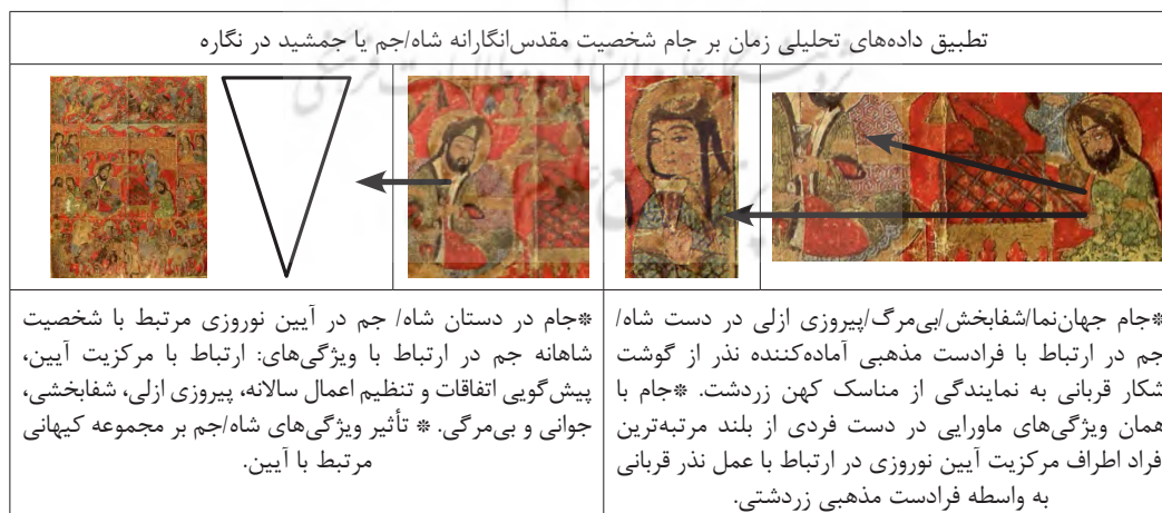
جدول ۳: تطبیق داده‌های تحلیلی زمان بر جام شخصیت مقدس‌انگارانه شاه/جم یا جمشید در نگاره. (نگارندگان: ۱۳۹۹)

و رستگاری و آگاهی، آب زلالی از جانب اهورامزدا در جام دریافت کرد (امامی، مالگرد، ۱۳۹۱: ۱۰). مورد دیگر در ارتباط با فرهنگ کهن تر ایرانی بوده و به گیاه مقدس‌انگاشته‌ای به نام