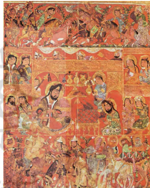
تصویر ۱: نسخه‌ی خطی جالینوس/ التریاق، مکتب سلجوقی، مأخذ: (پوپ، ۱۳۸۷: ۸۱۳)

نمونه اثر نگارگری مربوط به دوره سلجوقیان با برخورداری احتمالی از عناصر؛ عدد چهار کیهانی، شاه/جم یا جمشید، جام/جام جمشید، محتوای درون جام و رنگ آن در تطبیق و تحلیل نگاره باریابی بر اساس اندیشه الیاده مطرح است. تصویر ۱