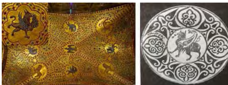
تصویر ۶ (راست): کاسه زرین‌فام، مصر، قرن ۱۰ و ۱۱ م، موزه هنر اسلامی قاهره (اتینگهاوزن و گرابر، ۱۳۸۴: ۲۸۱). تصویر ۶ (چپ): بخشی از نقوش سقف و دیوار نمازخانه پالاتین (URL7)

دوره اسلامی وارث موضوعات هنری دوره ساسانی است. نمونه‌های آن را می‌توان در نقوشی که بر بافته‌ها، ظروف فلزی و سفالی، و ... نقش بسته‌اند مشاهده نمود. اژدهای بالدار، سنمرو، گریفون و سیمرغ ساسانی، همگی نام‌هایی هستند برای حیوان تخیلی که در جای‌جای هنر ساسانی حضور