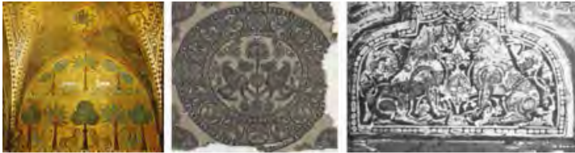
تصویر ۲ (راست): نمازخانه پالاتین، نقاشی روی طاق (تجویدی، ۱۳۴۵: ۵). تصویر ۲ (وسط): پارچه دوره سلجوقی، موزه کلیولند (URL2). تصویر ۲ (چپ): نقوش موزاییک کاری بر بخشی از دیوار نمازخانه پالاتین (URL3).

هر سه تصویر در حالت‌های بدن، مشابه هستند؛ لباس‌ها شرابه‌های حریر دارند؛ هر سه رقص با پارچه‌ای در دست در حال رقص هستند که اصطلاحاً به آن رقص روسری به دست گفته می‌شود؛ اما لوح سیسیل، خصوصیت دیگری دارد؛ لباس او نقوش دایره‌ای دارد که درون آن‌ها گل‌های پالمت دیده می‌شود. چنین طرحی ما را به یاد بافته‌های ساسانی می‌اندازد؛ هم دایره‌های متعدد و هم گل پالمت آن سبکی ایرانی (ساسانی) دارد.