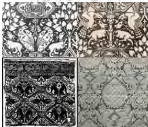
تصویر ۱۳: پارچه‌های تولیدشده در سیسیل، قرن ۱۲ م (Glazier, 2007: 160).

اکنون اجرای نقوش و طرح‌های بافته‌های ایرانی را بر منسوجات تولیدی سیسیل در دوره نورمن‌ها مشاهده می‌کنیم: پارچه‌هایی با نقش پرندگان و حیوانات قرینه در اطراف درخت زندگی (تصویر ۱۳). به‌کارگیری نگاره بز، عقاب،