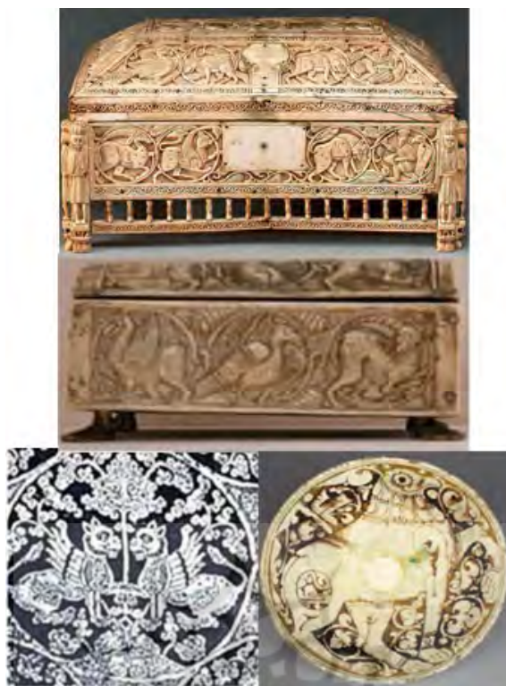
تصویر ۸ (بالا): جعبه عاجکاری مورگان، سیسیل، قرن ۱۲ م، موزه متروپلیتن (URL11). تصویر ۸ (وسط): جعبه از جنس عاج، سیسیل، قرن ۱۱ م، موزه متروپلیتن (URL12). تصویر ۸ (پایین راست): کاسه سفالی، دوره سلجوقی، موزه کلیولند (URL13). تصویر ۸ (پایین چپ): پارچه دوره آل بویه (فتحی، ۱۳۸۶: ۷۴).

(راست). چنین نقش‌مایه‌ای را هنرمندان سیسیل بر روی عاج و اشیای ظریف اجرا کرده‌اند که با اولین نگاه، ذهن مخاطب، شباهت این نقوش را (تصویر ۹ (وسط) و ۹ (چپ) به نمونه های ایرانی تشخیص می‌دهد. هم‌چنین صحنه گرفت‌و‌گیر در ردای معروف راجر دوم نیز وجود دارد (تصویر ۱۲ (راست).