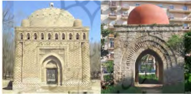
تصویر ۱۱ (راست): بنای کوبولا، پالمو، قرن ۱۲ م (URL16). تصویر ۱۱ (چپ): مقبره امیراسماعیل سامانی، بخارا، قرن ۴ هـ (URL17).

عمارت معروف به قبه (الکوبا) به فرمان گیوم دوم ساخته شد (عزیز، ۱۳۶۲: ۱۵۹). القبه دارای یک تالار گنبددار است و به این جهت القبه خوانده می‌شود. سطوح جانبی آن مستطیل و اضلاع پیش‌آمده عمودی است و به هلال‌های نوک‌داری منتهی می‌شود (کونل، ۱۳۵۵: ۴۶). هم‌چنین در پالمو بنایی معروف به کوبولا از دوره نورمن‌ها وجود دارد (تصویر