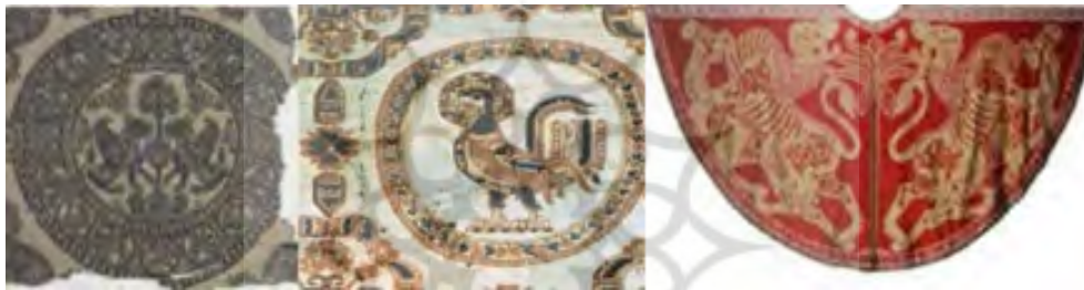
تصویر ۱۲ (راست): شنل تاج‌گذاری روجر دوم، سیسیل، قرن ۱۲ م (Mackie, 2015: 164). تصویر ۱۲ (وسط): پارچه دوره ساسانی، موزه واتیکان (گیرشمن، ۱۳۷۰: ۲۳۰). تصویر ۱۲ (چپ): پارچه دوره سلجوقی، موزه کیولند (URL18).

نقوش این شنل بیشتر اسلامی است تا بیزانسی؛ به این ترتیب که شتر و شیر که نقوش اصلی آن است شرقی (رایس، ۱۳۸۱: ۱۷۶) و از هنر پارچه‌بافی فاطمیان در مصر الهام گرفته است (اتینگهاوزن و گرابر، ۱۳۸۴: ۲۵۵). گیرشمن عقیده دارد نقوش منسوجات فاطمی به‌ویژه شنل‌های پادشاهان و اسقف‌های آن دوره از منسوجات ایران ساسانی الهام گرفته‌اند (گیرشمن، ۱۳۷۰: ۳۱۳). در نقوش پارچه‌های سیسیل به‌کرات با نقوش مشابه نمونه‌های موجود در پارچه‌های ایرانی که دارای ترکیب‌بندی متشکل از خطوط موازی که حد فاصل آن‌ها با تصاویر گیاهی و جانوری پر شده است روبه‌رو می‌شویم (Dupont-Auberville, 1987: 9). از طریق شهرهای تجاری ایتالیا مانند جنووا، پیزا و ونیز، نقش‌مایه‌های