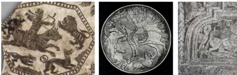
تصویر ۴ (راست): نمازخانه پالاتین، نقاشی سقف (اتینگهاوزن و گرابر، ۱۳۸۴: ۲۹۶). تصویر ۴ (وسط): بشقاب نقره‌ای، دوره ساسانی، موزه ارمیتاژ (پوپ، ۱۳۸۷: ۲۱۸). تصویر ۴ (چپ): پارچه دوره آل‌بویه، موزه کلیولند (URL5).

نیاسر و کاخ سروستان مشاهده می‌کنیم. گوشه‌سازی در هنر بیزانس از نوع پاندانتیف (لچکی) می‌باشد و در قلمرو روم غربی نیز این نوع گوشه‌سازی معمول بوده‌است. حال وقتی گوشه‌سازی تژنبه را در سیسیل مشاهده می‌کنیم، بیش از پیش به تأثیر هنر ایران در این خطه پی می‌بریم.