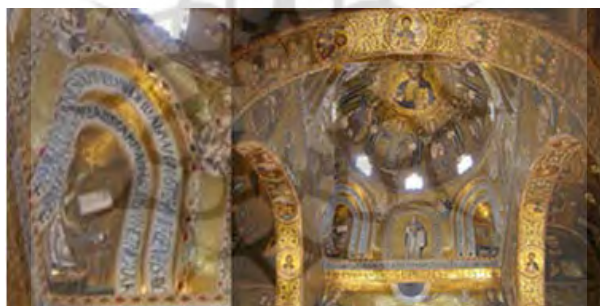
تصویر ۵: نمازخانه پالاتین، فضای زیر گنبد و بزرگ‌نمایی گوشه‌سازی (URL6).

در تصویر شماره ۵ که فضای زیر گنبد نمازخانه پالاتین را نشان می‌دهد باز هم نمود هنر ایرانی را می‌بینیم؛ گوشه‌سازی‌ها به منظور رسیدن از پایه چهارگوش به دایره گنبد از نوع تژنبه می‌باشد. این نوع گوشه‌سازی در هنر ایرانی به کرات وجود دارد و به‌خصوص نمونه‌های آن را در کاخ فیروزآباد، چهارطاقی