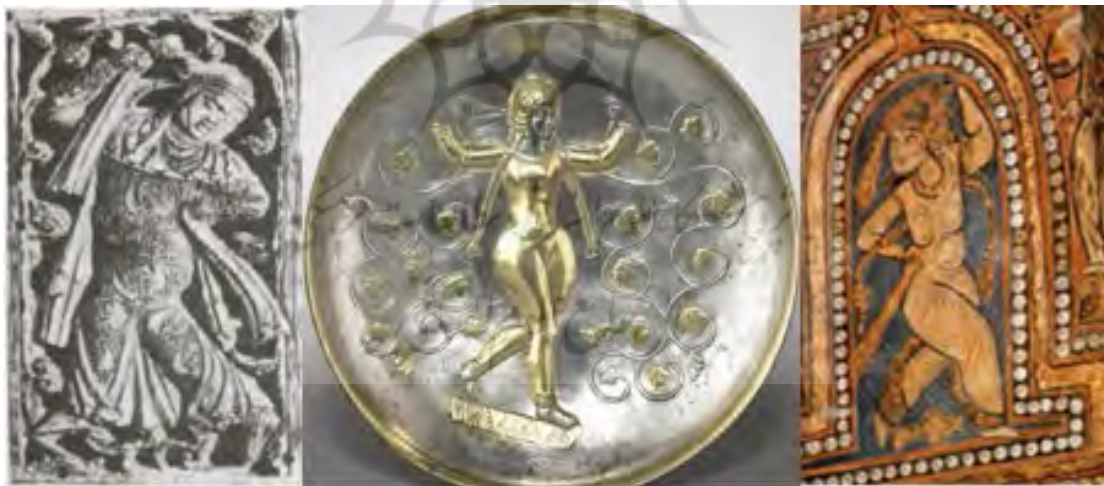
تصویر ۳ (راست): نمازخانه پالاتین، نقاشی روی طاق (Carrillo, 2017: 11). تصویر ۳ (وسط): بشقاب نقره‌ای، دوره ساسانی، موزه کلیولند (URL4). تصویر ۳ (چپ): لوح عاج کاری، احتمالاً از سیسیل، سده ۱۲ م، موزه فلورانس (اتینگهاوزن و گرابر، ۱۳۸۴: ۲۹۴).

در تصویر ۳ (راست) متعلق به طاق نمازخانه، یک موضوع شناخته شده ایرانی (ساسانی) یعنی صحنه رقص نقاشی شده است. نوع قلم‌گیری در طراحی اندام‌ها و شال‌های پیچیده و خصوصیت رقصان و مقایسه آن‌ها با تصویر ۳ (وسط) که یک بشقاب نقره ساسانی است، ما را به نکاتی که اشاره شد، بیشتر متوجه می‌سازد (تجویدی، ۱۳۴۵: ۷). در یک لوح عاج کاری که احتمالاً به سیسیل قرن ۱۲ م منسوب است نیز صحنه رقص دیده می‌شود (تصویر ۳ (چپ) و با نمونه‌های طاق نمازخانه پالاتین و بشقاب ساسانی قابل مقایسه می‌باشد.