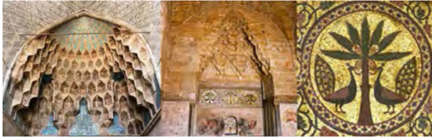
تصویر ۱۰ (راست): تالار اصلی کاخ زیزا، مقرنس کاری و بزرگ‌نمایی تزیینات (URL15). تصویر ۱۰ (چپ): مقرنس کاری مسجدجامع اصفهان، دوره سلجوقی (نگارندگان، ۱۳۹۸).

برمی‌گردد. تزیینات داخلی کاخ، هم‌چون مقرنس‌کاری‌ها، شبیه مقرنس‌های کاخ الحمرا می‌باشد. نقاشی‌هایی که زیر مقرنس کشیده شده، شبیه نقوش منسوجات ایرانی هستند؛ با موضوع معمول پرندگان قرینه در اطراف درخت زندگی و محاط درون قاب دایره‌ای (تصویر ۱۰ (راست)). مقرنس در