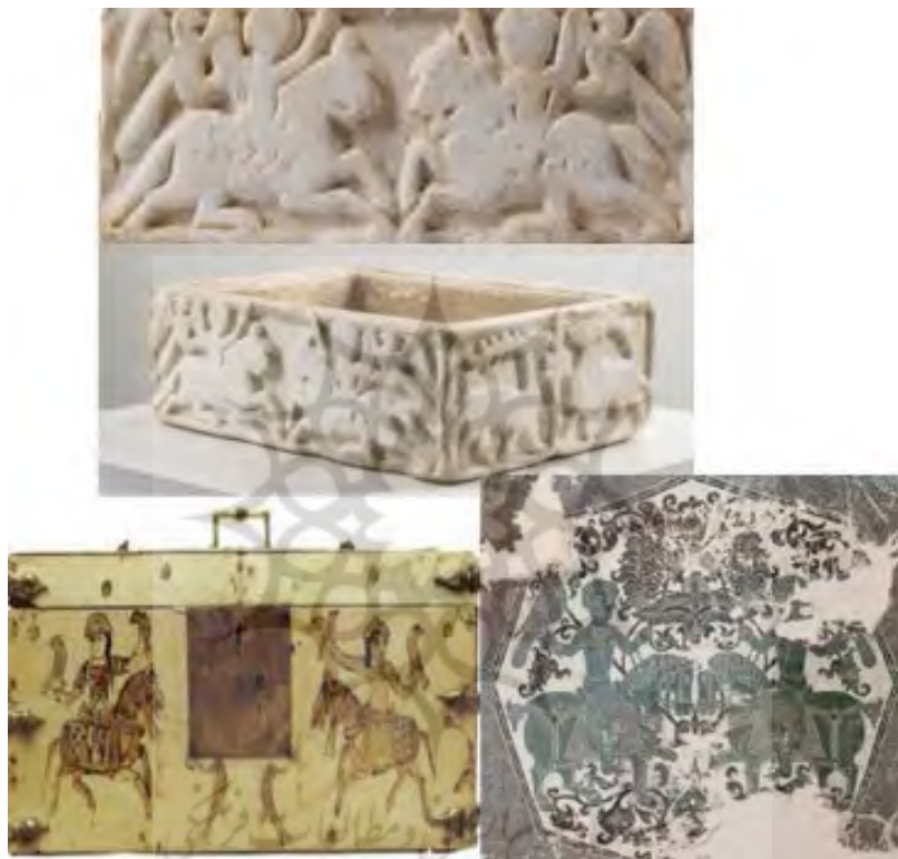
تصویر ۷ (بالا): ظرف آب، سیسیل، قرن ۱۲ م، موزه دولتی برلین (URL8). تصویر ۷ (پایین راست): بافته ابریشمی، احتمالاً ری، قرن ۵ هـ ال‌بویه، موزه ایگ استیوتانگ (URL9). تصویر ۷ (پایین چپ): جعبه چوبی، سیسیل، قرن ۱۲ م، گالری دی باکر بلژیک (URL10).

می‌باشد که دو سوارکار درحالی‌که هر کدام شاهینی در دست دارند بر روی آن نقش شده‌است؛ نقش این ظرف قابل مقایسه با نمونه‌های ایرانی می‌باشد. مقایسه آن با تصویر ۷ (پایین راست)، ماهیت ایرانی آن را محرز می‌کند. هم‌چنین بر جعبه چوبی کوچکی متعلق به قرن ۱۲ م از جزیره سیسیل، سوارکاری را نقاشی کرده‌اند که روی هر دو دست پرنده دارد (تصویر ۷ (پایین چپ)).