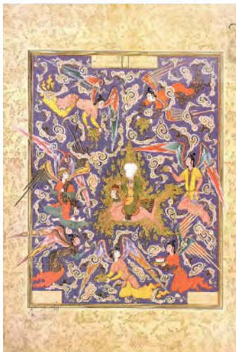
تصویر ۱: دفتر هفتم، مجلس اول (خردنامه اسکندری، معراج حضرت رسول(ص) (حسینی، ۱۳۸۵: ۱۷)

روح معجزه‌آسای پیامبر به آسمان می‌پردازد که نخستین بار در قرآن کریم به آن اشاره شده است. این توصیفات تا بیت ۱۰۶ ادامه دارد. پس از آن شاعر در بخشی کوتاه به پرواز حضرت محمد(ص) سوار بر براق از فراز مکه به بیت المقدس می‌پردازد جایی که سیارات به گرد او جمع می‌شوند و راه را با سکه‌های زر مفروش می‌کنند. در بیت ۱۲۲ شاعر به این نکته اشاره می‌کند که حضرت محمد و حضرت موسی(ع) از خداوند می‌خواهند تا خود را به آنها بنمایاند، خداوند با درخواست حضرت محمد(ص) موافقت می‌کند در حالی که به درخواست حضرت موسی با اشاره کردن به کوه طور پاسخ می‌دهد، این جایگاه و مرتبه پیامبر(ص) را در پیشگاه خداوند نشان می‌دهد. بر اساس آنچه که در کتاب شعر و نقاشی ایرانی توسط ماریانا سیمپسون نگارش شده و شامل بیست و هشت نگاره می‌باشد، چنین بر می‌آید، که همسو با منظومه شاعرانه‌ای که نگاره ملهم از آن است، نگاره جامی فریر به زیبایی عروج پیامبر به ملکوت را به تصویر کشیده است. جمال او در هاله‌ای از نور که نشانه تقدس اوست نشان داده شده. حضرت محمد(ص) سوار بر براق بر پهنه آسمان لاجوردی در پرواز است در حالی که پیرامون او را فرشتگان و ابرها پر کرده‌اند، شش فرشته به همراه جبرئیل که با بال‌های الوان و درخشان در پروازند، گرداگرد پیامبر تصویر شده است. تصویر فرشتگان و آرایش موها و لباس‌ها با الهام از سنت هنری مرسوم در نقاشی ایرانی و ترکی قرن شانزدهم و طرح‌های نگاره‌ای آن دوران نقاشی شده‌اند (سیمپسون، ۱۳۸۳: ۱۴) (تصویر شماره ۱)