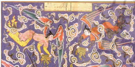
تصویر ۵: فرشتگان در حال نور افشانی (بخشی از تصویر شماره ۱)

دو فرشته در بالای تصویر بر پیامبر (ص) نور می افشانند، فرشته ای در سمت چپ در حال عطر افشانی ست و دو فرشته در پایین با طبق هایی در دست پیامبر به استقبال آن حضرت آمده اند و ایشان را همراهی می کنند. و در نهایت فرشته ای در پیش پای پیامبر به حالت کرنش با چشمانی شگفت زده به پیامبر سوار بر براق زده است (تصویر ۵ تا ۸).