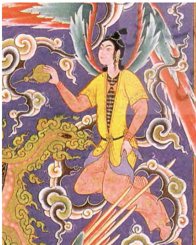
تصویر ۶: فرشته ای در حال عطر افشانی (بخشی از تصویر شماره ۱)