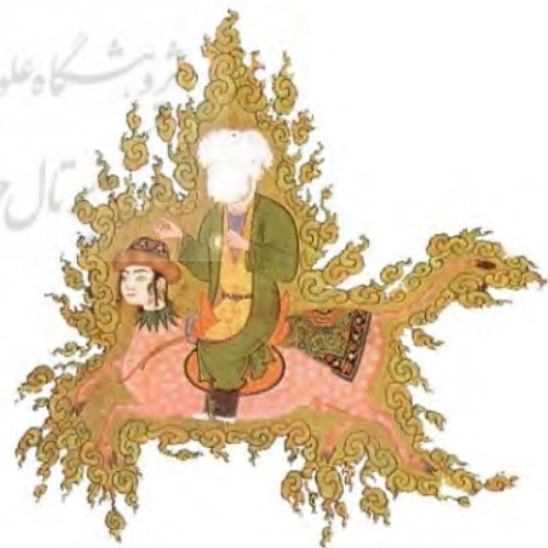
تصویر ۴: پیامبر (ص) سوار بر براق (بخشی از تصویر شماره ۱)