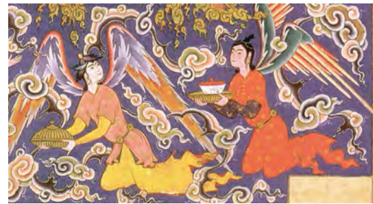
تصویر ۷: فرشتگان با طبق‌هایی در دست (بخشی از تصویر شماره ۱)