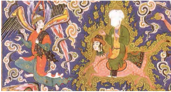
تصویر ۲: تصویر جبرئیل در محضر حضرت پیامبر (ص) (بخشی از تصویر شماره ۱)