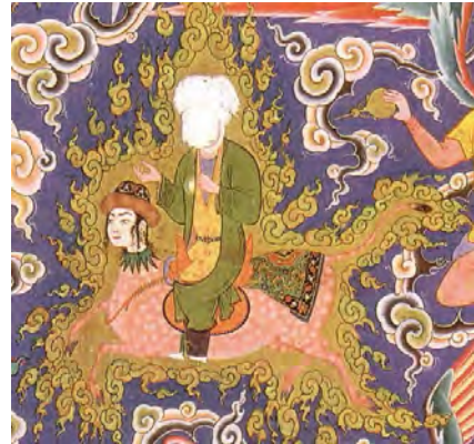
تصویر ۳: توصیف براق (بخشی از تصویر شماره ۱)