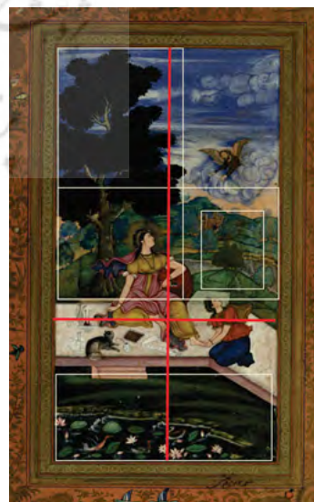
تصویر ۷: نگاره‌ای با مضامین مسیحی، سبک اروپایی (مرقع گلشن: ۸۳).

نگاره‌ای با مضامین مسیحی همانند چند تصویر قبلی قالب مستطیل‌شکل دارد؛ و نظام ترکیب‌بندی آن عمود و افق (شطرنجی) و دارای ۴ پلان است که منظره در تمام تصویر با زاویه دید بالا و مقابل مشاهده می‌شود. عناصر طبیعت در پایین نگاره شامل برکه‌ای از گل‌های نیلوفر آبی و مرغابی‌هایی در تکاپو می‌باشد؛ علاوه بر آن چمنزاری سرسبز همراه با پوشش گیاهی کم و درخت تنومندی در سمت چپ نگاره مشاهده می‌شود و در انتها درختان کوچک در سراسر پس‌زمینه و آسمان آبی با ابرهای سفید توپر و گرد قرار دارد (تصویر ۷).