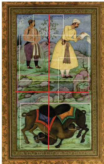
تصویر ۵: نزاع شتران، احتمالاً سده یازدهم هجری، سبک هندی (مرقع گلشن: ۳۰۲)