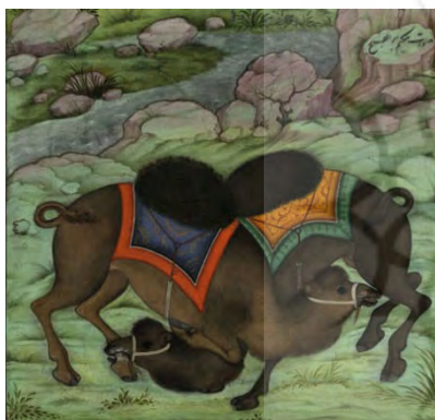
تصویر ۶: بخش بزرگ‌نمایی شده نگاره نزاع شتران، احتمالاً سده یازدهم هجری، سبک هندی (مرقع گلشن: ۲۰۳).