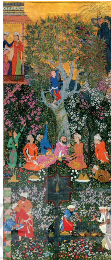
تصویر ۴: بخش بزرگ‌نمایی شده نگاره تفرج در طبیعت، سده ۱۰ ه.ق، سبک ایران و هند (مرقع گلشن: ۲۱۹).

عنصرخط در فرم و طراحی گیاهان دیده می‌شود و سطح در این اثر حضور خاصی ندارد. حجم را می‌توان در دو شتر در حال نزاع و تپه‌ماهورها مشاهده کرد و عنصر بافت را می‌توان به صورت پرداز در پس‌زمینه و تپه‌ها و دوشتر و درختچه‌ای کوچک در سمت چپ در انتهای نگاره دید. عنصر نور و رنگ در این نگاره به زیبایی جلوه می‌کند و ضمن ایجاد سایه‌روشن‌های زیبا و دلچسب فضایی ملایم و دل‌انگیز خلق می‌کند. علاوه بر آن رنگ ایجاد تضاد تیرگی و روشنی کرده و رنگ‌های سرد در این نگاره غالب است. حرکت را در نزاع شتران و پرندگان در حال پرواز می‌توان دید. ریتم هم در گیاهان و تپه‌ماهورهای سراسر منظره وجود دارد؛ اما وجود دو شتر و در امتداد آن رود، تپه‌ها، دو پیکره متقارن و در انتها