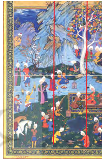
تصویر ۱: مجلس بزم شاه، سده ۱۰ ه.ق، سبک ایران (مرقع گلشن: ۴۶).

چنار رنگینی در سمت راست نگاره از کادر اصلی بیرون زده و درختچه‌ای کوچک همراه با درختانی با شکوفه سفید و صورتی در سمت چپ اثر دیده می‌شود که این عناصر تقریباً قرینه چیده شده‌اند و دیگر کوه‌ها و صخره‌های عمود و بالا رونده از کادر اصلی خارج شده‌اند و روی آن درختچه‌هایی کوچک دیده می‌شود و در آخر آسمان پر ستاره شب به همراه ابر و ماه در گوشه سمت چپ نگاره مشاهده می‌شود (تصویر ۱).