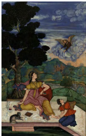
تصویر ۸: بخش بزرگ‌نمایی شده نگاره‌ای با مضامین مسیحی، سبک اروپایی، (مرقع گلشن: ۸۳).

عنصر نقطه در این تصویر به صورت گل‌های درون برکه و بوته‌های چمنزار و درختان کوچک پس‌زمینه دیده می‌شود. خط و سطح، حضور چشمگیری ندارد. حجم به صورت ابرهای بزرگ و گرد، تپه‌های سرسبز و درختان کوچک در پس‌زمینه و درخت بزرگ سمت چپ نگاره مشاهده می‌شود. بافت هم به صورت سایه‌روشن در چمنزار و تنه درخت‌ها و ابرها دیده می‌شود. عنصر رنگ در منظره بیشتر به صورت رنگ‌های سرد و تیرگی و روشنی می‌باشد که در ارتباط با پیکره‌ها تضاد رنگی ایجاد می‌کند. نور و رنگ ایجاد حجم کرده و به صورت موضعی به کار برده شده است. در این نگاره، پرسپکتیو به صورت درختان کوچک و عمارتی در دور دست نمایان است. حرکت در پرندگان آبیگر و ابرها و ریتم در چمنزار و درختان پس‌زمینه قابل مشاهده است؛ اما وجود آبیگر و درخت تنومند و پیکره‌ها در یک راستا ترکیب‌بندی عمود و هماهنگی میان عناصر تصویر ر به وجود آورده است و همان‌طور که مشاهده شد منظره‌پردازی در این نگاره دارای خصوصیات متغیر است؛ زیرا طبیعت در این نگاره شامل ویژگی‌های اروپایی؛ از جمله فضای سه‌بعدی، پرسپکتیو جوی، عمق‌نمایی و واقع‌نمایی است. البته خصوصیات هندی مثل تزیین در آن حفظ شده اما نورپردازی و فضا سازی شبیه نیست و غلط‌سازی شده، زیرا گاهی فضا اروپایی اما پیکره‌ها دو بعدی است. مجموع بروز خصوصیات متضاد و ناهمگون در اثر، نمایانگر بروز تدریجی تأثیر هنر اروپایی در هنر شبه قاره و کمرنگ‌تر شدن تأثیر