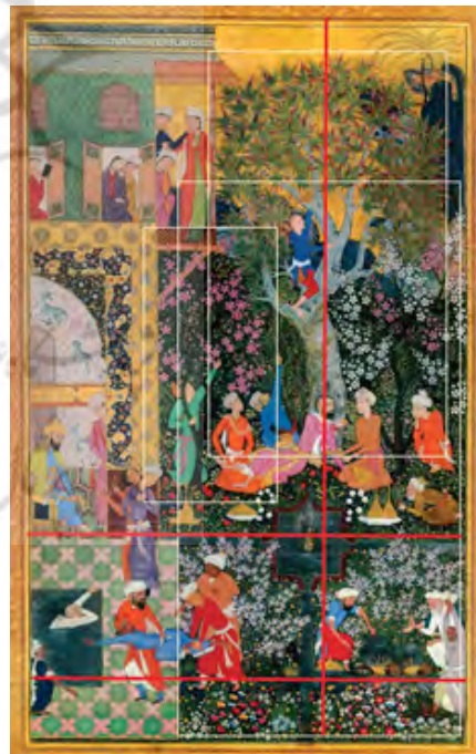
تصویر ۳: تفرج در طبیعت، سده ۱۰ ه.ق، سبک ایران و هند (مرقع گلشن: ۲۱۹)

نگاره بعدی با عنوان تفرج در طبیعت، قالب مستطیل شکل و نظام ترکیب‌بندی عمود و افق (شطرنجی) دارد. تصویر شامل ۳ پلان منظره و عمارت است که طبیعت‌پردازی در تمامی پلان‌ها و با زاویه دید مقابل و بالاست به عبارت دیگر تلفیق دو زاویه در آن مشاهده می‌شود. طبیعت در این نگاره باغ بهاری را تداعی می‌کند و شامل پس‌زمینه سرسبز است که در سراسر آن انواع گل‌های بهاری، غنچه سفید، صورتی، زرد، نارنجی، قرمز و آبی خودنمایی می‌کند و آب در قالب حوض و در کنارش انواع گیاهان و گل‌های رنگین دیده می‌شود؛ اما دو درخت شکوفه سفید و صورتی در سمت راست نگاره و یک درخت چنار تنومند در مرکز و متمایل به راست و در سمت چپ آن درختچه‌ای کوچک و درخت شکوفه‌دار صورتی قرار دارد که این درختان به صورت قرینه در کنار هم قرار گرفته‌اند و در آخر تپه ماهورها و درختچه‌ای کوچک بر بالاترین قسمت آن و آسمان طلایی زرین‌فام بدون ویژگی خاصی دیده می‌شود (تصویر ۳).