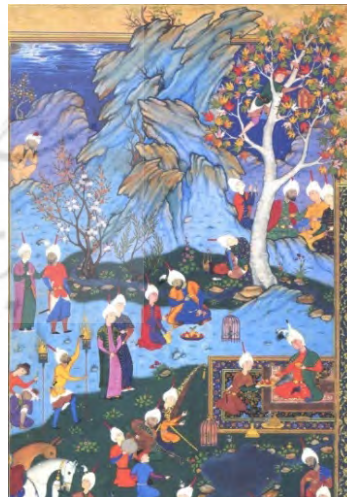
تصویر ۲: بخش بزرگ‌نمایی شده از نگاره مجلس بزم شاه، سبک ایران (مرقع گلشن: ۴۶)

گل و بوته‌ها، شکوفه‌ها و برگ درختان و تکه‌سنگ‌های کوچک در سراسر نگاره به صورت عنصر بصری نقطه دیده می‌شود. صخره‌ها در تعلیق بین عنصر خط و سطح قرار دارد و