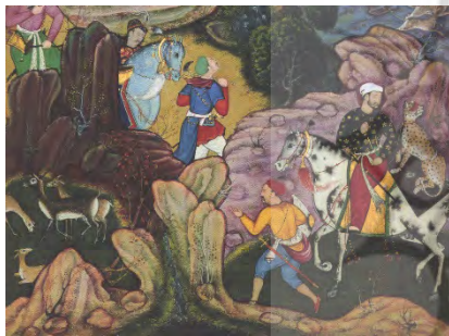
تصویر ۱۱: بخش بزرگ‌نمایی شده نگاره ملک و همراهان با ساز و برگ شکار، (ساخت و ساز و پرداز حیوانات و تپه‌ماهورها به شیوه ایران و هند، اختلاط سبک‌ها، (مرقع گلشن: ۲۱۵).

پرنندگان و برگ درختان و حتی درختان کوچک به صورت عنصر بصری نقطه دیده می‌شود. خط و سطح در این نگاره حضور چشمگیری ندارد و حجم‌پردازی و بافت (به شیوه پرداز) را در تپه‌ماهورها، درختان، چمنزار و انواع حیوانات می‌توان دید. نور و رنگ به شیوه ایران و هند بوده و به صورت یکپارچه در کار دیده می‌شود و هارمونی رنگ نیز بر نگاره حاکم است. رنگ‌های متضاد عناصر طبیعت در ارتباط با پوشش پیکره‌ها علاوه بر ایجاد رنگ‌های مکمل، سرد و گرم، تیره و روشن، سبب ریتم و حرکت در تصویر شده است و به لحاظ ساختاری شیوه قرارگیری درخت بزرگ در مرکز و در راستای آن تپه‌ماهورها، باعث تقسیم‌بندی عمود در کار شده و تعادل و