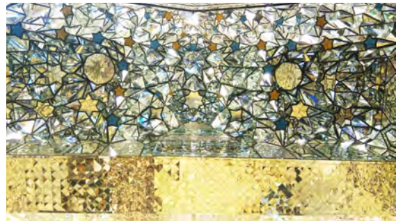
تصویر ۸: رواق دارالسیاده، صغه جنوب شرقی، آینه‌کاری با استفاده از شیشه‌های رنگی.

شمعدان در زیر طاق صغه جنوب‌غربی و قاب‌ها و مقرنس‌های رنگین صغه جنوب‌شرقی است (حسینی، ۱۳۹۳: ۴۴۰؛ جلالی، ۱۳۹۵) (تصویر ۸).