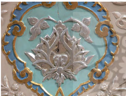
تصویر ۲: شیوه کُپ‌بری، رواق دارالحجه.

یکی از شیوه‌های تزئینی دیگر در آینه‌کاری، کُپ‌بری است. آینه‌هایی که به این منظور استفاده می‌شود، در واقع حباب‌هایی هستند که نخست داخل آن‌ها را جیوه نموده و برش می‌دهند و سپس دورتادور آن را به شکل گل و برگ گچ‌بری کار می‌کنند. از این گونه آینه‌ها در رواق‌های دارالحجه و امام‌خمینی استفاده شده‌است (سادات، ۱۳۹۵ الف؛ جلالیان، ۱۳۹۴ ب) (تصویر ۲).