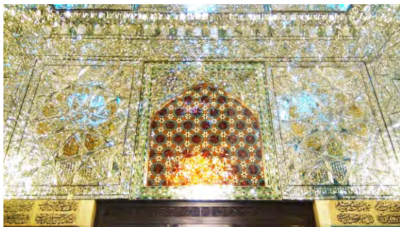
تصویر ۶: رواق دارالسیاده، دهانه شمالی، آینه رنگی با طرح مشبک چوب.

بدنه رواق دارالسیاده در قسمت پایین ازاره با سنگ و در بالای آن با آینه تزیین گردیده است. به گونه‌ای که سرتاسر بدنه رواق قاب‌بندی شده و داخل قاب‌ها با انواع طرح‌های گره، نظیر هشت و دوازده شمشه ته بریده و ده پا بزی تمام برجسته با حاشیه‌ای از گره هشت و هشت قناس الماس تراش کار شده است. شاه گره از دیگر انواع گره به کار رفته در رواق دارالسیاده است؛ به طوری که انتهای دهانه شمالی و جنوبی رواق در پایین ردیفی از قطار، شاه گره ده تند با حاشیه‌ای از قُپه و الماس تراش کار شده است. علاوه بر این، در وسط دهانه شمالی با کمک شیشه‌های رنگی طرح مشبک چوب کار شده است (جلالیان، ۱۳۹۵ ج؛ اشرف گنجوی، ۱۳۸۷؛ سادات، ۱۳۹۵ ب؛ حسینی، ۱۳۹۳: ۴۴۰) (تصویر ۶).