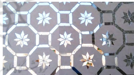
تصویر ۱: شیوه گچ و آینه، صحن جمهوری (نگارنده، ۱۳۹۵).