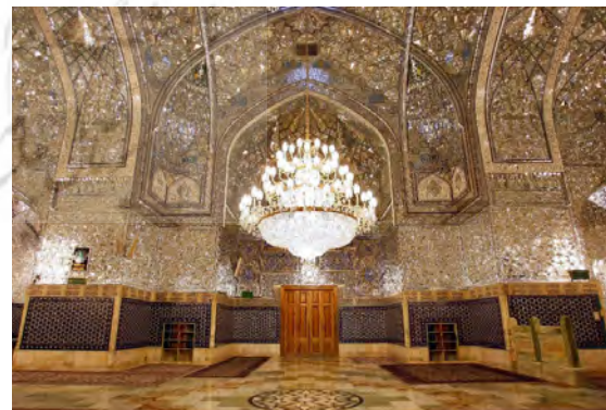
تصویر ۳: رواق دارالسیاده.