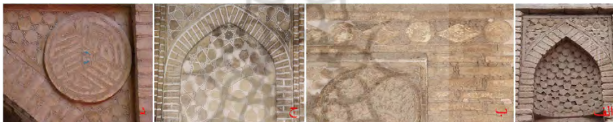
تصویر ۳: آرایه‌های تلفیقی آجری و گچی (الف) نغول تزیینی مسجد گز (ب) قاب بندهای ایوان غربی مسجد گز (ج) محراب مسجد سین (د) کتیبه کوفی مدور مسجد گز.

اخیر با مقرنس‌کاری نعلبکی مناره سلجوقی راهروان اصفهان، شباهت کامل دارد. تا مدت‌ها مناره سین، قدیمی‌ترین بنای ایرانی تاریخ‌دار با آرایه‌های کاشی محسوب می‌شد (گدار و دیگران، ۱۳۸۴: ۱۸۴)؛ تا این‌که تحقیقات محققان ایرانی نشان داد که این مناره، دومین بنای کتیبه‌دار کاشی‌کاری شده ایران به تاریخ ۵۲۶ ه.ق است (مخلص، ۱۳۷۹: ۳۴۳).