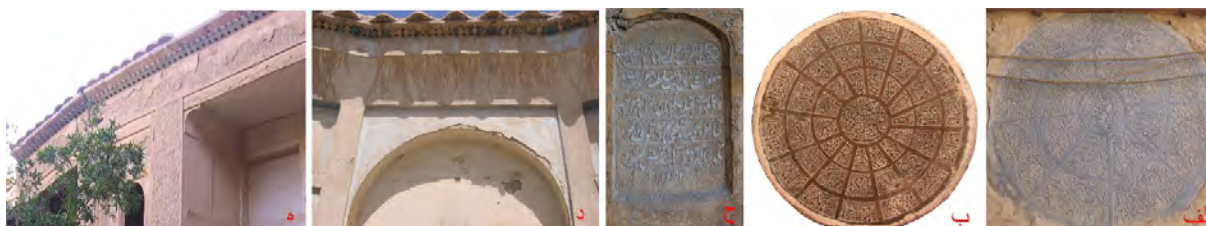
تصویر ۱۷: آرایه‌های سنگی و آجری (الف) کتیبه سنگی مسجد جامع گز (ب) کتیبه سنگی بقعه امامزاده نرمی (ج) کتیبه سنگی کاروانسرای مورچه خورت (د) خانه‌ای در دولت‌آباد (ه) خانه‌ای در گز (نگارنده، ۱۳۸۴).

بوده است. این پنجره‌ها در اشکال مدور، نیم‌مدور و چهارگوش است (تصویر ۱۸ - الف و ب). هم‌چنین سقف‌های چوبی لمبه‌کوبی‌شده نیز در یکی از خانه‌های گز و باغ نو سفیدآب (تصویر ۱۸ - ج)، دیده می‌شود.