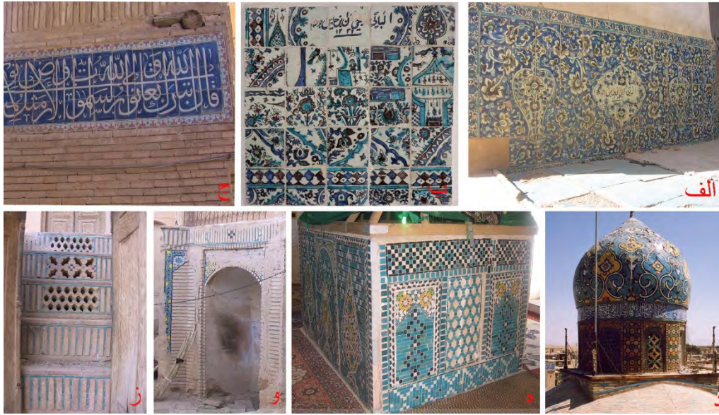
تصویر ۱۵: آرایه‌های کاشی الف) کاشی هفت‌رنگ، مسجد جامع مورچه‌خورت (ب) کاشی هفت‌رنگ، بقعه سیدعلی مورچه‌خورت (ج) کاشی هفت‌رنگ، مسجد جامع گز (نگارنده، ۱۳۹۰) (د) کاشی معرق، هفت‌رنگ و نره، بقعه امامزاده نرمی (نریمانی، ۱۳۷۰) (ه) کاشی معرق، بقعه شاهزاده ابوالحسن کمشچه (و) کاشی معرق، خانه‌ای در گز (ز) کاشی معقلی و تکرنگ، خانه‌ای در گز (نگارنده، ۱۳۸۴).

در منازل، بیشتر مختص بناهای مذهبی بوده و در فضاهای هم‌چون سردر ورودی و محراب‌ها به کاررفته است. استفاده از رنگ به منظور تزیین آلت‌های کاربردی نیز رایج بوده؛ با این وجود کاربردی‌های منقوش از کمیت پایینی برخوردار بوده است (تصویر ۱۶ - ب و ج). تزیینات قطاربندی گچی و خشت و گلی از دیگر آرایه‌های سازه‌ای این دوره است که در نمای بیرونی بعضی از کبوترخانه‌های ۸ منطقه به کاررفته است (تصویر ۱۶ - د).