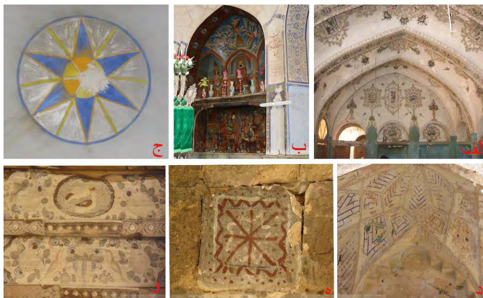
تصویر ۱۴: تزیینات نقاشی الف) خانه کدخدا حسین گرگاب ب) بقعه عبدالمؤمن حبیب‌آباد ج) مسجد جامع گرگاب د) تکیه دلیگان ه) خشت منقوش، خانه‌ای در مورچه‌خورت و) جوک‌کاری، خانه‌ای در مورچه‌خورت (نگارنده، ۱۳۸۴).

دوره است که در بنای شاهزاده ابوالحسن ۷ کمشچه (تصویر ۱۵ - ه)، قبه بقعه امامزاده نرمی (تصویر ۱۵ - د) و یکی از خانه‌های اعیانی گز (تصویر ۱۵ - و) دیده می‌شود. کاشی‌های بنای شاهزاده ابوالحسن که در پوشش صندوق قبر به‌کاررفته، در مقایسه با نمونه‌های معرق دوره صفوی از منظر چگونگی اجرا و رنگ و لعاب کیفیت پایینی را نشان می‌دهد. نمونه‌های کاشی‌کاری معقلی در یکی از منازل مسکونی اعیانی گز (تصویر ۱۵ - ز) شناسایی شده است. این آرایه‌ها از نقوش گل‌انداز و بندکشی‌های کاشی تشکیل شده که در راه‌پله بنا به‌کاررفته است. این موضوع در کنار کاربرد کاشی معرق در این خانه، خصوصیتی است که در منازل مسکونی به ویژه در نواحی روستایی کمتر معمول بوده است. کاشی نره به عنوان گونه‌ای خاص از کاشی که مختص پوشش خارجی گنبدها بوده است، در قبه بقعه امامزاده نرمی به‌کاررفته بود (تصویر ۱۵ - د).