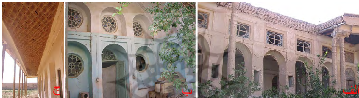
تصویر ۱۸: آرایه‌های چوبی (الف) خورشیدی‌ها، خانه‌ای در گز (ب) خورشیدی‌ها، خانه‌ای در دولت‌آباد (ج) آرایه چوبی سقف، باغ نو سفیدآب (نگارنده، ۱۳۸۴).

از آرایه‌های چوبی که برای اولین بار از این دوره قابل پیگردی است، پنجره‌های چوبی موسوم به خورشیدی است که به اشکال گره‌های هندسی با تکنیک مشبک‌کاری با شیشه‌های الوان تزیین شده و مختص برخی منازل این دوره