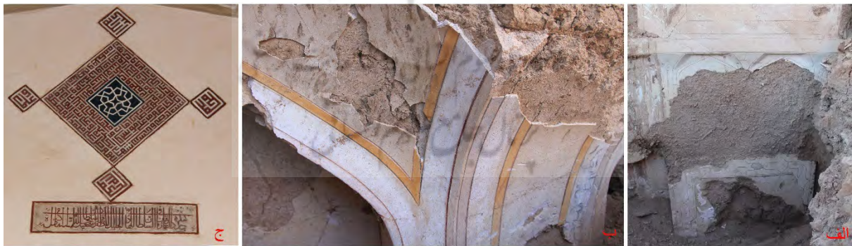
تصویر ۹: آرایه‌های گچی و دیوارنگاره (الف) خانه‌ای در محوطه درمیان (ب) خانه‌ای در محوطه ریگ (ج) مسجد گز (نگارنده: ۱۳۹۰).

با توجه به آثار برجای مانده، آرایه‌های گچی بناهای برخوار در دوره زمانی مورد بررسی همانند روند حاکم بر آرایه‌های معماری دوره صفوی، اندک بوده و در مقایسه با نمونه‌های دوره‌های متقدم و میانه سطح و شیوه هنری نازل و متفاوتی را نشان می‌دهد. این آرایه‌ها عمدتاً شامل ابزاراندازی‌ها و قاب‌بندهای گچی شکل‌گرفته از شمشه‌کاری است که بر سطوح بناهای صفوی هم‌چون اقامتگاه شاهی علی‌آباد ریگ،