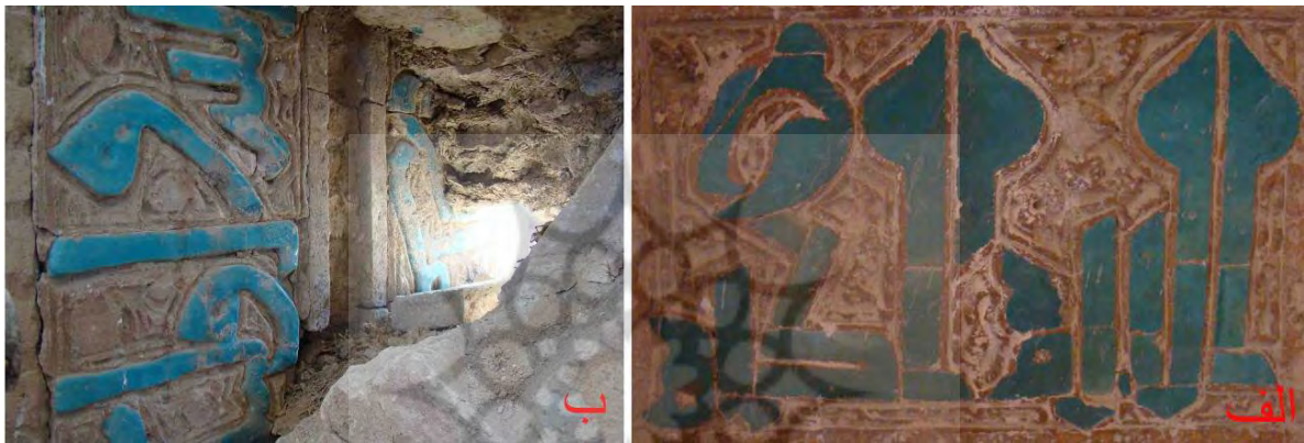
تصویر ۵: آرایه تلفیقی کاشی و گچ (الف) محراب مسجد گز (ب) کتیبه زیر پاکار طاق اولیه ایوان غربی مسجد گز (نگارنده: ۱۳۹۲).

تلفیق آرایه گچی و کاشی، دیگر شیوه مورد استفاده در این دوره است. همانند شیوه تلفیق آجر و کاشی، کاشی‌های مورد استفاده در این شیوه نیز به رنگ فیروزه‌ای است. از نمونه‌های این شیوه که در محراب مسجد جامع گز دیده می‌شود کتیبه کاشی به خط کوفی مورق بر زمینه گچی است (تصویر ۵ - الف). کتیبه فوقانی ایوان غربی مسجد یاد شده که در نتیجه مرمت اخیر به خوبی نمایان شده نیز، کاربرد همین شیوه را نشان می‌دهد (تصویر ۵ - ب). این شیوه کاشی‌کاری در دوره ایلخانی کاربرد بیشتری یافته و از جمله نمونه‌های شاخص آن، برج مدور مراغه