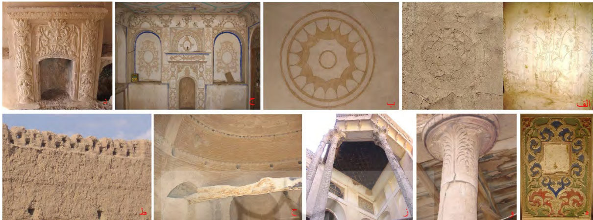
تصویر ۱۳: آرایه‌های گچی (الف) کشته‌بری، خانه‌ای در مورچه‌خورت (ب) کشته‌بری رنگی، خانه‌ای در علی‌آباد (ج) کشته‌بری و نقاشی دیواری، خانه غفاری‌ها در محسن‌آباد (د) بخاری دیواری، باغ نو سفیدآباد (ه) گچ‌بری برجسته و رنگ‌کاری، خانه‌ای در مورچه‌خورت (و) گچ‌بری بر چوب، قلعه رحمت‌آباد شمالی (ز) گچ‌بری بر چوب، خانه‌ای در گز (ح) آرایه‌های خشت و گلی، آسیاب درمیان (ط) آرایه‌های خشت و گلی، یخچال خوشی دولت‌آباد (نگارنده، ۱۳۸۴ و ۱۳۸۶).

تشکیل می‌دهد (تصویر ۱۳ ح و ط). این گونه، با توجه به مصالح در دسترس و ارزان، از ویژگی‌های بومی منطقه ریشه گرفته و عمدتاً در تزیین منازل مسکونی کاربرد داشته و در دیگر بناهای خشت و گلی منطقه هم‌چون برخی قلاع،