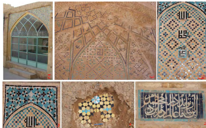
تصویر ۱۰: آرایه‌های کاشی الف) کاشی معقلی در مسجد گز ب) کاشی معقلی کاروانسرای گز ج) کاشی معقلی مسجد جامع مورچه‌خورت د) کاشی معرق کتیبه‌ای مسجد گز ه) کاشی معرق هندسی مدرسه جعفرآباد و) کاشی معرق هندسی مسجد گز (نگارنده: ۱۳۸۴ و ۱۳۹۲).

بر خلاف آثار دوره قبل به ویژه دوره سلجوقی، صرفاً جنبه آمودی و غیر باربر داشته و مصالح متفاوتی دارد. سطوح این مقرنس‌ها بعضاً با ابزاراندازی و رنگ‌کاری تزیین شده است. با توجه به آثار موجود، ظهور کاربندی در بناهای منطقه در این دوره بوده است. این کاربندی‌ها در دو گونه سازه‌ای و آمودی در دو دسته گچی و آجری قرار می‌گیرند. کاربندی‌های آجری به اشکال گوناگون در بناهایی هم‌چون مسجد جامع گز (تصویر ۱۱.ه)، کاروانسرای گز (تصویر ۱۱.و) و کاروانسرای شیخ‌علیخان (تصویر ۱۱.ز) و کاربندی‌های گچی در بناهایی هم‌چون خانه حاج عابدی‌های شاپورآباد (تصویر ۱۱.ح) و مدرسه جعفرآباد (تصویر ۱۱.ط) دیده می‌شود.