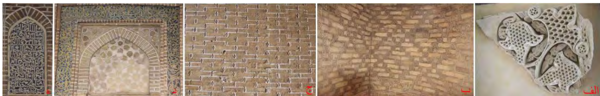
تصویر ۶: الف) آرایه گچی مکشوفه در بقعه امامزاده نرمی ب) آرایه گچی کلوک‌بند در مسجد گز (ج) آرایه گچی کلوک‌بند در مسجد سین (د) کتیبه گچی رنگ‌آمیزی شده در محراب مسجد سین (ه) کتیبه سنگی در گنبدخانه مسجد سین.

آرایه گچی در این دوره، فقط در مقبره امامزاده نرمی به کار رفته است (تصویر ۶ - الف). از این آرایه‌های گچی چند قطعه مانده و همان‌گونه که پیشتر بدان اشاره شد، در حین تخریب گنبدخانه بنا به دست آمده است. آرایه مذکور از نقوش گیاهی آژده‌کاری شده تشکیل شده و با بسیاری از نمونه‌های دوره سلجوقی قابل مقایسه است. از دیگر آرایه‌های گچی، آرایه گچی کلوک‌بند است که سطوح دیواره‌های آجری دو مسجد گز و سین را پوشانده است (تصویر ۶ - ب و ج). این آرایه به عنوان یکی از ویژگی‌های مختص دوره سلجوقی (مکی‌نژاد، ۱۳۸۷: ۱۸۶)، به وفور در آرایه‌های معماری این دو