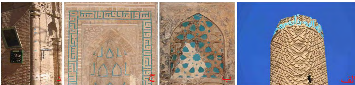
تصویر ۴: آرایه‌های تلفیقی آجر و کاشی (الف) مناره سین (ب) محراب مسجد گز (ج) محراب مسجد گز (د) نیم ستون تزیینی ایوان غربی مسجد گز.

سومین شیوه تزیینی، آرایه‌های تلفیقی کاشی و آجر است که از ترکیب کاشی‌های فیروزه‌ای تکرنگ با آجرهای قالبی و پیش‌بر به وجود آمده است. این آرایه‌ها در قالب کتیبه‌های کوفی منار سین (تصویر ۴ - الف)، کتیبه‌های بنایی و نقوش گره‌بندی محراب گز (تصویر ۴ - ب و ج) و هم‌چنین قطار بندی محراب مسجد گز (تصویر ۲ - د) تجسم یافته است. شیوه