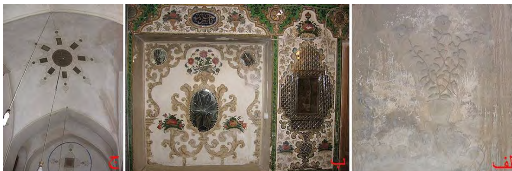
تصویر ۱۹: آرایه‌های آهکی، حمام مورچه‌خورت (ب) آرایه آینه‌ای، خانه محمدصادق خان برومند در خورزوق (ج) آرایه آینه‌ای، خانه کدخدا حاج محمدحسین لودریجه (نگارنده، ۱۳۸۴).

آرایه‌های آهکی حمام مورچه‌خورت که شامل تزیینات دالبردار و گلدان گل است نیز دارای چنین شرایطی بوده و معدود نمونه آرایه‌های آهکی برخوردار در این دوره و کل دوره‌های مورد بررسی را تشکیل داده است (تصویر ۱۹ - الف). همانند آرایه‌های چوبی و آهکی، آرایه آینه‌ای نیز برای اولین بار از بناهای دوره قاجار منطقه قابل پیگردی است. این آرایه‌ها که