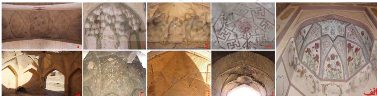
تصویر ۱۱: الف) دیوارنگاره‌های محراب مسجد گز ب) دیوارنگاره‌های بقعه عبدالمؤمن ج) آرایه مقرنس‌کاری مسجد گز د) آرایه مقرنس‌کاری بقعه عبدالمؤمن ه) آرایه کاربندی مسجد گز و) آرایه کاربندی کاروانسرای گز ز) آرایه کاربندی کاروانسرای شیخ‌علیخان ح) آرایه کاربندی خانه حاج عابدی‌های شاپورآباد ط) آرایه کاربندی مدرسه جعفرآباد (نگارنده: ۱۳۸۴ و ۱۳۹۸).

دیوارنگاره به عنوان پدیده‌ای رایج در معماری تزیینی دوره صفوی در محراب صفوی مسجد جامع گز و پوشش زیرین گنبد بقعه عبدالمؤمن حبیب‌آباد به ثبت رسیده است. این نقوش در گز دربردارنده اسلیمی‌ها، ختایی‌ها و گل‌هایی هم‌چون شاه‌عباسی، زنبق، سرخ و لاله‌عباسی بوده (تصویر ۱۱.الف) و در بقعه عبدالمؤمن از گره‌های هندسی اختر چلیپا تشکیل شده است (تصویر ۱۱.ب). دیگر تزیینات ثبت شده در بناهای این دوره منطقه، در قالب تزیینات سازه‌ای هم‌چون کاربندی و مقرنس‌کاری قابل بررسی است. مقرنس‌کاری‌های این دوره محدود به مقرنس‌های گچی بوده و نمونه‌های آن در سردر مسجد جامع گز (تصویر ۱۱.ج) و ورودی غربی بقعه عبدالمؤمن حبیب‌آباد قابل ملاحظه است (تصویر ۱۱.د). نمونه‌های مذکور