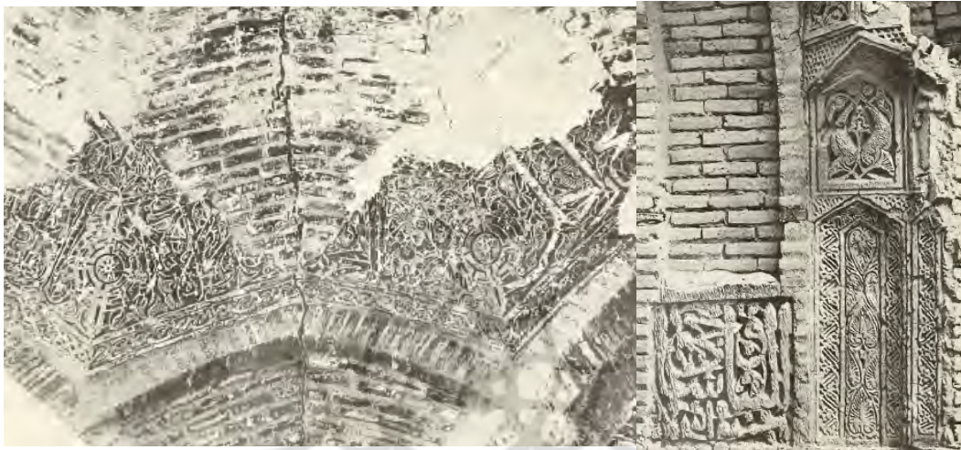
تصویر ۷: تزیینات گچ‌بری کاروانسرای معدوم‌شده سین (کیانی و کلایس، ۱۳۷۳: ۲۲).

تنها آرایه‌های معماری قابل ذکر این دوره، آرایه‌های معماری کاروانسرای معدوم‌شده سین است (ویلیبر، ۱۳۹۳: ۱۹۲). این آرایه‌ها در حال حاضر وجود خارجی نداشته و شامل مقرنس‌های گچی، قاب‌بندهای گچی، سطوح و کتیبه‌های گچ‌بری‌شده و رنگ‌آمیزی بر بستر گچی بوده است. با توجه