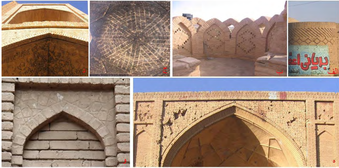
تصویر ۸: آرایه‌های آجری دوره صفوی (الف) کاروانسرای مورچه‌خورت (ب) کاروانسرای مادرشاه (ج) کاروانسرای شیخ‌علیخان (د) کاروانسرای شیخ‌علیخان (ه) کاروانسرای شیخ‌علیخان (و) مسجد گز.

مدرسه جعفرآباد و خانه‌ای در درمیان دیده می‌شود. این ابزاراندازی‌ها در مواردی در قالب اشکال گیاهی و هندسی (تصویر ۹ - الف) و در مواردی با دیوارنگاره همراه شده است (تصویر ۹ - ب). کتیبه‌های گچی از دیگر شیوه‌های آرایه‌های گچی است که تنها نمونه این دوره آن در ایوان جنوبی مسجد جامع گز دیده می‌شود. این کتیبه‌ها به خط کوفی بنایی و خط ثلث است (تصویر ۹ - ج).