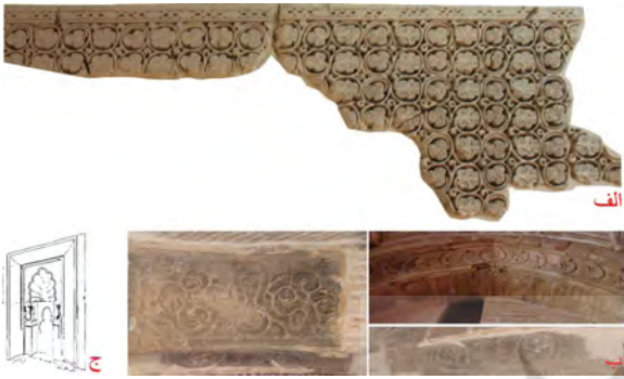
تصویر ۱: آرایه‌های معماری قرون سوم و چهارم هجری قمری، الف) آرایه‌های گچی بقعه امامزاده نرمی (نگارنده، ۱۳۹۳) ب) آرایه‌های گچی مسجد جامع گز (نگارنده، ۱۳۹۰) ج) طرح محراب مسجد جامع شاپورآباد (سیرو، ۱۳۵۷:۳۶۶).

بنا تهیه شده، محراب مسجد دارای تزیینات صدفی شکل و دونیم‌ستون گلدانی شکل بوده است (تصویر ۱-ج). سیرو این محراب گچی را با توجه به مقایسه‌های صورت گرفته به قرون دوم و سوم هـ ق نسبت داده است (سیرو، ۱۳۵۷:۳۶۶). از دیگر تزیینات این محراب، سنگ یشم سبزرنگی بود که در مرکز محراب قرار داشت و قبل از بازدید سیرو مفقود شده است. ۴