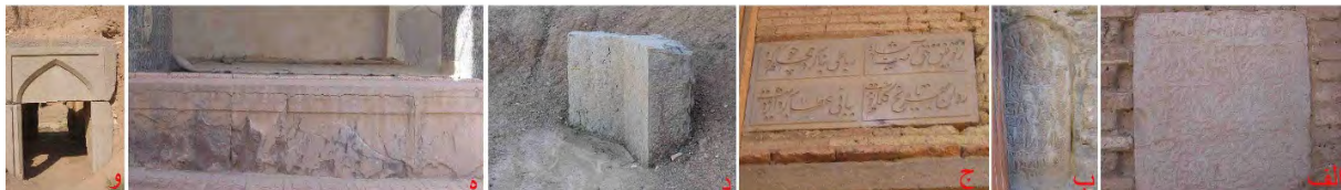
تصویر ۱۲: آرایه‌های سنگی (الف) کتیبه سنگی مسجد گز (ب) کتیبه سنگی مسجد گز (ج) کتیبه سنگی کاروانسرای شیخ علیخان (د) ازاره سنگی مدرسه جعفرآباد (ه) ازاره سنگی سردر مدرسه جعفرآباد.

تعبیه شده بر بدنه دیواره‌هاست که به خط نسخ و نستعلیق، وقفی بودن مسجد را معرفی کرده است (تصویر ۱۲ - الف و ب) و نمونه کاروانسرای شیخ علیخان به خط نستعلیق در قالب دو بیت شعر به ساخت بنا در عهد شاه سلیمان صفوی اشاره دارد (تصویر ۱۲ - ج). ازاره‌های سنگی ساده (تصویر ۱۲ - د)