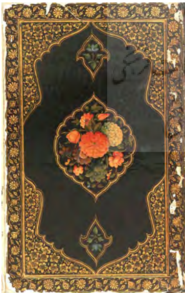
تصویر ۵: جلد قرآن، ازبکستان، مکتب بخارا (موزه فریر).

نقوش و تزیینات در قالب هنرهای اسلامی، فضایی قدسی