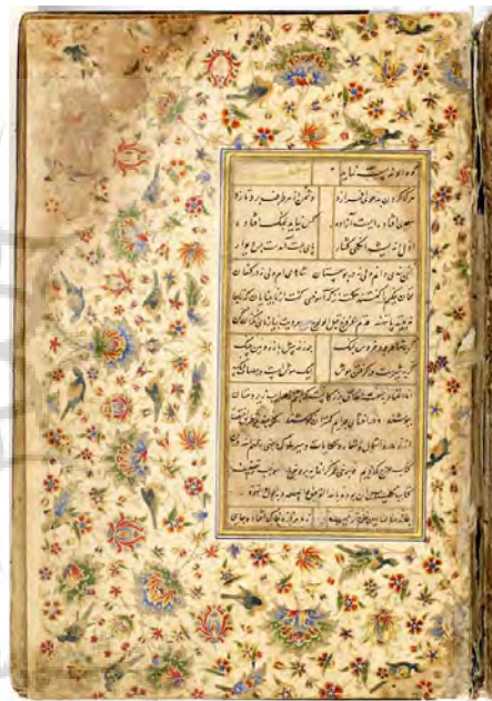
تصویر ۱: برگی از گلستان سعدی، دوره صفویه، جوهر، طلا، آبرنگ مات (موزه فریر).

از جمله پدر حکما را دارای چنین خصوصیتی توصیف می‌کند که از طریق ذوق در ظهورات و منازلات توسط موجود قدسی به آن‌ها الهام می‌شده است: (وَ قَدْ الْقَاهِ النَّافِثُ الْقَدْسِيُّ فِي رَوْعِي) (سهروردی، ۱۳۷۵: ۲۵۹)؛ بنابراین هنرمند با گام‌نهادن در عالم مشرق و دریافت الهاماتی که در اوج کمال و زیبایی قرار دارند، پا به عرصه شهود و اشراق می‌گذارد و با درک زیبایی‌ها در عالم ملکوت و نورانی، آن‌ها را در این عالم ملک به زبان رمز و آثار رمزی ترسیم می‌نماید که با عروج تخیل هنرمند از عالم مغرب و تعلقاتش به سوی عالم ملکوت، میسر شده و هنرش متعالی و مقدس شده است.