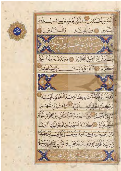
تصویر ۶: برگی از قرآن نورانی، همراه تذهیب، دوره صفویه، جوهر و طلا و آبرنگ روی کاغذ (موزه فریر).

و هنرمند مسلمان، تزیینات وابسته به قرآن را، شبیه صور معلق عالم خیال، فاقد ماده و خصایص وابسته به آن می‌داند؛ پس محیطی نامتجانس را به تصویر می‌کشد که هر سطح و مرحله‌ای حالت عاطفی خاص و رنگ‌بندی ویژه‌ای دارد. در تذهیب‌های قرآنی، زمان در معنای مادی، مفهوم ندارد و «چشم بدون اعتنا به قواعد پرسپکتیو از سطحی به سطح دیگر و از رنگی به رنگ دیگر در گذر است و تقارن، بیشتر از انسجام اشکال، وحدت ایجاد می‌کند، وحدتی که چشم را شکوفا و ذهن را سیال می‌سازد» (شایگان، ۱۳۵۵: ۸۱) (تصویر شماره ۶).