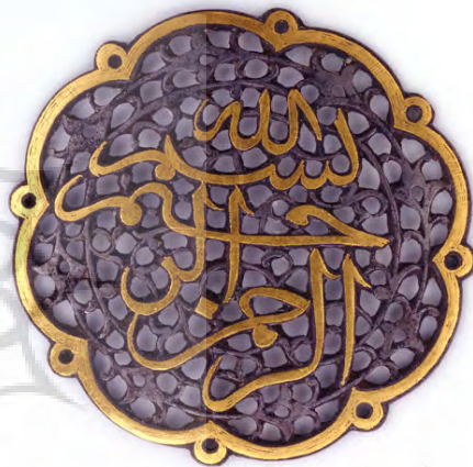
تصویر ۳: زینتی مدور، اواخر دوره صفویه، فولاد و طلا (موزه فریر).

آن‌چنان که از مبانی حکمی نور برمی‌آید نور فی نفسه غیر قابل تقسیم است و به واسطه تجزیه نور مادی به صورت رنگ‌ها نیز تغییری در آن حاصل نمی‌شود و به واسطه انتقال تدریجی، روشنی و تیرگی تقلیل نمی‌یابد و اشیاء نیز صرفاً تا آن حد از واقعیت برخوردارند که از نور بهره‌مندند و نور تنها نمادی است که بیانگر وحدت نور نامتناهی (نورالانوار) است؛ بدین جهت هنرمندان مسلمان تلاش می‌کنند تا هر ماده‌ای را به گونه‌ای تغییر شکل دهند تا به صورت تالو نور درآید و هنرشان را به جواهرهای قیمتی مبدل سازند تا به هدف خود که نشان دادن نور و تجلی ساختن جمال است، دست یابند (بورکهارت، ۱۳۶۵: ۸۸).