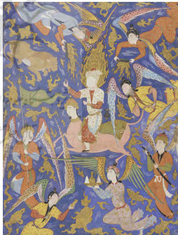
تصویر ۷: نگارگری، معراج پیامبر (ص)، سده ۱۰ هجری، دوره صفویه، جوهر و طلا و آبرنگ روی کاغذ (موزه فریر).

شیوه ترکیب‌بندی، وفور شکل‌ها و هماهنگی رنگ‌ها در اوج هنر تزیینی، همان صورت ازلی (آرکتیپ) یا باغ بهشت است و هر تصویری از بهشت، مثال روح است. نظم و ترتیب قاب‌های اسلیمی، اشکال هندسی، تکرار موزون رنگ‌ها، جایگاه برگ‌ها و نقش گل‌ها هر یک در جایگاه خویش ایجاد هم‌نوایی می‌کند و عمقی به مجموعه تزیین و هندسه مقدس می‌دهد که اندیشه ما را به شگفتی‌های مرموز و تخیل آیین‌وار این گل زار می‌اندازد.