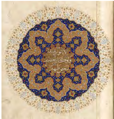
تصویر ۲: شمسه نورانی قرآن، دوره صفویه، رنگ و طلا روی کاغذ (موزه فریر).

بهترین جلوه قداست و پاکی، نمایش درخشندگی و تابناکی عناصر گیاهی است که به واسطه رنگ طلایی در هنرهای سنتی نمود یافته است و به تعالی معنوی انسانی اشاره دارد. در نگاره‌ها فضایی بی‌بعد ترسیم می‌شود و نورانیتی یکنواخت که نشان‌دهنده تجلی نور در تمام مراتب هستی است. نگاره‌هایی عمیق و عرفانی که با جستجوی آن‌ها به آیه و نشانه‌هایی از قرآن می‌رسیم (تصویر شماره ۲).