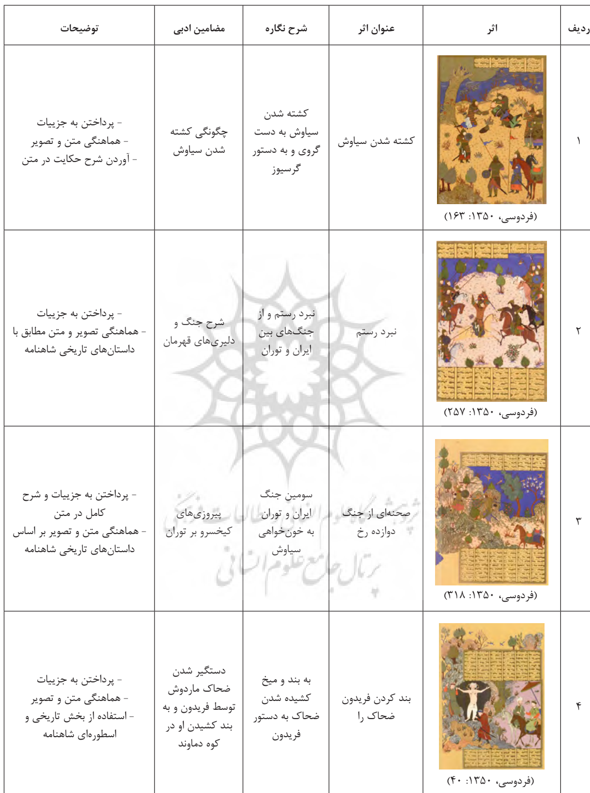
جدول ۱: نگاره‌های منتخب از نگارگری قدیم - شاهنامه بایسنقری (نگارندگان، ۱۳۹۷).