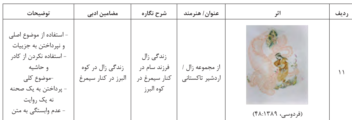
جدول ۲: مواجهه ادبیات حماسی و نگارگری معاصر (نگارندگان، ۱۳۹۷).

جنبش مشروطیت و پیامدهای اجتماعی و فرهنگی آن و موج تجدیدخواهی آن، ادبیات و نقاشی را تحت تأثیر خود قرار داد. در اوایل حکومت رضاشاه بخشی از برنامه نوسازی