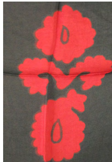
تصویر ۵: نقش ترکیبی درخت سرو و بته‌جقه در تزئین سربند گل‌ونی (مأخذ: نگارندگان).

تصویر ۷: الف: قاب مربعی کوچک سربند گل‌ونی (مأخذ: نگارندگان)