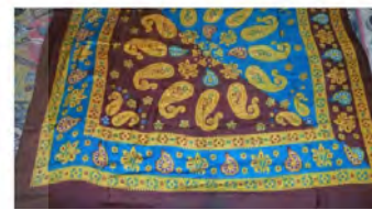
تصاویر ۱۰: سربند قوس قزق و ترکیب آن در مراسم عروسی با سربند گل‌ونی.