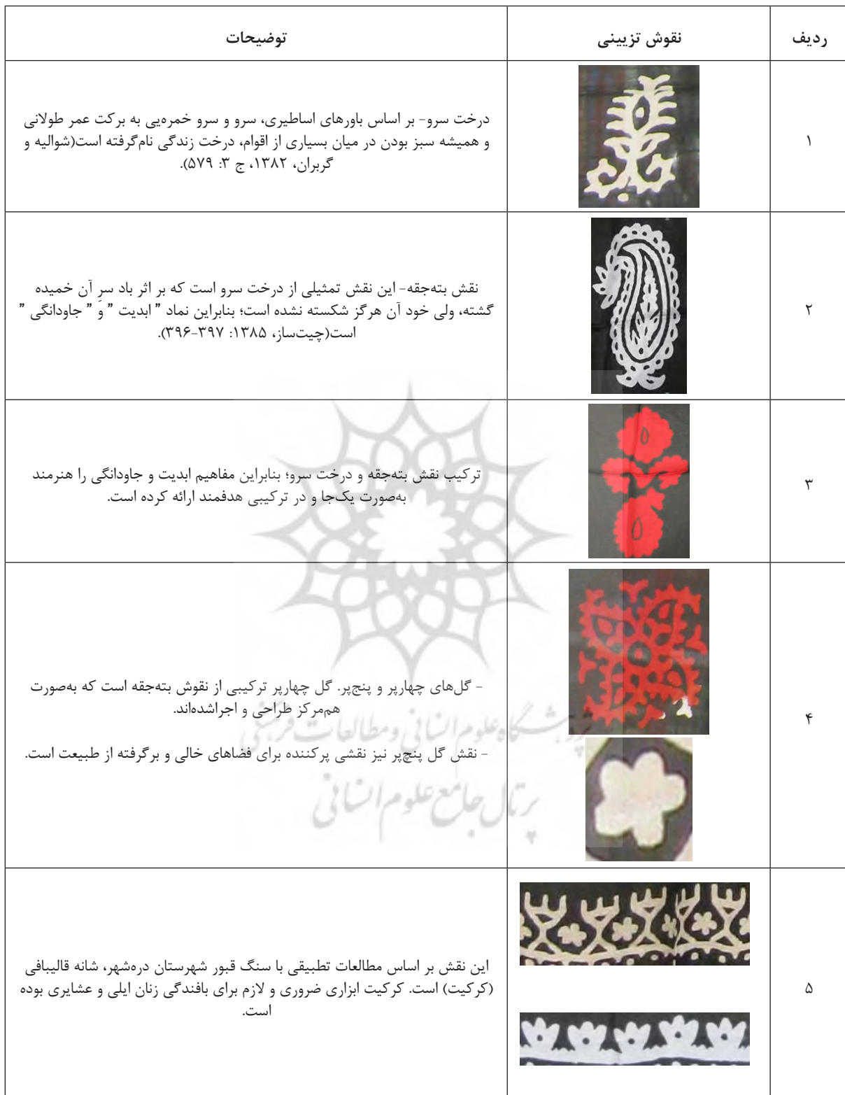
جدول ۱: نقوش تزئینی سربند گل‌ونی و معانی و مفاهیم نهفته در آن‌ها (مأخذ: نگارندگان).