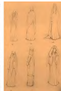
تصویر ۱۱: روش بستن سربند گل‌ونی الف تا و (پهلوانی، ۱۳۹۲). چپ: کاربرد گل‌ونی در کُتل کردن اسب در مراسم چمر (فرخی و کیایی، ۱۳۵۸: ۹۷).