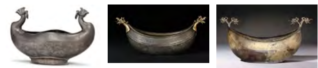
تصویر ۸: کشکول‌های یک و دو سر اژدها مربوط به دوره صفوی (www.it.pinterest.com، christies.com، موزه ویکتوریا و آلبرت لندن)