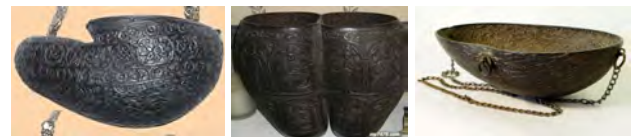
تصویر ۷: راست: کشکول رو باز به شکل پیاله (pinterest.com). www.it.com)، وسط: کشکول استوانه‌ای با نقش بودا (bersom.shopfa.com). چپ: کشکول چکمه‌ای شکل (www.nojavanha.com)