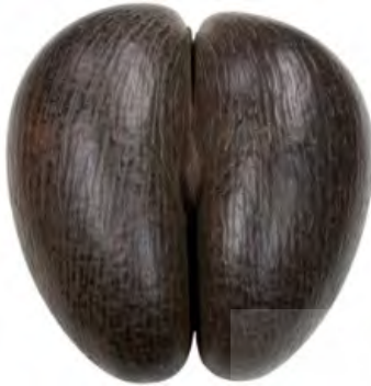
تصویر ۵: نمونه‌هایی از میوه کوکو