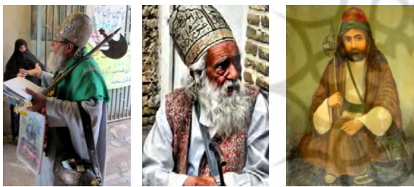
تصویر ۲: درویشان با لباس خاص (خرقه و تاج پشمی)، تبریز و کشکول (www.shahroodnews.ir)

تصویر نورعلیشاه به‌همراه کشول و تبریزین؛ نمودی از دراویش و صوفیان در قالی‌بافی دوران قاجار قالی‌های نورعلیشاهی، نوع مهمی از قالی‌های دوران قاجار است که منقش به تصویر دراویش و صوفیان و به‌طور خاص برجسته شخصیت نورعلیشاه از مشایخ بزرگ فرقه نعمت‌اللهی است. در زمینه این قالی‌ها، نورعلیشاه درویش و صوفی با لباس و کلاه، تبریزین و کشکول نقش‌پردازی شده‌است. متن و زمینه این نوع از قالی‌ها «نه تنها از تأثیر مضامین مختلفی هم‌چون ادبی و داستانی دور نمانده؛ بلکه مضامین مذهبی و صوفی‌گری را نیز بازتاب داده‌است. قالی‌هایی که شخصیت‌های معنوی و دراویش را نشان می‌دهند» (آهنی، ۱۳۹۵: ۱۱۹)، این نوع قالی‌ها بخشی از قالی‌های تصویری دوران قاجار است که «به تصاویر