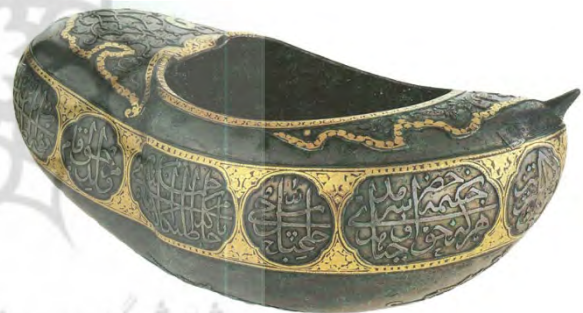
تصویر ۱۱: کَشکول.

در بالای کَشکول و بخش جلو و عقب (عرشه کشتی) نقش‌هایی از پیچک‌های اسلیمی و شکل‌های گیاهی در زمینه‌ای حکاکی شده، نقش‌پردازی شده‌است. هم‌چنین دهانه کَشکول،