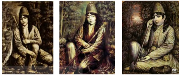
تصویر ۳: شخصیت نورعلیشاه به‌همراه تبرزین و کَشکول (www.kelke khial.com)

دراویش و وسایل آیینی دراویش مزین شده است» (همان). در اغلب قالیچه‌های نورعلیشاهی، اشعاری که درباره او سروده شده در حاشیه قالیچه‌ها بافته شده است. در این نوع قالیچه‌ها کوشش بافنده را برای نشان دادن زیبایی‌های صوری این درویش می‌توان دید (عباسی‌فرد، ۱۳۸۸: ۳۷). نمونه‌هایی از این نوع قالی‌ها که در آن‌ها کَشکول درویشی بازتاب داده شده است، در شکل‌های زیر دیده می‌شود.