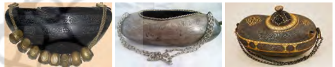
تصویر ۶: انواع کشکول‌ها از نظر جنس بالا، راست، برنجی، وسط، مسی، موزه ویکتوریا و آلبرت لندن

یا دو اژدها ختم می‌شود که این ویژگی «در اصل از چین اقتباس شده‌است ولی سابقه طولانی در نگارگری و فلزکاری ایران دارد» (ولش، ۱۳۸۵: ۷۰). این کشکول‌ها از دوران صفوی رایج گشت. «در دوره صفوی طراحی سر اژدها به‌عنوان بخش تزیینی در دو طرف بسیاری از کشکول‌ها کاربرد داشته است. در دوران اسلامی و در روایت‌های عارفانه گاهی اژدها تمثیل و تصویری از زشتی‌ها یا موجودات دوزخی و نمایان‌گر عذاب گناهکاران است و زمانی نیز نمودار کرامات بزرگان صوفیه محسوب می‌شد» (اعظم‌زاده، ۱۳۹۴: ۷۶) (تصویر ۸). اژدها در کشکول‌های صفوی و قاجاری از نوع شاخ‌دار هلالی‌گون است. «یکی از ویژگی‌های اژدها در کشکول‌ها، شاخ‌دار بودن آن‌هاست. در فرهنگ و ادبیات ایران بسیار به اژدها و نوع شاخ‌دار آن اشاره شده‌است. شاخ، خود نمادی از هلال ماه است و حرکت ماه که سبب جزر و مد آب‌هاست. از این‌رو این حیوان در فرهنگ‌های مختلف همواره با آب ارتباط دارد. در بسیاری موارد اژدها و مار شاخ‌دار به‌عنوان نماد آب به‌جای یکدیگر به کار رفته‌اند» (گرترو، ۱۳۸۰: ۱۲۰).