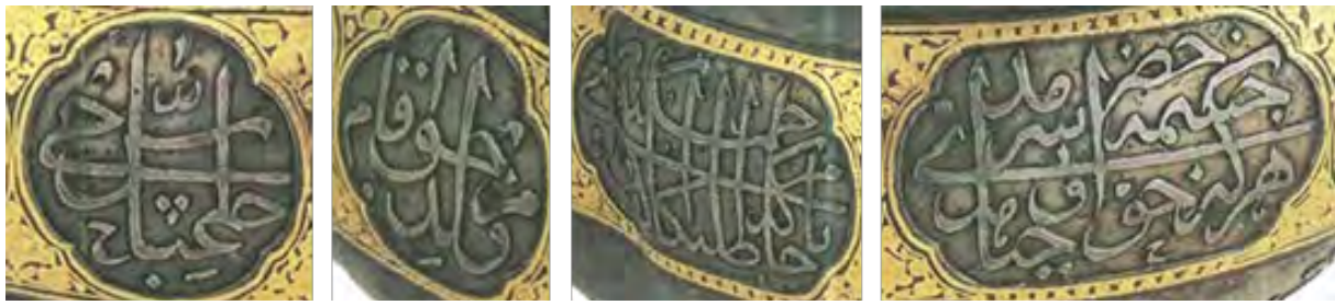
تصویر ۱۳: خطنگاره‌ها - اشعار و عبارات رقم(امضاء) در ترنج‌های بیضی و دایره‌ای گون(آلن، ۱۳۶۰: ۱۱۵).