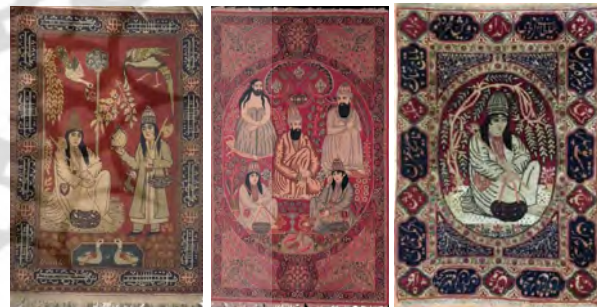
تصویر ۴: نمونه‌هایی از قالی‌های نورعلیشاهی و بازتاب کَشکول در زمینه آن‌ها (piclick.com, it.pinterest.com)