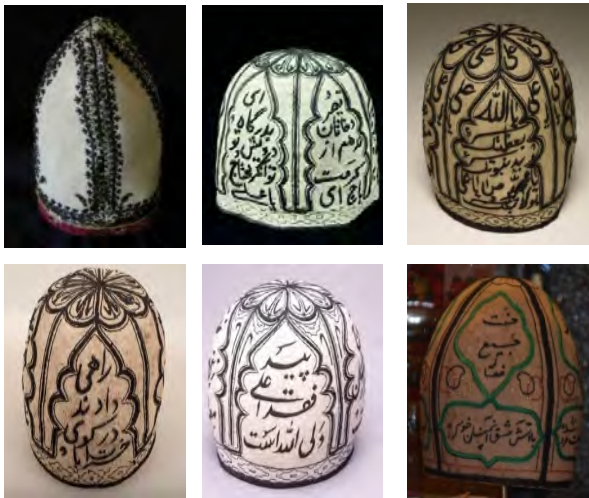
تصویر ۱: نمونه‌هایی از تاج (کلاه) درویشان یا صوفیان (موزه هنرهای زیبای سان‌فرانسیسکو)

که بعضاً مزین به نام و عبارت مذهب تشیع می‌باشد.