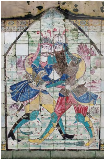
تصویر ۷: اصل اثر کاشی‌کاری در حمام ابراهیم‌خان (فخری‌زاده، ۱۳۸۸).

کاشی‌نگاره هفتم نقشی است از نبرد رستم و سهراب؛ واقع در سمت چپ گرمخانه حمام ابراهیم‌خان. اصل اثر در ابعاد ۱۴۴ در ۱۹۸ سانتیمتر منسوب به استاد حیدر کاشی‌کار، در