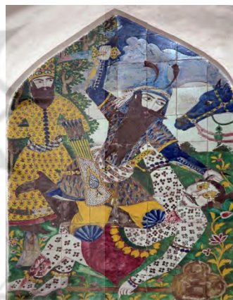
تصویر ۵: اصل اثر کاشی‌کاری در حمام ابراهیم‌خان (فخری‌زاده، ۱۳۸۸)

نمونه پنجم نقشی است از کاشی‌کاری واقع در حمام ابراهیم‌خان که در سال ۱۲۴۰ (ه.ق) به اتمام رسیده‌است. اثر اصلی در ابعاد ۱۴۴ در ۱۹۸ سانتیمتر در رختکن حمام کار شده‌است. این تابلو بدون رقم است و آن را منسوب به استاد موسیقی کرمانی می‌دانند. بعد از ورود به رختکن حمام، در بالای درب ورودی، طرح کاشی‌کاری شده جنگ رستم و دیو به چشم می‌خورد. در واقع می‌توان مفهوم این تابلو را به از بین بردن پلیدی‌ها و بدی‌ها تشبیه کرد، در تابلو مذکور علاوه بر رستم و دیو، انسان دیگری هم هست؛ کیکاووس که