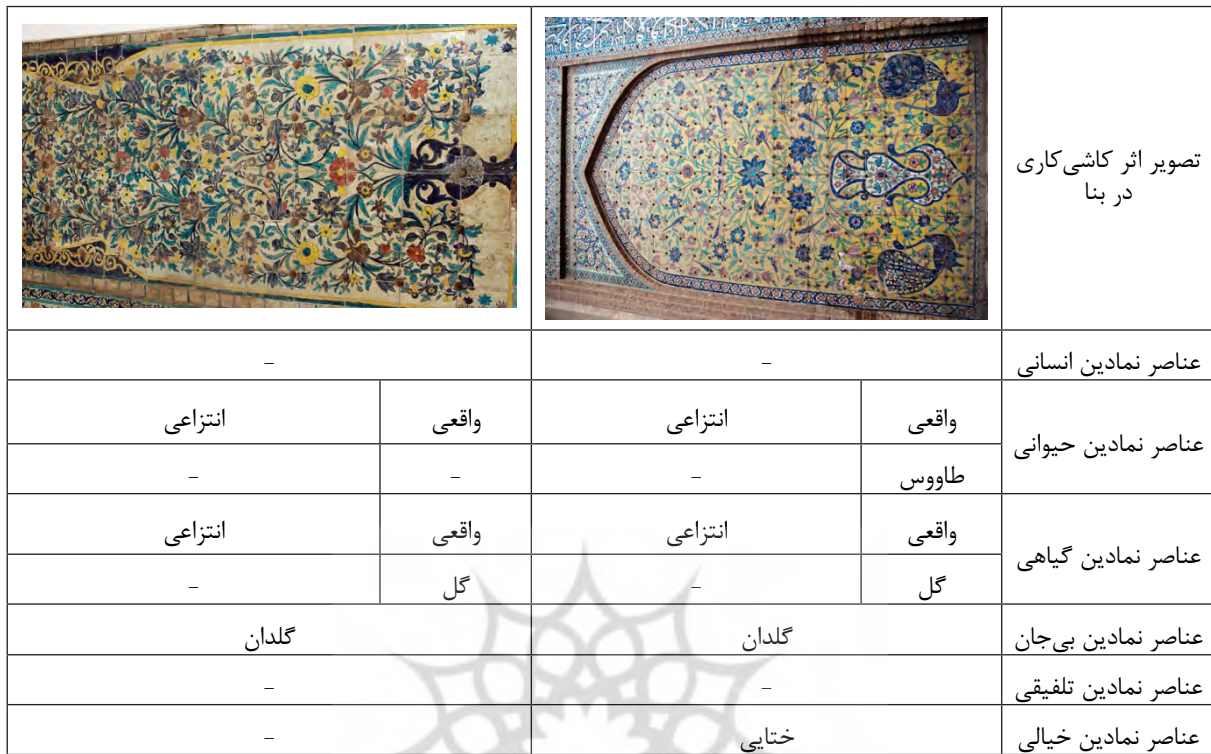
جدول ۲: بررسی عناصر نمادین کاشی کاری حمام ابراهیم خان ظهیرالدوله، (مأخذ: نگارندگان).

۱-۲: بررسی عناصر نمادین کاشی کاری حمام ابراهیم خان ظهیرالدوله قسمت اول