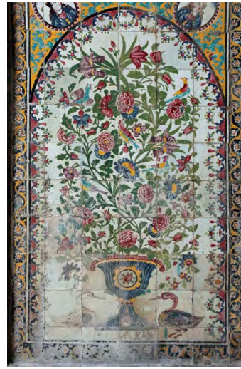
تصویر ۶: اصل اثر کاشی‌کاری در حمام ابراهیم‌خان (فخری‌زاده، ۱۳۸۸).

در نهایت می‌توان گفت، نقاشی گل و مرغ به‌عنوان شیوه‌ای مستقل و منحصر به دوره قاجار، گونه‌ای جدید از نگارگری گل‌ها و گیاهان را تعریف می‌کند. نقوش گیاهی در سایه طبیعت‌گرایی و طبیعت‌نگاری که در آن دوران رواج بسیار داشت و نیز با ورود گل‌فرنگ متحول شدند؛ و گاهی اسلیمی‌ها و ختایی‌ها جای خود را به نقوش گیاهی ساده‌تر (گل‌های چندپر) و واقع‌گرایانه (گل رز، میخک و زنبق و آفاقیا) دادند. نقوش گل و مرغ در دوره‌های پیشین هنرهای اسلامی نیز رایج بود اما این نحوه جدید از ترسیم گل‌ها و گیاهان، در هنر قاجار متداول شد که منشأ آن را در نقوش کاشی‌ها و نگاره‌ها به‌خوبی می‌توان مشاهده کرد.