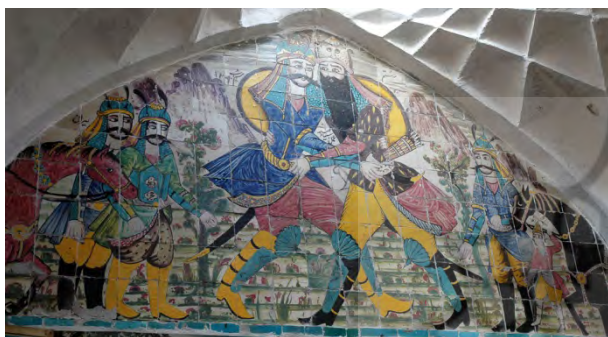
تصویر ۸: اصل اثر کاشی‌کاری در حمام میرزا اسماعیل وزیر (فخری‌زاده، ۱۳۸۸).

این نمونه هم کاشی‌کاری نبرد رستم و سهراب واقع در رختکن حمام میرزا اسماعیل وزیر، در ضلع شرقی میدان آرگ کرمان است. اثر اصلی کاشی‌کاری به ابعاد ۱۸۰ × ۳۵۰ سانتیمتر منسوب به استاد حیدر است که تاریخ اتمام آن ۱۲۶۱ (هـ.ق) است. در این تابلو علاوه بر تصاویر رستم و سهراب تصویر همراهان آن‌ها چون میران، حجر، ریکا و احتمالاً گیو و دو اسب، کشیده شده‌است، رنگ غالب تابلو زرد است؛ رنگی که در نقوش قاجار بسیار استفاده شده‌است؛ و رنگ‌های سبز، قرمز، فیروزه‌ای و لاجوردی و قهوه‌ای نیز در نقوش انسانی و حیوانی و هم‌چنین دیگر نقش‌ها به‌کاررفته است. مهم‌ترین نماد در این نقش همان نماد خیر و شر است که شرح آن در نمونه پیشین (کاشی‌نگاره هفتم) بیان شد؛ اما آنچه این نقش را مهم می‌نماید نحوه تصویرگری خاص آن است. تصویرگری در این تابلو به‌خصوص در اندازه و مقیاس انسان‌ها بیانگر شاخصه‌های ژرف نمایی مقامی ۱ در سبک تصویرگری آن زمان است. افراد با توجه به جایگاهی که داشتند، کوچک‌تر یا