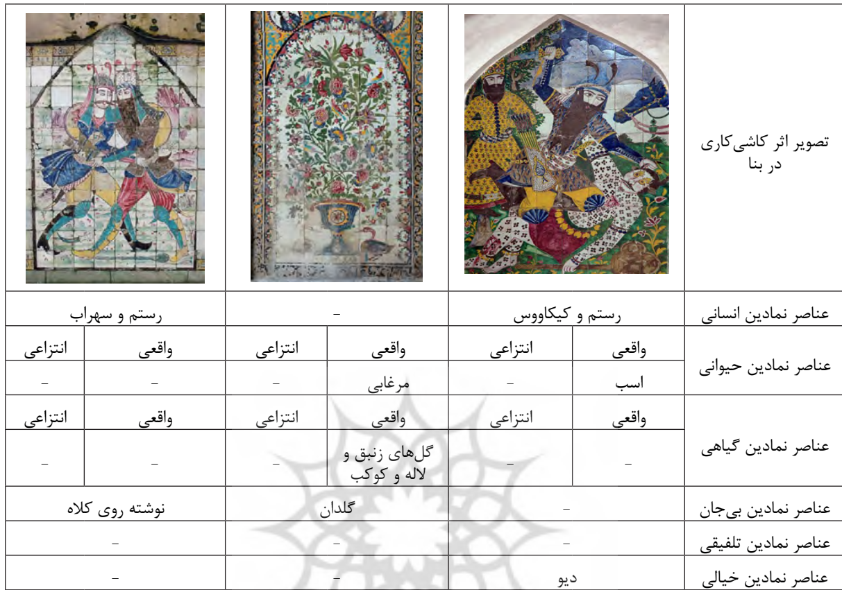
جدول ۳: بررسی عناصر نمادین در کاشی کاری سایر بناهای مورد مطالعه این پژوهش.