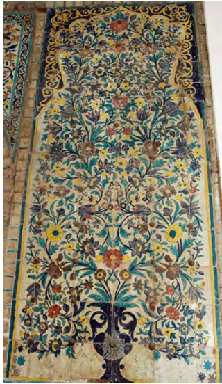
تصویر ۴: اصل اثر کاشی کاری در مدرسه ابراهیم خان ظهیرالدوله (فخری زاده، ۱۳۸۸).

اثر چهارم کاشی کاری با ابعاد ۹۰ در ۲۰۵ سانتیمتر، واقع در مدرسه ابراهیم خان ظهیرالدوله است. تاریخ اتمام نقاشی کاشی، سال ۱۲۳۲ (هـ.ق) است. «در دوره قاجار نقش مایه های گلدانی با محوریت عناصر طبیعت گرایانه ای چون انواع میوه ها، گل ها، یا حیوانات و پرندگان، ترکیب اصلی است (مکی نژاد، ۱۳۸۷: ۵۱). طرح های گلدانی در دوره صفوی به شکل ساده وجود داشته و تزیینات اندکی از نقش مایه های گیاهی در آن نقش بسته است؛ اما در دوره قاجار، گرایش هنرمندان کاملاً طبیعت گرایانه بود و با تأثیرپذیری از غرب و طبیعت، کاشی های گلدانی با جزئیات و ریزه کاری های بیش تر در تزیینات به کار برده می شد. در این دوره با الهام از نقوش غربی، نقش گلدان با نگاهی کاملاً طبیعت گرایانه اجرا شده است». با نگرشی دقیق تر، معلوم می شود که نقش مایه هایی به صورت کوزه هایی پر از گل سرخ و زنبق، یا منظره های طبیعی، اقتباس شده از کارت های پستی تازه وارد از اروپا و گاه جایگزین، درون قابی بیضی شکل از شاخ و برگ زرد رنگ، همه مضامین تصویری بی سابقه ای در کاشی کاری بوده اند» (فریه، ۱۳۷۴: ۲۹۱). نقوشی هم چون درخت و بوته های پر گل، نشانگر سیر صعودی انسان است. برای مسلمانان، درخت