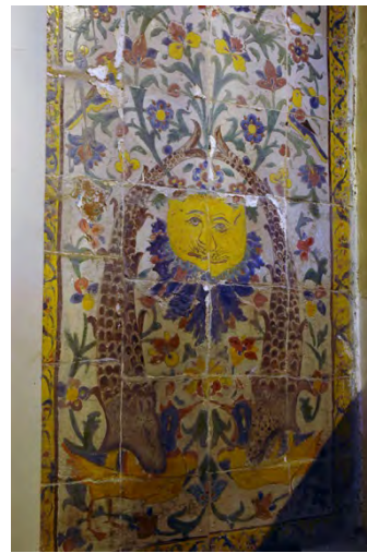
تصویر ۱۰: اصل اثر کاشی کاری در حمام وکیل (فخری زاده، ۱۳۸۸).

دور از ذهن نیست. از نگاهی دیگر، می توان گرفت و گیر ماهی و مرغابی را جدال عرفان و معرفت حقیقی، در مقابل عرفان ظاهری (که مرغابی نماد آن است)، دانست، یا به تعبیر دیگر، غلبه طهارت باطن بر طهارت ظاهری، در پرتو عرفان شیعی و علوی (که شیر نماد شیعی آن است)، دید. همه این نمادها در زمینه ای تصویر شده اند که با وجود درخت بهشتی یا به تعبیری درخت طوبی، نمادی از بهشت را می نمایانند. شیری که در میانه اثر نقش شده است بنا به روایاتی برگرفته از تصویرهای شیر و خورشید است که در زمان قاجاریه به وفور در هنر استفاده می شده است. شیر به ویژه از زمان صفویه به بعد و علی الخصوص در دوره قاجار، نماد شیعه هم هست. در یک سکه طلای بیست تومانی مربوط به دوره محمدشاه قاجار که در سال ۱۲۱۰ هجری شمسی در تهران ضرب شده است، روی نقش خورشید کلمه «یا محمد» و روی نقش شیر کلمه «یا علی» نوشته شده است.