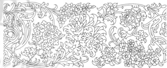
تصویر ۴: یک بند ختایی، (ماچیانی، ۱۳۸۰:۲۰۳).

ختایی‌ها دارای انواع بسیاری بوده که از ترکیب گل‌ها و برگ‌ها براساس سبک و سیاق ایرانی ساخته می‌شود. این طرح ظاهراً با ورود مغولان از چین به ایران آمده‌است. طراحان برای ایجاد هماهنگی در یک نقشه ختایی از میان هزاران نوع گل و برگ و غنچه ختایی، معمولاً دو تا شش نوع گل، دو یا سه نوع غنچه و سه یا چهار نوع برگ انتخاب می‌کنند و به سلیقه خود آن‌ها را با هم می‌آمیزند. اساس نقش ختایی عبارت است از خطوط منحنی و موزونی که هریک از آن‌ها «بند» نامیده می‌شوند و مجموع این بندها مانند استخوان‌بندی، سرتاسر نقشه را فرا می‌گیرد (ماچیانی، ۱۳۸۰:۲۲). همین‌طور ختایی‌ها گروه دیگری از نقوش گردان است که با استفاده و الهام از طبیعت ترسیم می‌شوند و بر همان مبنای چرخش حلزونی شکل گرفته و در قالب یک کادر قرار می‌گیرند. ختایی‌ها دارای ظرافت و تزیینات بیشتری نسبت به اسلیمی‌ها هستند، پایه گیاهی دارند، پرکننده فضاهای فرعی هستند و به مراتب بیشتر از اسلیمی‌ها حضور دارند و به دلیل گستردگی و ظرافت و تزیینات گوناگون به‌عنوان نماد زنانگی مشهورند (رایس، ۱۳۸۶:۱۱۴).