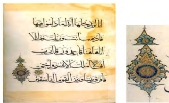
تصویر ۱۱: نقش درخت سرو در گوشه قرآن سده ۷ هـ، (خلیلی، ۱۳۸۰: ۱۰۵).