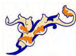
تصویر ۱: انواع اسلیمی‌ها، (ماچیانی، ۱۳۸۵: ۲۸۱).