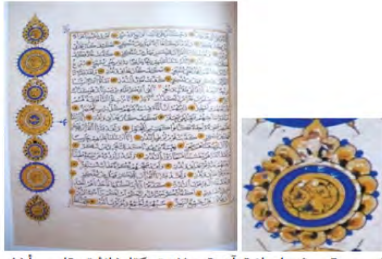
تصویر ۱۰: نقش گل اناری در گوشه قرآن سده ۸ هـ، (خلیلی، ۱۳۸۰: ۱۱۱).