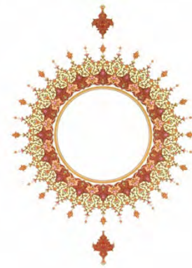
تصویر ۹: طرح شمسه با نقش گل شاهعباسی و گل‌های ختایی، (ماچیان، ۱۳۸۰: ۲۸۸).

از ترکیب بندهای اسلیمی و ختایی که همه هنرهای سنتی از صدر اسلام تا کنون را فرا گرفته است دو رشته هنری مجزا یعنی تذهیب و تشعیر که بیشتر در قالب خوشنویسی و ختایی بودند به وجود آمدند (هزاوه‌ای، ۱۳۶۳: ۶). تذهیب برگرفته از ذهب به معنای طلاکاری است که در آن نقوش گیاهی اسلیمی‌ها و ختایی‌ها به کار گرفته شد و برای تزیین آیات قرآن و اشعار مورد استفاده قرار گرفت. اما در تشعیر علاوه بر نقوش گردان، نقوش حیوانی نیز وارد شد، از جمله: آهو، اسب، خرگوش و انواع پرندگان که از آن صرفاً برای آرایش اشعار استفاده شد. علاوه بر نقوش اسلیمی و ختایی نقش درختانی چون سرو، انار، درخت زندگی، گل چند پر و نیلوفر آبی در هنرهای اسلامی دیده می‌شود که به صورت طرح انتزاعی از درخت یا گل‌های مذکور در حاشیه‌های تذهیب قرآنی نمود پیدا کرده است (تصویر ۹). هم‌چنین انواع نقوش گیاهی اسلیمی‌ها، ختایی‌ها، بته، لوتوس، انار، هوم، درخت زندگی و سرو کاربرد زیادی در آثار هنری دارند و امروزه در هنرهای سنتی ایران بیشترین نقوش به کار رفته مربوط به آن‌ها می‌باشند که در ذیل به صورت جدول آورده شده است (جدول ۱).