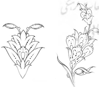
تصویر ۸: نمونه غنچه و شکوفه ختایی، (ماچیانی، ۱۳۸۰:۲۲۸).

۵- شعله: همان برگ‌ها به‌صورت شعله‌وار است.