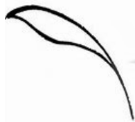
تصویر ۷: نمونه برگ ختایی، (مأخذ: نگارندگان).

۳- برگ‌های ختایی: شامل برگ کنگری (اوج نفوذ هنر هخامنشی و ساسانی) و برگ‌های شعله‌ای و آتشی که بعد از گل‌ها، پر کاربردترین نگاره‌ای ختایی هستند.