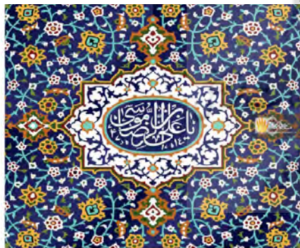
تصویر ۲: نمونه‌ای از کاشی کاری حرم امام‌رضا (ع) با طرح‌های اسلیمی و ختایی، (مأخذ: نگارندگان).

اسلیمی یکی از اجزای مهم طرح‌های استیل ایرانی است، مرکب از خطوط منحنی مارپیچ که در زمینه کاشیکاری، گچبری و نقاشی مورد استفاده بوده‌است که با رنگ‌های متمایز طرح می‌شود و شاخه‌های کوتاه و برگ و گل از ساقه‌های مارپیچی آن منشعب می‌گردد. نقش اسلیمی از خط کوفی استخراج شده‌است و لفظ اسلیمی را شکل شکسته لفظ اسلامی می‌دانند در مقابل طرح ختایی است که با مغول از چین به ایران آمده‌است، اما حقیقت این است که طرح‌های مذکور از ابتکارات هنرمندان عصر اشکانی و ساسانی می‌باشد و اقتباسی است از پیچ و تاب‌های درخت مو که نمونه بارز آن را می‌توان در آثار سیمین ساسانی مشاهده نمود. مایه اسلیمی کم‌کم بسط یافته و از آن اشکال گوناگونی ساخته است. امروزه بیش از پنجاه شکل اسلیمی وجود دارد (ماچیانی، ۱۳۸۰: ۹۹).