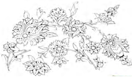
تصویر ۶: بند ختایی، (ماچیانی، ۱۳۸۰:۱۰۸).

۲- بند ختایی: همان ساقه است با قوس حلزونی اسلیمی.