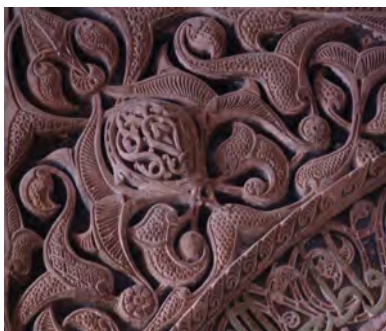
تصویر ۳: گچ بری با نقوش اسلیمی، محراب الجایتو، (رایس، ۱۳۸۶: ۱۷).