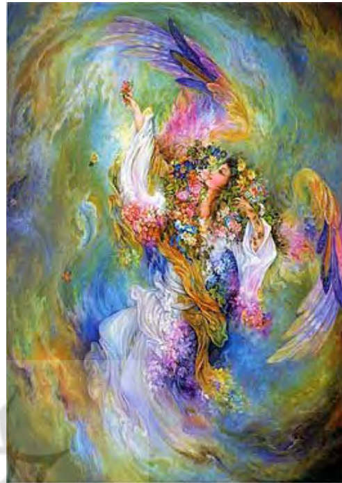
تصویر ۵: برای ساکنان زمین. محمود فرشچیان. موزه فرشچیان. کاخ سعدآباد. تهران.

تشکیل شده‌است. این امر اندکی از مقام متعالی فرشته تنزل داده است، اما به شکوه آن نیز افزوده است. نوع پرها در بال‌ها لطیف و پرها استخوانی و کشیده‌است. حالات فرشتگان در بیشتر نگاره‌ها، تمثیلی و نمادین است و برای درک انسان‌ها از صورت فرشتگان مجسم شده‌است، کما اینکه وجود بال بر پیکر فرشته نیز نماد توانایی پرواز است.