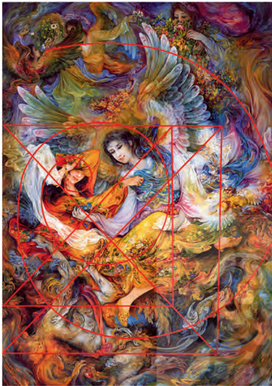
تصویر ۴: رهایی. محمود فرشچیان. موزه فرشچیان. کاخ سعدآباد. تهران.

نگارگر، این عناصر متنوع را با وحدت وجودیشان در تصویر ارائه می‌نماید و بدین ترتیب به اهداف معنوی خود در تصویر می‌رسد. (تصویر ۴)