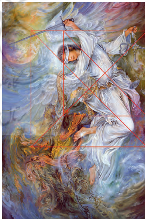
تصویر ۲: عدالت. محمود فرشچیان. موزه فرشچیان. کاخ سعدآباد، تهران (ماخذ: نگارندگان).