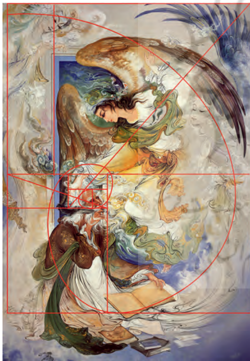
تصویر ۳: الهام از الهه شعر. محمود فرشچیان. موزه فرشچیان. کاخ سعدآباد، تهران

در این گونه آثار، هنرمند سعی در به تصویر کشیدن افکار شاعر یا نویسنده دارد و در این میان عناصری مانند بیتی از یک شعر، یا اشیایی مانند کتاب و قلم شاعر را به صورتی ترکیبی مورد استفاده قرار می‌دهد و یا به طور غیرمستقیم فرم و محتوای غالب اثر برگرفته از مضمونی ادبی از شخصیت شاعر و یا دنیای الهامات او بوده‌است. البته این تأثیرات ابزاری است در خدمت هنرمند و او اثرش را با بیانی خلاقانه و پرهیز از هرگونه تصویرپردازی صرف ارائه کرده‌است. تمثیل از ارکان مهم ادبیات است، زیرا بستر مناسب برای روایت‌های متفاوت و در کنار هم قرار دادن اندیشه‌های متضاد را فراهم می‌آورد. ضمن این که در تمثیل این توانایی نهفته است که می‌تواند موضوع و اندیشه‌ای دشوار را نازل و همه فهم کند و مفهوم آن را در دسترس عموم قرار دهد. (تصویر ۳)