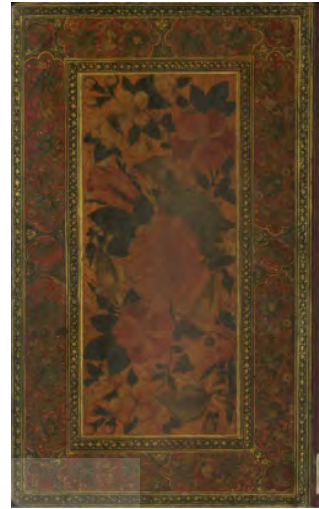
تصویر ۱: جلد نسخه خطی با نقاشی گل و مرغ (زبده المنتخبین)

رونق بسیاری داشت و بیشتر جلدهای این دوران با تکنیک نقاشی لاک‌ی یا روغنی هستند (تصویر شماره ۱ و ۲).