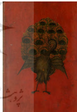
تصویر ۲: داخل جلد نسخه خطی با نقش طاووس (زبده المنتخبین)