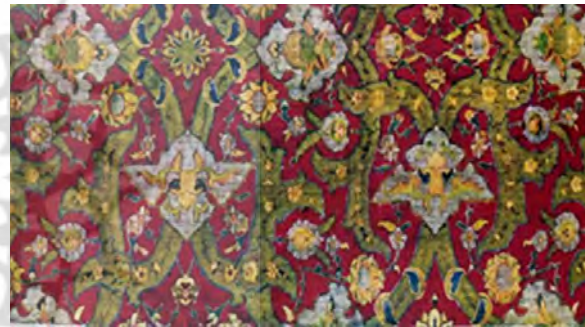
تصویر ۱: فرش پاره اسلیمی. مجموعه لرد ابری کانوی، ثلث اول سده یازدهم هجری (پوپ و اکرم، ۱۳۸۷: ۱۲۵۲).

هنر به سرعت رو به پیشرفت رنگرزی برای فرش بافان دامنه وسیعی از طیف‌های رنگی مطبوع فراهم کرده‌بود، به حدی که این فراوانی بی‌اندازه باعث شده‌بود که توجه به این همه امکانات مانع توجه به اهمیت طرح و نقشه شود و آمیزهای خیره کننده از رنگ‌ها را پدید آورد که در طرح‌های مبتنی بر معماری فرش به اندازه کافی جایی نداشت. در نتیجه گاهی طراحان خود را تسلیم امکاناتی می‌کردند که از راه رنگ جلوه هیجان‌انگیزی به فرش می‌توان داد (پوپ و اکرم، ۱۳۸۷: ۲۷۴۶). تنوع و پیشرفت هنر رنگرزی در عصر صفویه به خوبی در تصویر شماره (۱) قابل مشاهده است.