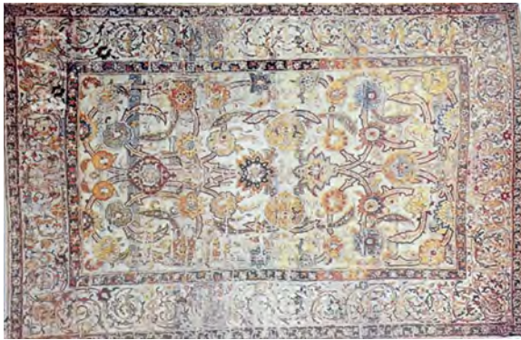
تصویر ۴: قالی افشان ختایی. موزه رزنبرگ، اوایل سده یازدهم هجری (پوپ واکرمن، ۱۳۸۷: ۱۲۴۴).