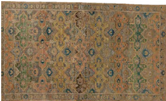
تصویر ۵: قالی واگیرهای قابی. موزه مترو پولیتن، اوایل قرن یازدهم هجری.

در این گروه شاهد دو نوع طرح هستیم. تعدادی از آن‌ها واگیرهای با ابعاد کوچک به شکل مربع یا مستطیل طراحی شده که با تکرار انعکاسی زمینه فرش پوشانده شده‌است و تعدادی دیگر متشکل از قاب‌هایی است که با تکرار آن‌ها، عنصر ثانوی پدید آمده است. طرح واگیرهای در نمونه پیش رو مبین توضیحات فوق می‌باشد. در این قالی با تکرار یک واگیره در عرض و انتقال آن در ردیف بالا نقشه زمینه شکل گرفته‌است؛ به طوری‌که مرکز واگیره در امتداد نقطه اتصال قاب‌ها در ردیف پیشین باشد و به همین صورت واگیره تکرار شده و بدین‌گونه فضای منفی نیز دارای هویتی مجزا می‌شود. حاشیه فرش‌های این مجموعه باریک‌تر از حد معمول و شامل یک حاشیه اصلی و دو لور در اطراف آن است (تصویر ۵). قالی‌های پولونزی در گروه واگیرهای تعداد کمتری به خود اختصاص داده‌اند به طوری که تنها ۷ تخته فرش در این گروه جای می‌گیرد.