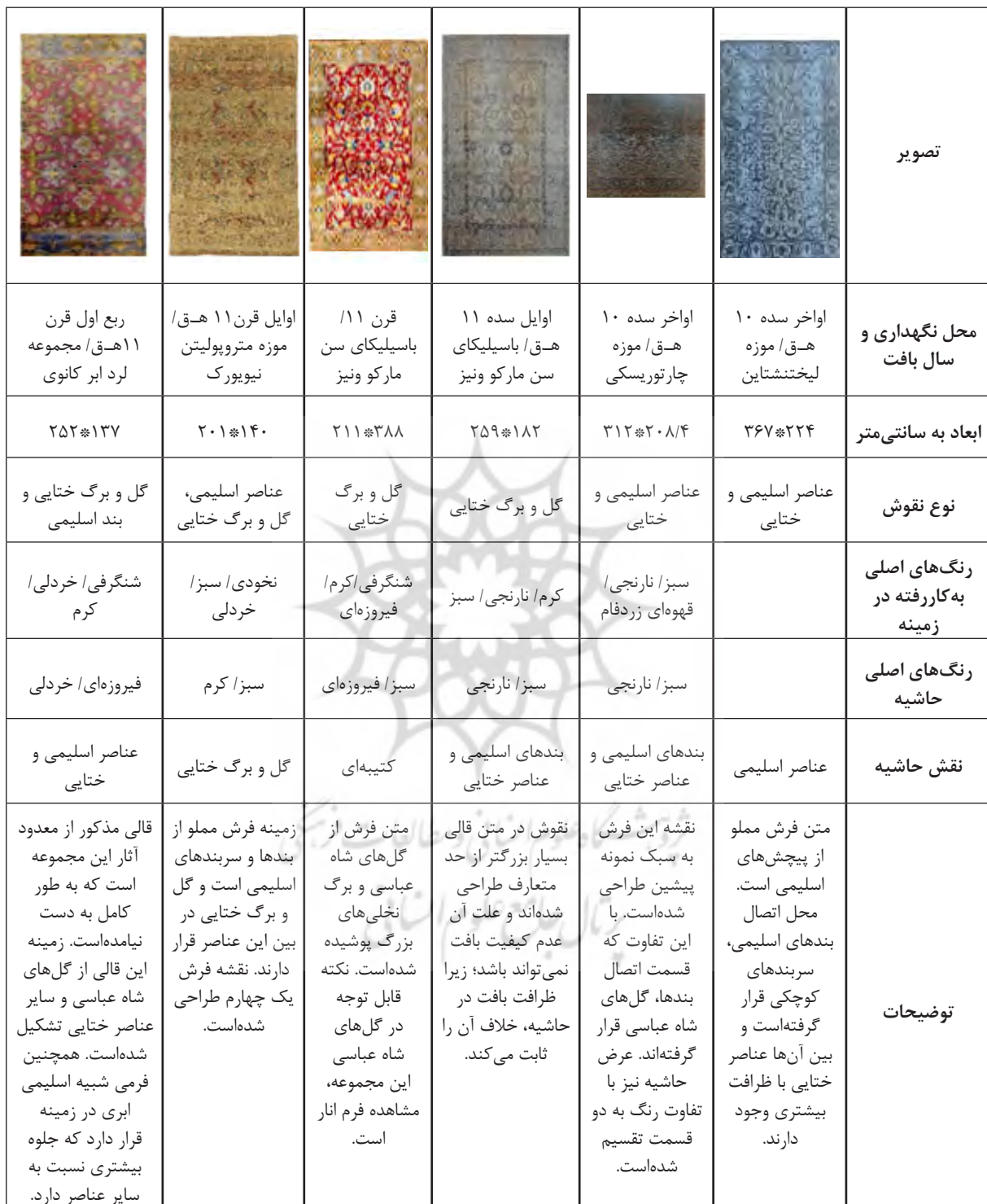
جدول ۴: بررسی قالی‌های افشان پولونزی (ماخذ: نگارندگان)