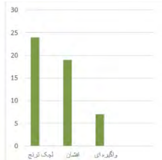
نمودار ۱: فراوانی نقشه در قالی‌های پولونزی

کوچک پارچه و یا قالیچه بوده‌است و نمونه‌های بیش از ۱۲ متر به ندرت تولید شده‌است، که شاید علت اصلی این امر، تهیه فرش‌های کوچک به منظور پیش‌کشی و هدیه و یا صادرات بوده‌است.