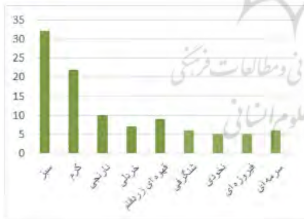
نمودار ۴: فراوانی رنگ در حاشیه قالی‌های پولونزی (ماخذ: نگارندگان)

تحلیل جدول مستخرج از فرش‌های پولونزی، نشان از فراوانی بیشتر طرح‌های لچک ترنج نسبت به سایر طرح‌ها دارد. هرچند که طرح‌های افشان هم مورد توجه بوده‌است و از همه کمتر، فراوانی طرح‌های واگیره‌ای است. در نمودار ابعاد فرش‌ها نیز مشخص است که بیشترین اقبال با فرش‌های