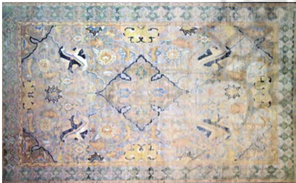
تصویر ۳: قالی ابریشمی مزین به طلا و نقره، قلعه واول، کراکو، اوایل قرن یازدهم (ماید، ۱۳۹۲:۱۱۳).

این گروه بیشترین فرش‌های این مجموعه را در خود جای داده‌است و نمونه‌های موجود لچک ترنج جزء برجسته‌ترین قالی‌های لهستانی می‌باشد که در کمال استادی طراحی شده‌اند. تعداد آثار این گروه ۲۵ قطعه است که یک مورد آن لنگه دیگری است. ترنج‌ها در جایگاه خود در ابعاد متعارف و گاهی بزرگتر از حد معمول نمود پیدا می‌کنند. برای نمونه یکی از خاصترین فرش‌های این مجموعه معرفی می‌شود. این قالی دارای طرحی متمایز است؛ زمینه فرش با تونالیت‌ها رنگی بسیار نزدیک به هم، مملو از گل و برگ‌های ختایی است. طراحی به گونه‌ای انجام شده که تسلط بر دو یا سه سطح و لایه‌پردازی کاملاً مشهود است. لچک و ترنج با خطوط تیره از متن جدا شده‌است. ترنج به صورت یک چهارم طراحی شده و ربع آن در گوشه‌ها، جای لچک نشسته‌است (تصویر ۳).