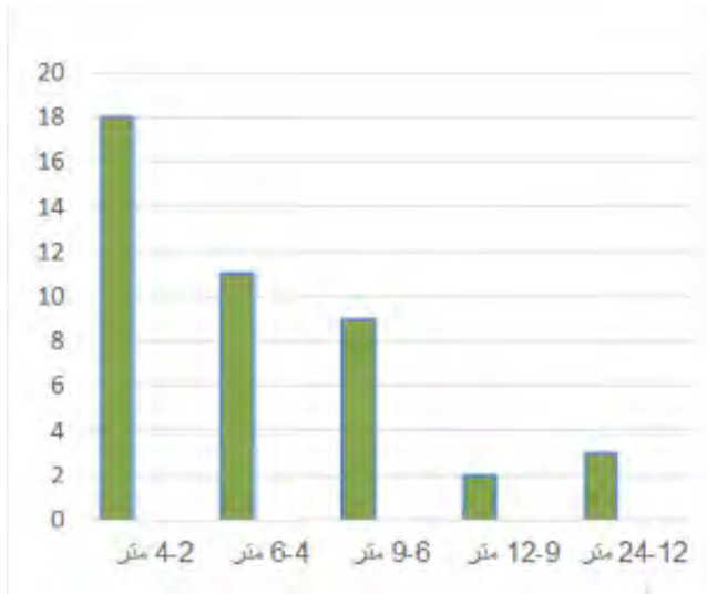
نمودار ۲: ابعاد رایج قالی‌های پولونزی