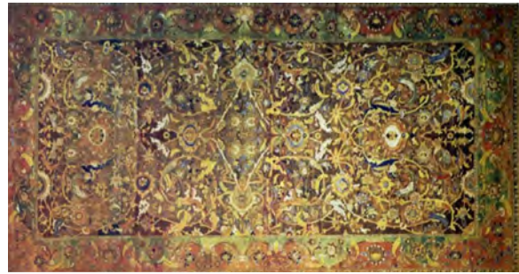
تصویر ۲: قالی افشان، نگارخانه ملی هنر واشنگتن، اوایل سده یازدهم هجری (پوپ و اکرم، ۱۳۸۷:۱۲۴۷)

از قالی‌ها، محتملاً قدیمترین آن‌ها، دارای یک نظام کاملاً مشخص از اسلیمی‌ها و ختایی‌های متقاطع‌اند (تصویر ۲). متن برخی از قالی‌ها به حجره‌های منظم تقسیم شده‌است. حجره‌ها با نوارها یا اسلیمی‌ها شکل گرفته‌اند و رنگ‌سایه‌های خفیف دارند (اتینگهاوزن، ۱۳۷۹:۳۱۹ و ۳۱۸).