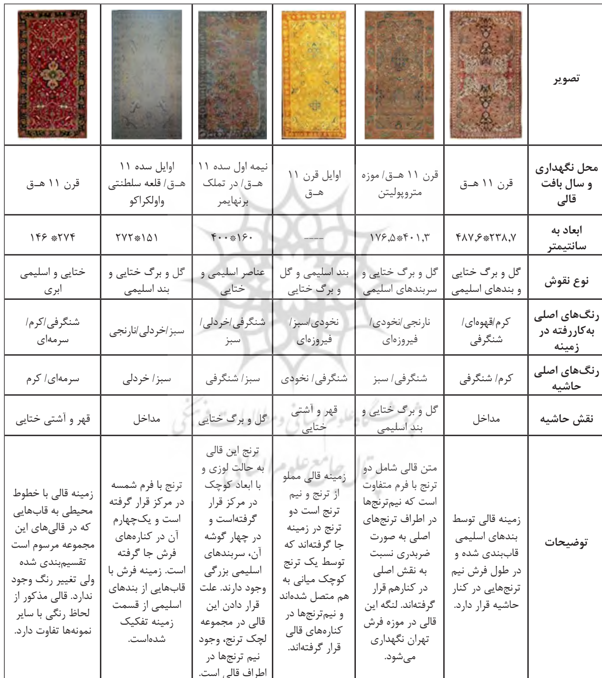
جدول ۱: بررسی قالی‌های لچک ترنج پولونزی

پس از دسته‌بندی انجام شده، به تحلیل فرمی (ابعاد، رنگ، شکل) قالی‌های پولونزی پرداخته می‌شود. با معیار قرار دادن طبقه‌بندی انجام شده، جداول تفکیک شده و جزئیات مورد بررسی قرار می‌گیرند. در نهایت نمودارهایی با توجه به قالی‌های این مجموعه که تصاویر آن‌ها در دسترس می‌باشند، اطلاعات به دست آمده تنظیم می‌شود.