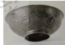
تصویر ۱۰: جام برنجی چهل کلید، خراسان، قرن ۱۱ هـ.ق، ارتفاع: ۲/۴ و قطر دهانه: ۸/۱۲ س. م (موزه ملی ایران، شماره موزه ۲۰۲۶۳).

جام برنجی چهل کلید با شماره موزه ۲۰۲۶۳ به سال ۱۶۳۰ م/۱۰۴۰ هـ.ق. در خراسان ساخته شده است. تمام سطح داخلی و خارجی ظرف مملو از کتیبه‌هایی است به خط نستعلیق و ثلث. روی لبه ظرف که سطح کمی دارد، سوره حمد نوشته شده و در ادامه آن «آیه‌الکرسی» آمده است که به