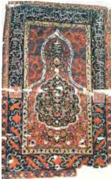
تصویر ۲: قالیچه سجاده‌ای، محل بافت: تبریز، قدمت: اواخر قرن ۱۰ و قرن ۱۱ هـ. ق. طول ۱۶۶ و عرض ۲/۱۰۸ سانتیمتر (موزه ملی ایران، شماره موزه ۳۴۰۶).

متن فرش دارای طرح محرابی است که اطراف این طرح درون حاشیه، آیه‌ای نوشته شده‌است و در قسمت بالای متن اسماء اعظم کتابت شده و در وسط متن ترنجی به رنگ سرمه‌ای نقش شده‌است (گانزرودن، ۱۳۵۷: ص ۶۲ و Pop; Vol. XI pl.1168B). حاشیه خارجی دارای زمینه قرمز است که به خط نستعلیق و به رنگ نخودی آیه ۲۸۵ سوره بقره بافته شده است. حاشیه میانی با زمینه سبز آیه ۲۵۵ بقره به خط ثلث و به رنگ نخودی نوشته شده‌است. حاشیه داخلی دارای زمینه نخودی که به خط نستعلیق و به رنگ سیاه آیات ۷۸ و ۷۹ سوره اسرا روی آن نوشته شده و حاشیه اطراف طرح محرابی به رنگ نخودی است و به خط نستعلیق و به رنگ قهوه‌ای آیات ۴۰ و ۴۱ سوره ابراهیم روی آن نوشته شده‌است. در دو سمت راست و چپ، در وسط حاشیه بزرگ، در متن سرمه‌ای رنگ، در درون دو مربع لاکه رنگ با شیوه گره چینی (کوفی بنایی) چنین نوشته‌اند: «لا اله الا الله محمد رسول الله علی ولی الله». در قسمت بالایی متن لاکه رنگ جانمازی، با خط آبی، کلمات زیر در قسمت‌های تعیین شده چنین آمده‌است: «بالله، یا رحمن، یا