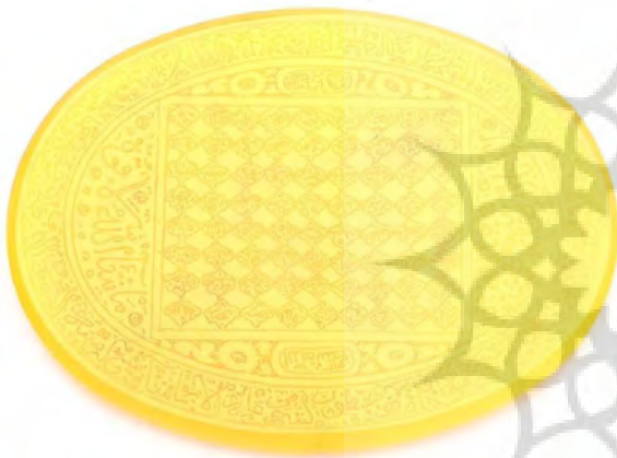
تصویر ۶: مهر از عقیق، دوره قاجار، طول: ۱/۵ س. م، عرض: ۸/۳ س. م، کتیبه: "آیه الکرسی" و "اسامی خداوند"، به خط نسخ و ثلث (موزه ملی ایران، شماره موزه: ۱۶۱۲).

همراه با خطوط مختلف به کتابت آیه الکرسی پرداخته اند می توان به آثار با شماره موزه های ۱۸۷۱ (تصویر ۵)، ۱۶۱۹ (آیه الکرسی در داخل مربع میانی و اسامی ۱۲ امام (ع) در دایره های کناری)، ۱۶۲۳ (کتیبه: شامل آیه الکرسی و اسامی ۱۴ معصوم (ع) به خط ثلث می باشد و به دوره صفوی تعلق دارد) و ۱۶۱۲ اشاره کرد (تصویر ۶).