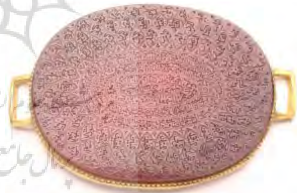
تصویر ۵: مهر از جنس عقیق به شکل بیضی مسطح با قاب طلا و کتیبه به خط نسخ و ثلث: آیاتی از قرآن کریم، آیه الکرسی، و ان یکاد، و نصر من الله و فتح قریب و اسامی خداوند (موزه ملی ایران، شماره موزه: ۱۸۷۱).

همراه با خطوط مختلف به کتابت آیه الکرسی پرداخته اند می توان به آثار با شماره موزه های ۱۸۷۱ (تصویر ۵)، ۱۶۱۹ (آیه الکرسی در داخل مربع میانی و اسامی ۱۲ امام (ع) در دایره های کناری)، ۱۶۲۳ (کتیبه: شامل آیه الکرسی و اسامی ۱۴ معصوم (ع) به خط ثلث می باشد و به دوره صفوی تعلق دارد) و ۱۶۱۲ اشاره کرد (تصویر ۶).