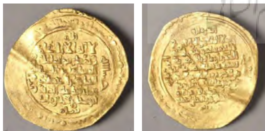
تصویر ۷: سکه زرین غیاث الدین ابو شجاع محمد (۴۹۸-۵۱۰ هـ ق) سلجوقی، وزن: ۱۴/۲، قطر: ۲۲/۶۸، محل ضرب سکه: اصفهان، سال ضرب سکه ۵۱۰ هـ ق (موزه ملی ایران، شماره موزه: ۳۹۸).

در میان جامعه آماری یک سکه با شماره موزه ۳۸۸ وجود دارد که آیه الکرسی بر آن حک شده است (تصویر ۷). روی سکه متن: «لاله الا الله، محمد رسول الله، المستظهر بالله، السلطان المعظم، غیاث الدنیا و الدین، ابوشجاع محمد