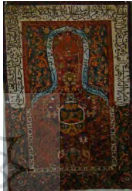
تصویر ۳: قالیچه سجاده‌ای

رحیم، یا کریم، یا قدیر، یا قدیم، یا عظیم، یا علیم، یا حکیم، یا قدوس، یا مالک، یا مقدم، یا مؤخر و یا عزیز». در قسمت بالای محراب و داخل آن که تقریباً سجده گاه نمازگزار است، عبارت «سبحان ربی العلی و بحمده» در فضای ترنجی شکلی نوشته شده است.