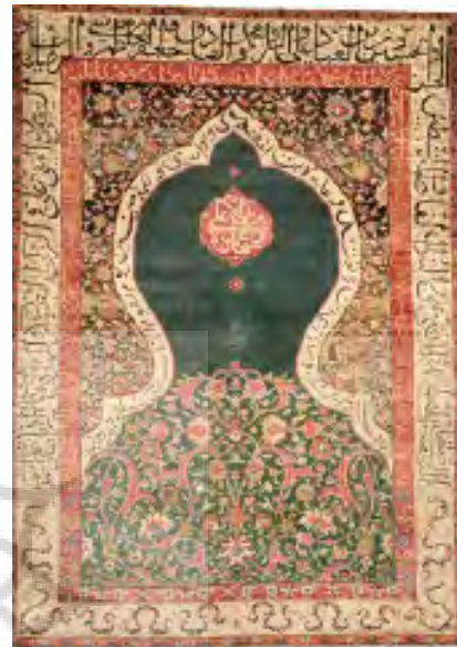
تصویر ۱: قالیچه سجاده‌ای، محل بافت: تبریز؛ قرن ۱۱ هـ. ق. طول آن ۱۴۵ و عرض ۱۰۲ سانتی متر (موزه ملی ایران، شماره موزه ۳۴۰۵).

(تصویر ۱)، ۳۴۰۶ (تصویر شماره ۲) و ۳۴۰۷ (تصویر شماره ۳) اشاره داشت. قالیچه‌های سجاده‌ای عموماً به اندازه‌های کوچک بافته شده‌اند و نقش اصلی آنها محرابی و اطراف آن مزین به آیات قرآنی و یا صلوات و ادعیه دیگر بوده‌است و بقیه قسمت‌ها را با نقوش اسلیمی و گل و بوته تزیین کرده‌اند.