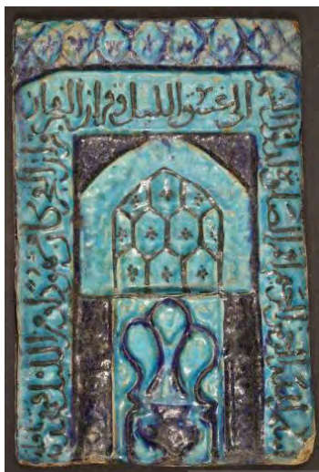
تصویر ۱۲: طول: ۲۹/۸ س. م.، عرض: ۲۰ س. م. (موزه ملی ایران، شماره موزه ۲۲۴۴۹).

الرحمن الرحيم“ شروع شده و در ادامه آن آیه ۲۵۵ از سوره بقره آمده است