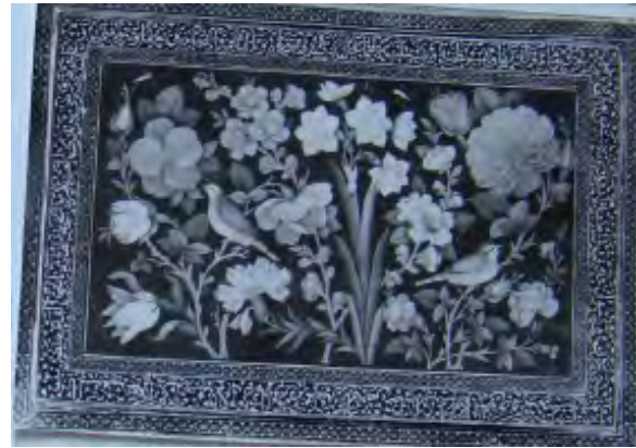
تصویر ۴: قاب آینه لاک، اوایل قاجار، طول ۳۰ و عرض ۲۰.۵ سانتی متر (موزه ملی ایران، شماره موزه: ۴۳۸۸).

بن ملک شاه». اطراف متن: «حسبنا الله و نعم الوکیل» (سوره مبارکه آل عمران آیه ۱۷۳)؛ حاشیه داخلی: «بسم الله الرحمن الرحیم ضرب هذا الدینار باصفهان سنه عشره و خمسمائه»؛ و پشت سکه متن: «العزه لله، الله لا اله الا هو الحی القيوم لا تاخذه سنه ولا نوم له ما فی السموات و ما فی الارض من ذالذی یشفع عنده الا باذنه یعلم ما بین ایدیهم و ما خلفهم ولا یحیطون بشئ من علمه الا بما شاء و سع کرسیه السموات و الارض و لایوده حفظهما و هو العلی العظیم» (سوره مبارکه بقره آیه ۲۵۵) (آیه الکرسی) کتابت شده است. این سکه احتمالا به میمنت ماه مبارک رمضان ضرب گردیده است. اطراف متن: «الحمد لله العظمه لله».