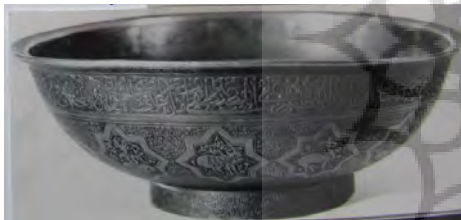
تصویر ۱۱: جام چهل کلید، قرن ۱۱، خط نستعلیق، ثلث و نسخ، (سوره‌های فاتحه، اخلاص، کافرون، فلق، الناس، نصر و آیه‌الکرسی و دعا و صلوات بر ائمه معصومین) (موزه ملی ایران، شماره موزه ۸۵۴۰).

نمونه دیگر از گروه دوم یک صفحه فولادی است که دارای شماره موزه ۲۳۶۹۱ می‌باشد. این صفحه فولادی با طول و عرض ۱۳.۵ سانتی‌متر است و تاریخ آن به قرن ۱۳ هـ.ق، می‌رسد. این اثر یک صفحه مستطیل است که قسمت بالای آن حالتی محرابی شکل دارد و از ۴ برآمدگی کوچک در دو طرف و یک برآمدگی بزرگ در وسط تشکیل شده است. روی صفحه سه سوراخ دیده می‌شود که دو تا در بالا و یکی در وسط صفحه قرار دارد و در یکی از سوراخ‌های بالا میخی پرچ شده است و دارای تزیینات کنده کاری و طلاکوبی است. در روی صفحه