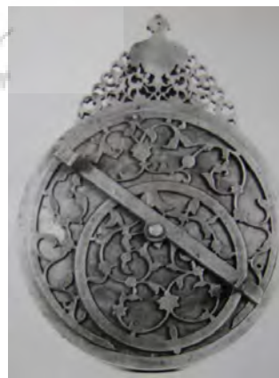
تصویر ۸: اسطرلاب، قرن ۱۲ هـ. ق.

بهترین مصداق آن در میان داده‌های پژوهش، سه پیراهن معروف به جامه فتح یا آیه‌الکرسی است که در نزد عموم به پیراهن (نادعلی) معروف هستند. این جامه‌ها کاملاً جنبه تعویذ داشته و استفاده از آن در دوره صفوی و پس از آن به هنگام گرفتاری و بیماری و یا وقت کارزار در زیر زره، جهت حفاظت در برابر بلا و خطرات رایج بوده‌است (ساریخانی، ۱۳۹۰: ص ۷۳).