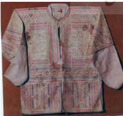
تصویر ۹: پیراهن

جامه فتح با شماره موزه ۸۳۷۵ که به پیراهن نادعلی یا آیه‌الکرسی نیز معروف است و تقریباً تمام سطح آن از آیات قرآن کریم و ادعیه مختلف پوشیده شده، لباسی است عباگونه که در پوشش بالاتنه کاربرد داشته و قسمتی از آستین‌های گشاد آن بدون نوشته‌است. دعای جوشن کبیر که از ۱۰۰ قسمت تشکیل شده‌است و اسماء خداوند را بیان می‌کند، بر روی پیراهن نادعلی مشاهده می‌شود که هر بخش از دعا، درون فضای دایره‌ای شکل نوشته شده‌است. در تحریر آیات و ادعیه روی پیراهن نادعلی از قلم‌های غبار، مشقی و جلی استفاده شده‌است. دومین پیراهن دارای شماره موزه ۸۴۰۳ (تصویر ۹) است. قدمت این پیراهن نخودی‌رنگ که در جلو و پشت، درون اشکال هندسی، دعا و آیاتی از قرآن به خط غبار و ثلث نوشته شده‌است و قسمت پایین دارای نقوش گل و بوته به رنگ‌های قرمز و سبز می‌باشد، به دوره صفوی می‌رسد.